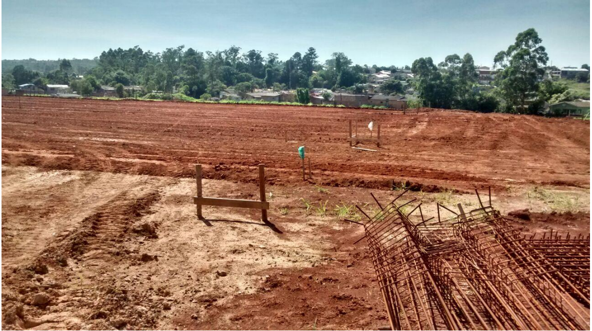
Figura 13: Local aonde será construída uma das quadras esportivas.