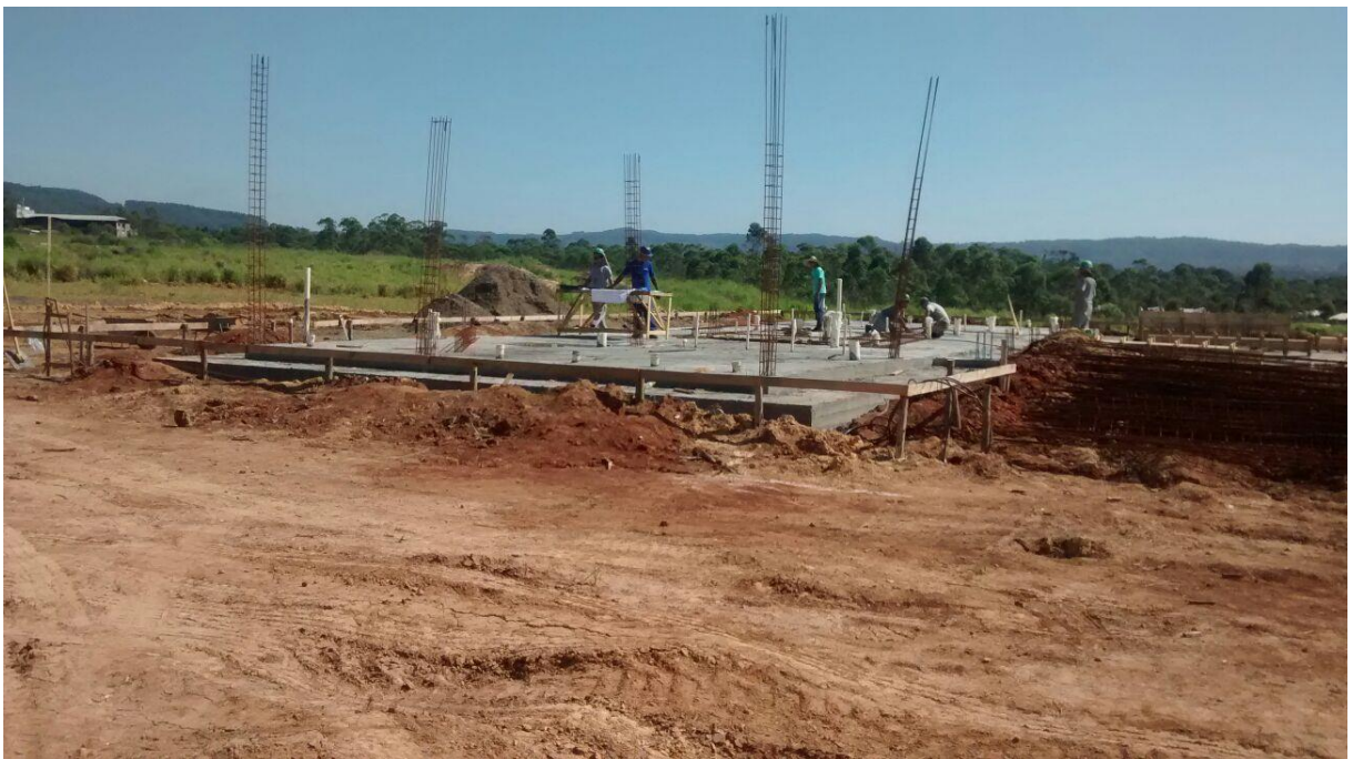
Figura 07: Laje em radier e armaduras dos sanitários e estar.