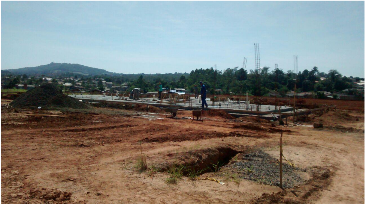
Figura 06: Construção dos sanitários e estar.