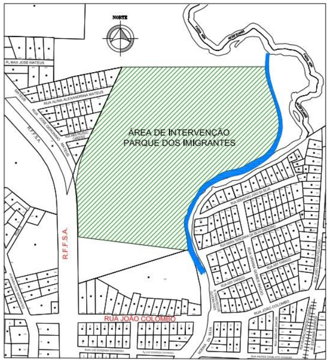
Figura 03: Planta de situação.