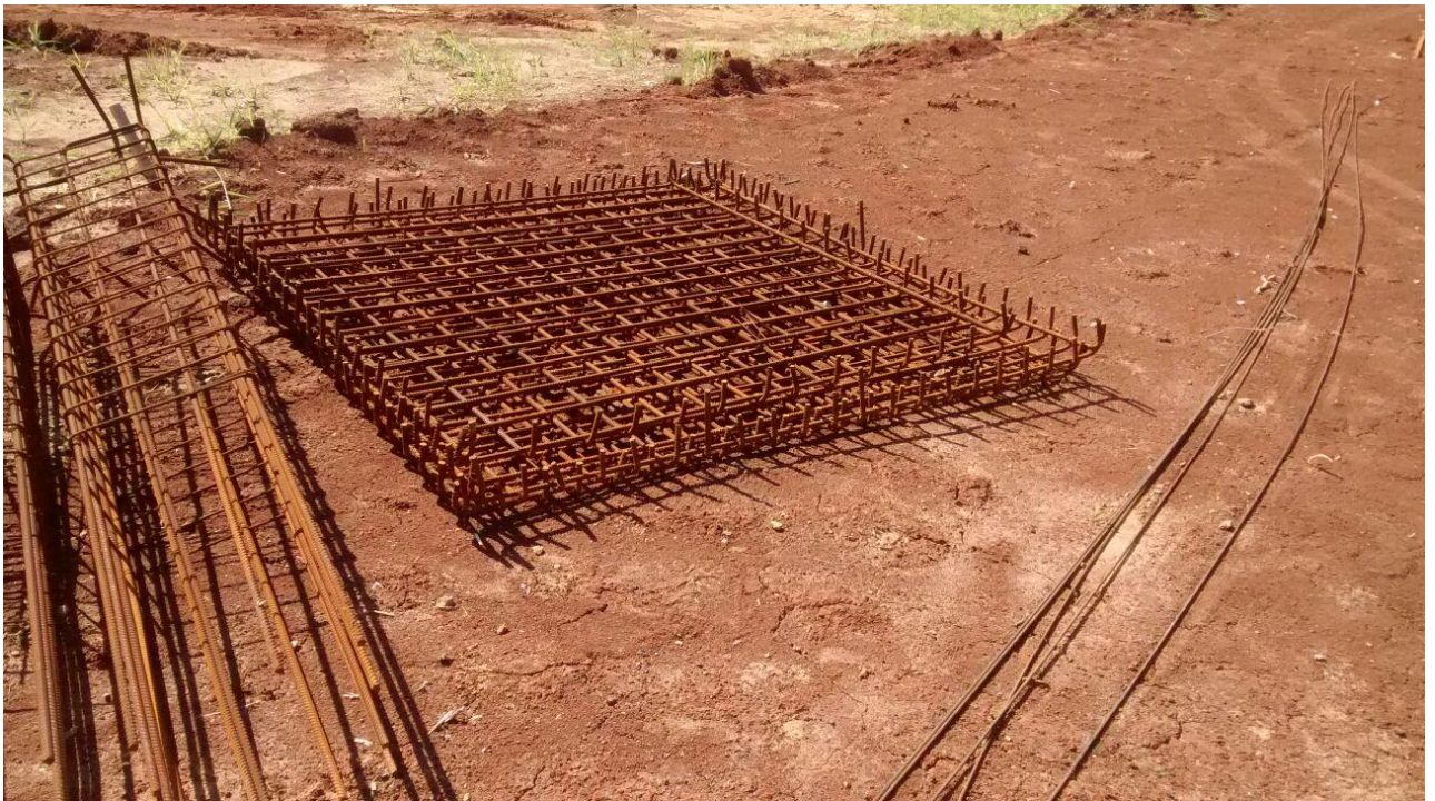
Figura 09: Armaduras a utilizar.