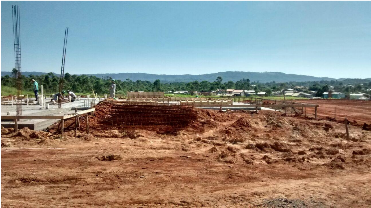
Figura 08: Construção dos sanitários e estar e armaduras a utilizar.