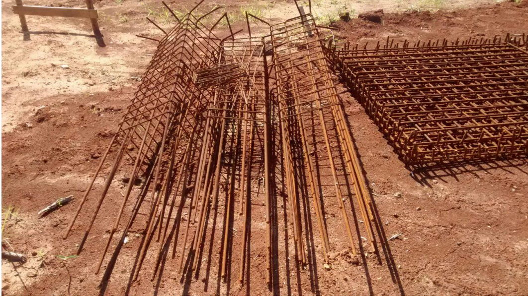
Figura 10: Armaduras a utilizar.

Também observou – se no local que existiam alguns materiais de construção a serem utilizados posteriormente na construção do parque, como areia e brita.