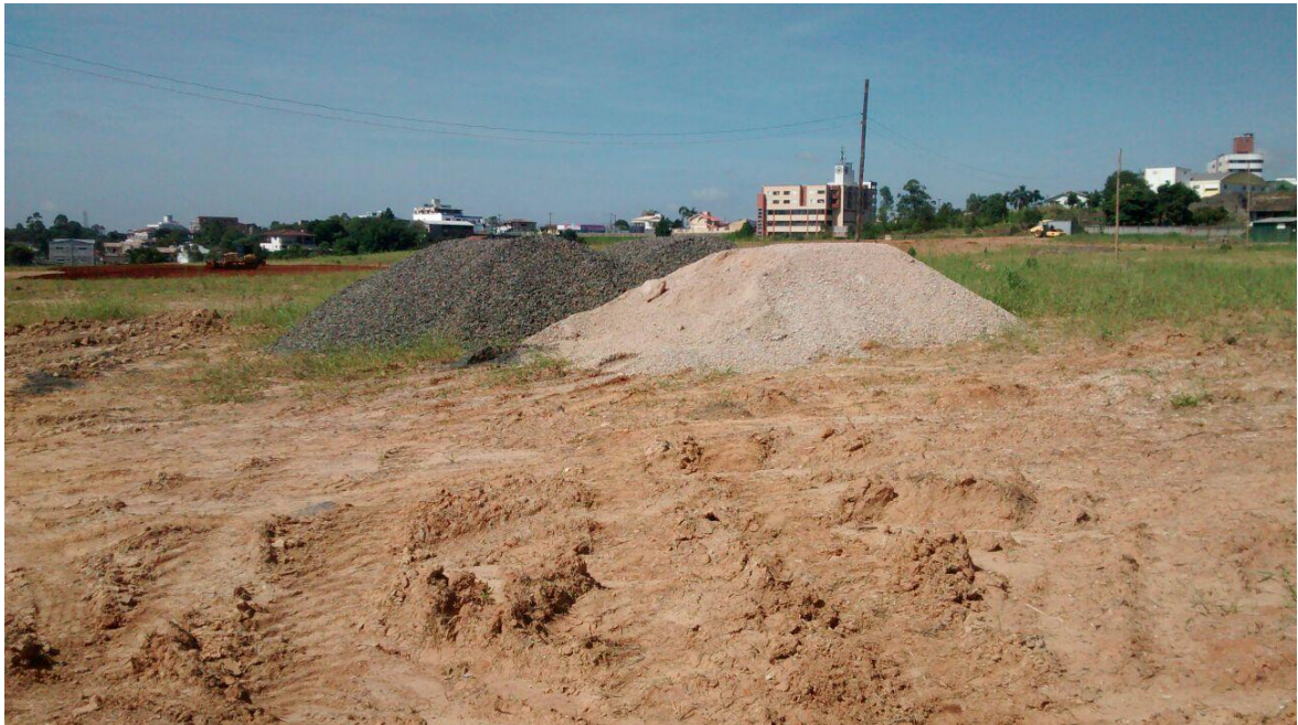
Figura 11: Materiais de construção a utilizar.

Também observou – se no local que existiam alguns materiais de construção a serem utilizados posteriormente na construção do parque, como areia e brita.