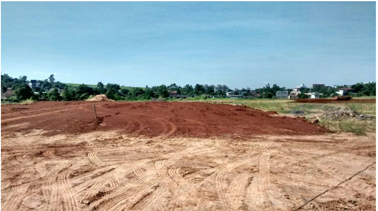
Figura 04: Preparação do terreno e execução da drenagem.

A visita durou cerca de 1 (uma) hora. Na visita anterior verificou – se que os serviços iniciais de terraplanagem e drenagem do terreno estavam sendo executados pelo Município de Criciúma, no entanto devido as chuvas estes serviços estavam atrasados, nesta visita ainda estavam executados alguns serviços de drenagem e terraplanagem, porém em outra área do parque. Na área em que estes serviços já foram executados pode – se constatar que a empresa contratada já iniciou alguns serviços de construção do parque, conforme será descrito neste relato.