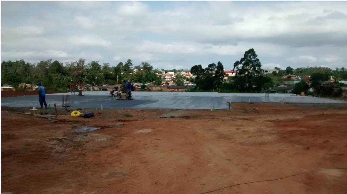
Figura 16: Concretagem das quadras.

A equipe também pode observar na visita ao Parque do Imigrante que estava sendo feito o adensamento do concreto na quadra poliesportiva e na quadra de treino de basquete.