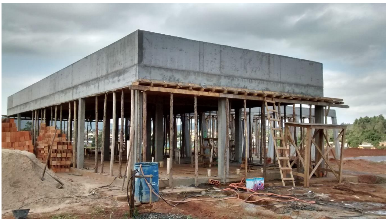
Figura 04: Local que abrigará os sanitários e estar. (Fonte: Dos autores 2016)

A visita durou cerca de 1 (uma) hora, durante a visita a equipe pode observar que a obra já apresentou certa evolução com relação à última visita realizada. Por exemplo, a construção do sanitário e estar e das quadras poliesportivas, que estavam em seu início anteriormente e já apresentaram um certo desenvolvimento, conforme será demonstrado neste documento. Além do mais estavam sendo realizados alguns trabalhos de drenagem em outras áreas do parque.