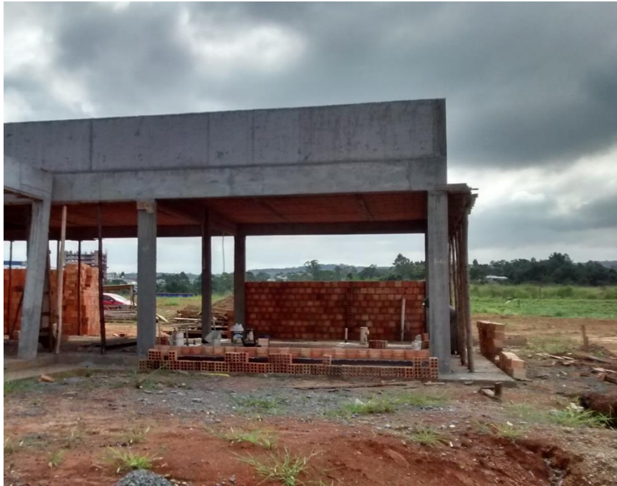
Figura 12: Construção da parede.

Em outro ponto dos sanitários e estar foi observado que estavam sendo executadas as paredes, ainda pode – se constatar que na base das paredes estava sendo aplicado um produto químico para evitar a ação da umidade nas paredes.