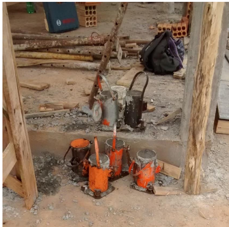
Figura 09: Corpos de provas do concreto utilizados.

No local ainda pode – se observar que a empresa responsável pela obra realiza o controle tecnológico do concreto utilizado na obra, através da realização de ensaios com corpos de provas para averiguar a resistência do concreto utilizado.