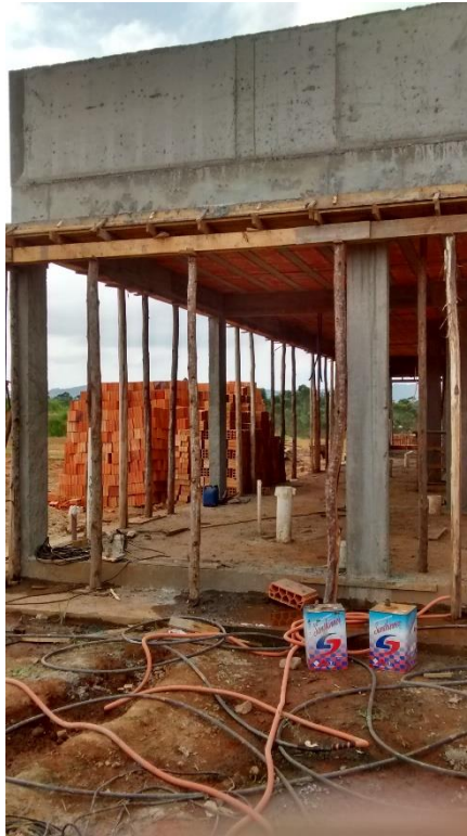
Figura 06: Escoramento da laje.