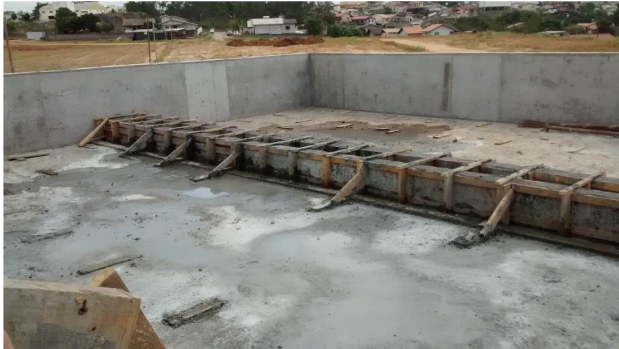
Figura 08: Laje concretada.

No local ainda pode – se observar que a empresa responsável pela obra realiza o controle tecnológico do concreto utilizado na obra, através da realização de ensaios com corpos de provas para averiguar a resistência do concreto utilizado.