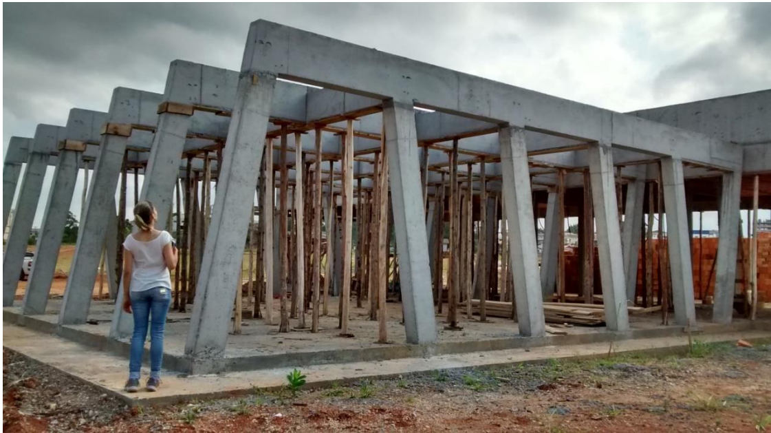
Figura 10: Estrutura de concreto da entrada dos sanitários e estar.

Foi executada na entrada dos sanitários e lazer uma estrutura de concreto com pilares inclinados, afim de deixar a estrutura esteticamente mais bonita.