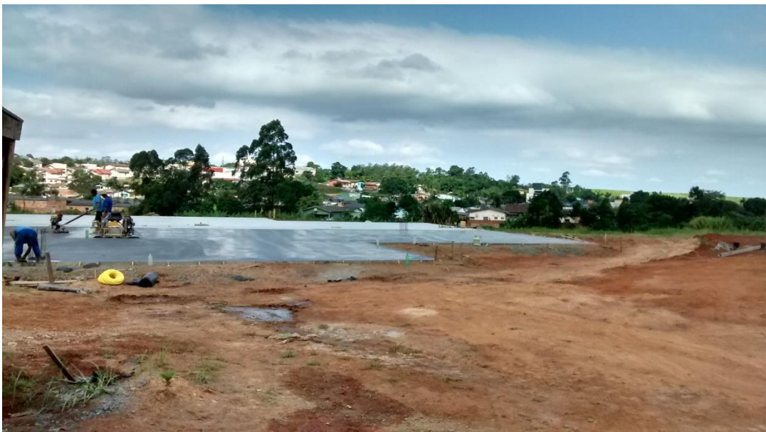
Figura 17: Concretagem das quadras.