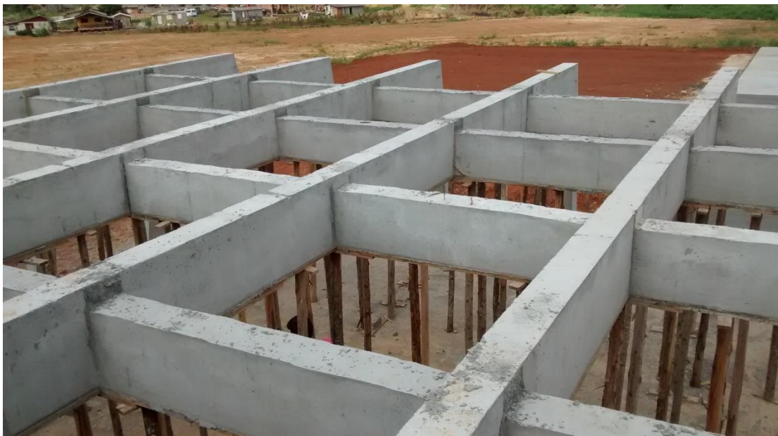
Figura 11: Vista superior da estrutura de concreto.