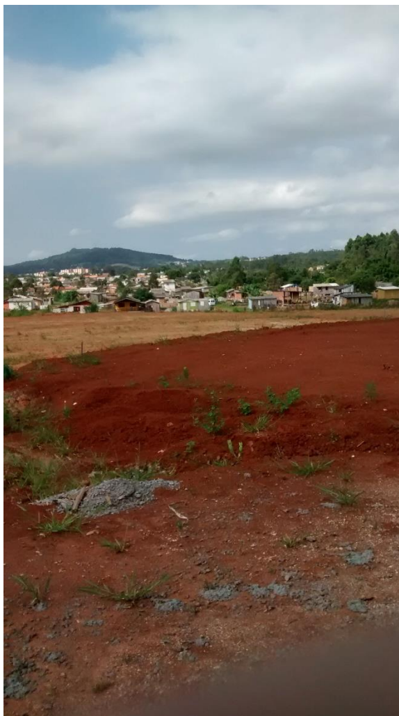
Figura 18: Local aonde será construído o campo de areia.

Também observou – se que ao lado das quadras em construção estava locado o local para a instalação do campo de futebol de areia.