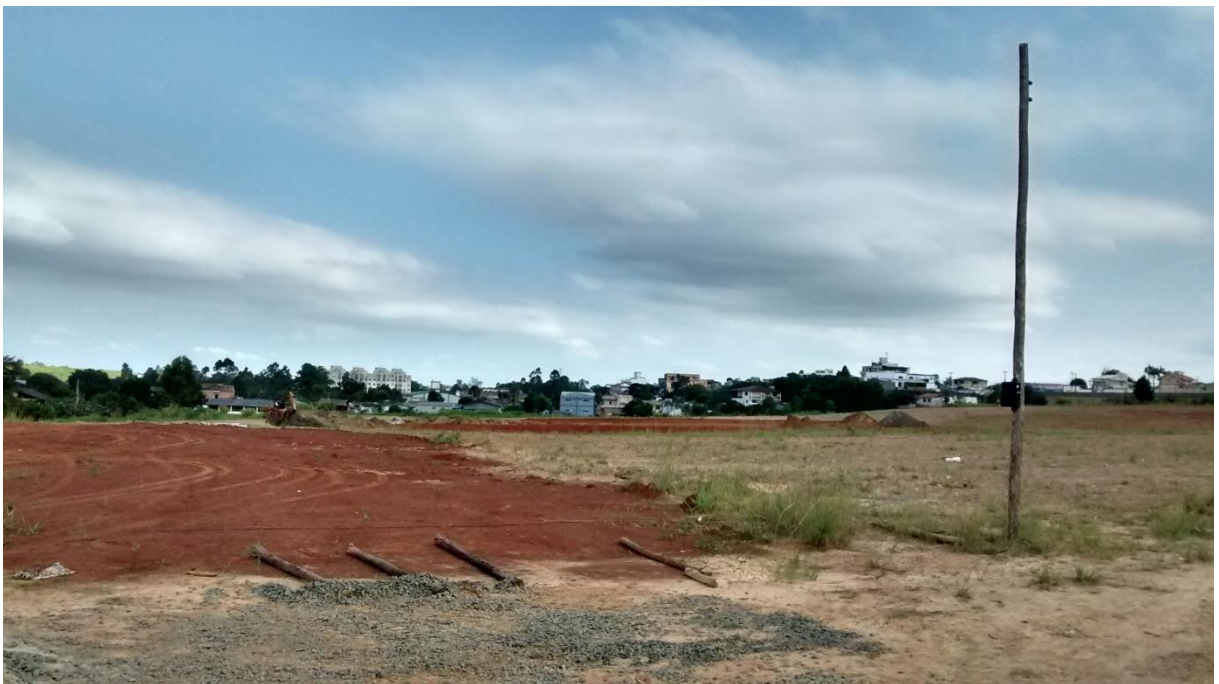
Figura 20: Execução de trabalhos da empresa responsável pela obra.