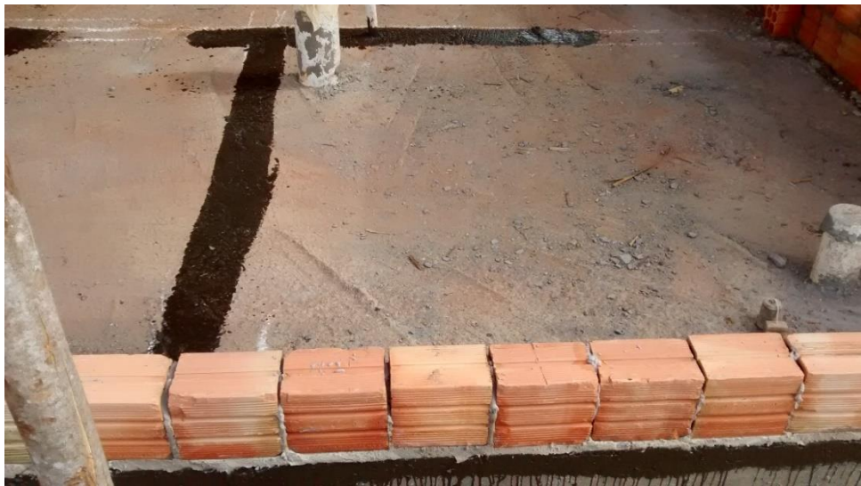
Figura 13: Utilização de produtos contra a umidade.