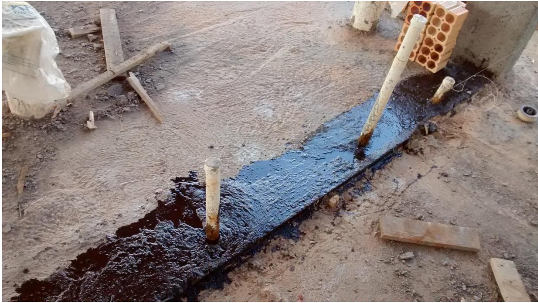
Figura 14: Utilização de produtos contra a umidade.