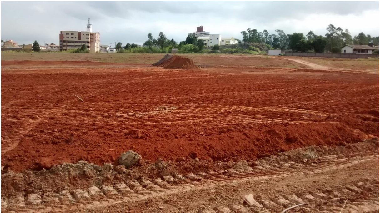
Figura 19: Preparação do terreno do parque. (Fonte: Dos autores 2016)