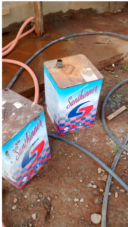
Figura 15: Produtos químicos utilizados contra a umidade.