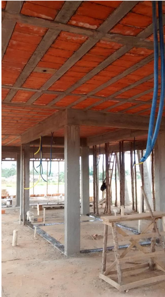
Figura 05: Área interna dos sanitários e estar. (Fonte: Dos autores 2016)

Na construção dos sanitários e estar a equipe pode verificar que a estrutura destes ambientes já estava executada, conforme verifica –se na imagem anterior as lajes e vigas já estavam executadas assim como os pilares.