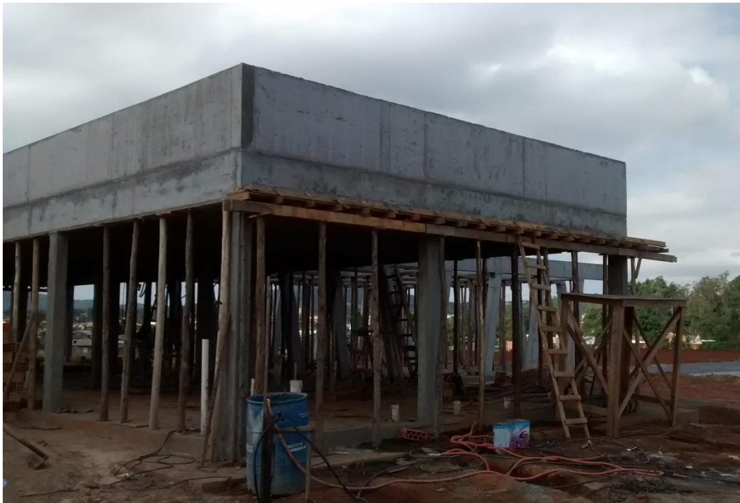
Figura 07: Escoramento laje.