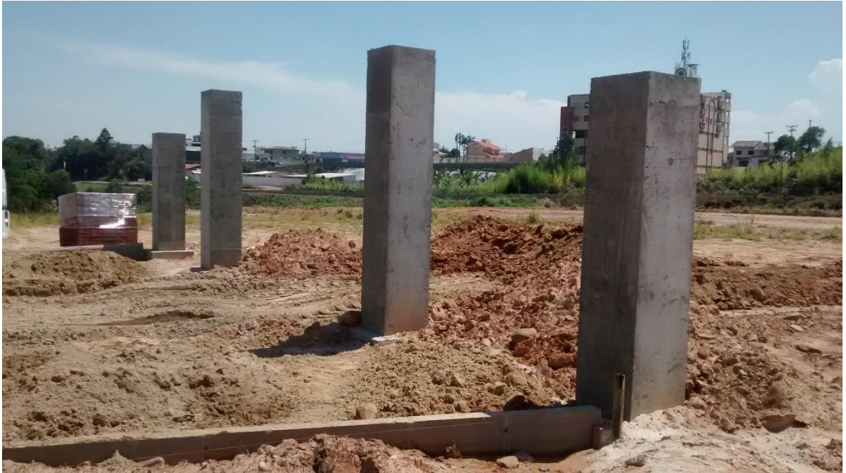
Figura 07: Portão de acesso principal ao Parque do Imigrante.