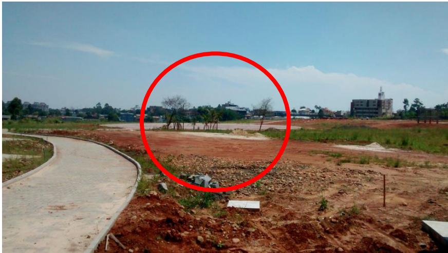
Figura 11: Detalhe das árvores plantadas.

Alguns trabalhos de paisagismo também foram executados no parque, conforme evidenciado foi feito o plantio de algumas árvores em um local próximo à área de convivência, conforme informado as árvores vieram da Praça da Paróquia Santo Agostinho, que também está passando por obras.