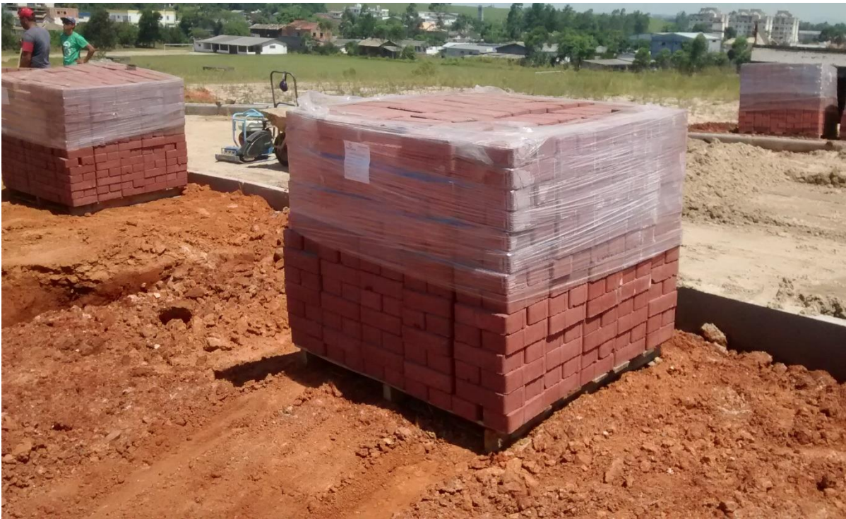
Figura 06: Caminho em execução.