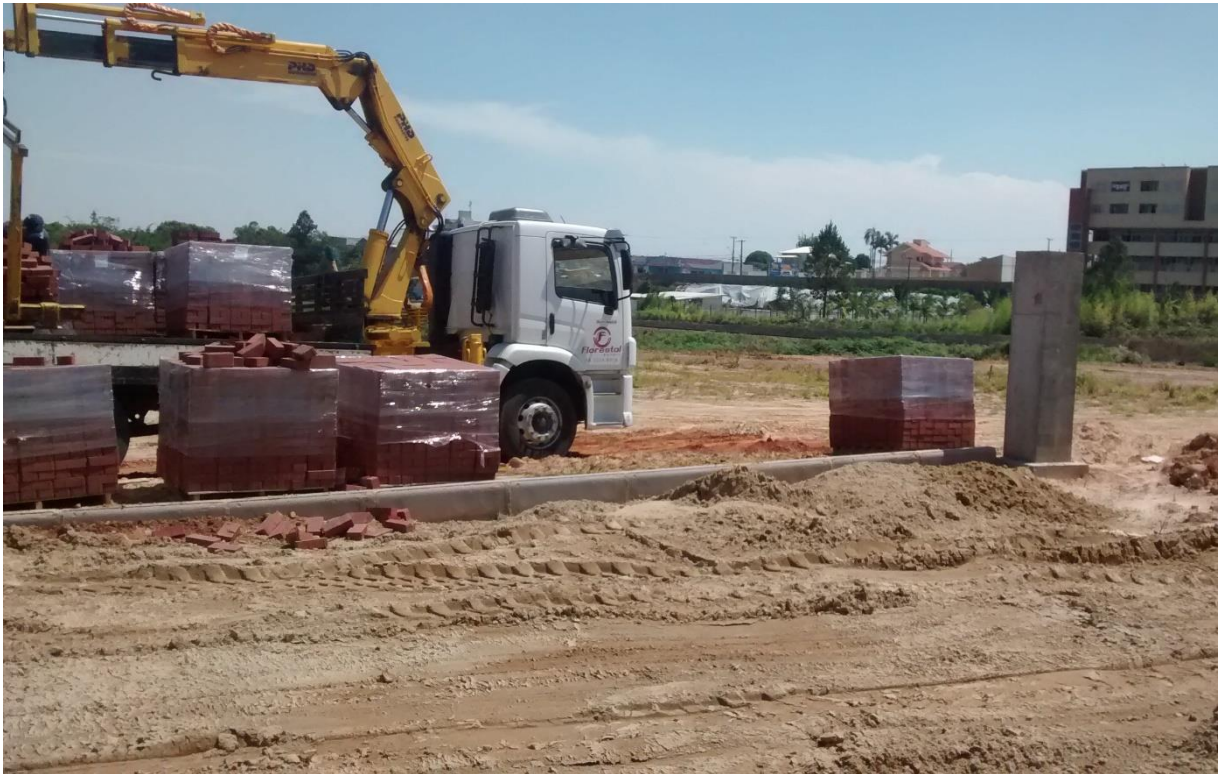
Figura 09: Descarregamento dos blocos de concreto tipo paver.

No dia da realização da visita a equipe também pode acompanhar a chegada de um carregamento de blocos de concreto tipo paver, que posteriormente serão utilizados na pavimentação dos caminhos.