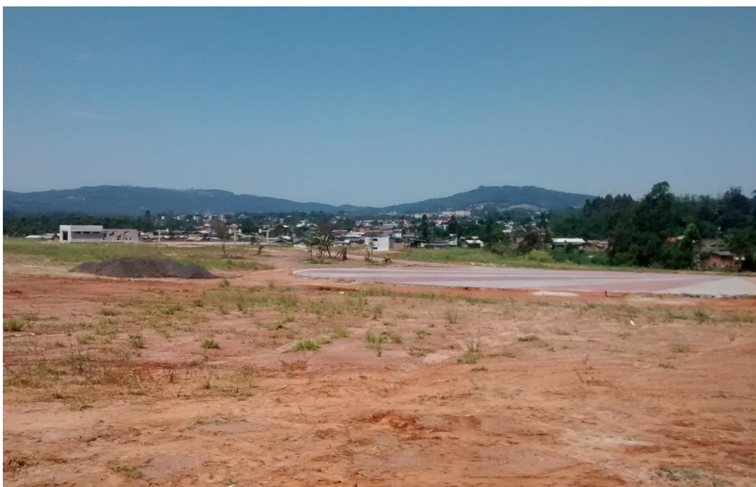
Figura 04: Vista geral do Parque dos Imigrantes.

De acordo com o constatado no dia da realização da visita apenas estavam em execução alguns caminhos existentes no parque, além de outros pequenos trabalhos, conforme ilustram as imagens a seguir: