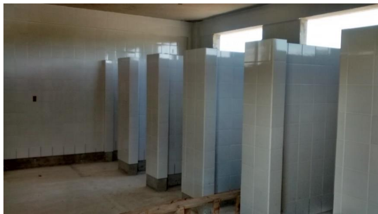
Figura 12: Revestimento cerâmico sanitário feminino.

Na construção dos sanitários/estar a equipe pode verificar que foi executado o assentamento dos revestimentos cerâmicos nas paredes da área interna dos ambientes.