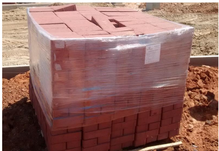
Figura 10: Embalagem dos blocos de concreto tipo paver. (Fonte: Dos autores 2016)