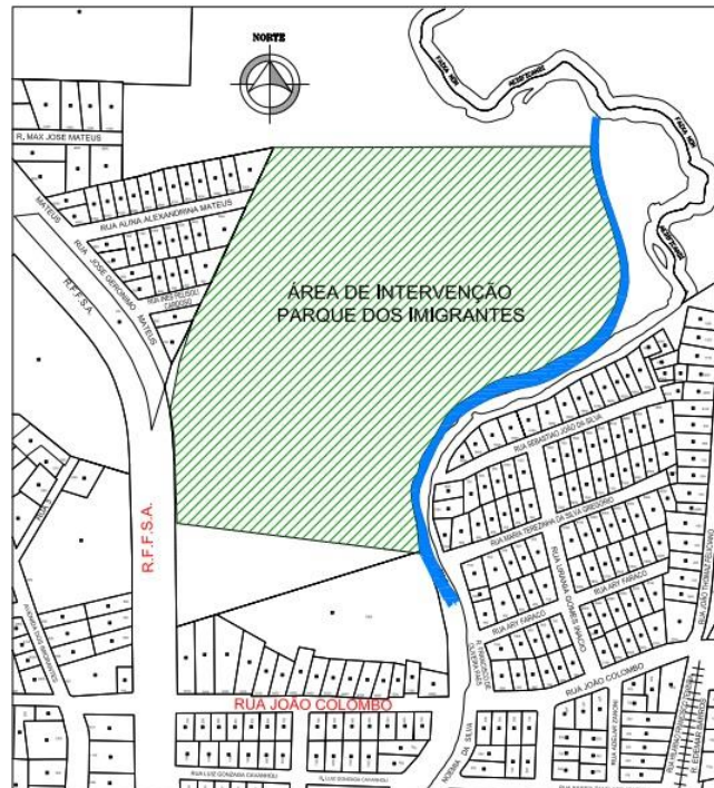
Figura 03: Planta de situação.