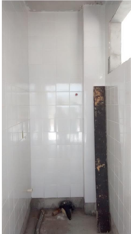
Figura 13: Revestimento cerâmico área de serviço.