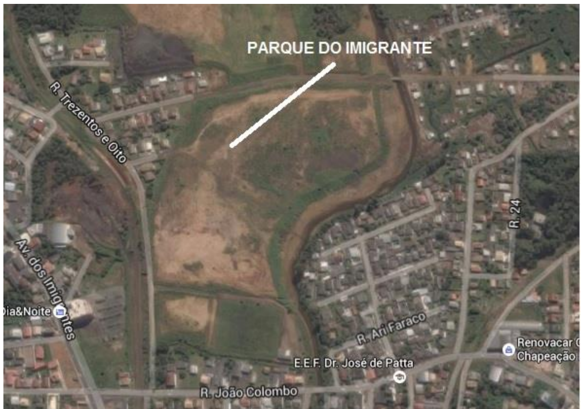
Figura 01: Localização do Parque dos Imigrantes.

A obra em acompanhamento está sendo implantada numa área de 61.094,00 m 2 , anexo ao Anel de Contorno Viário de Criciúma, bairro Vila Francesa, Distrito de Rio Maina - Criciúma/SC