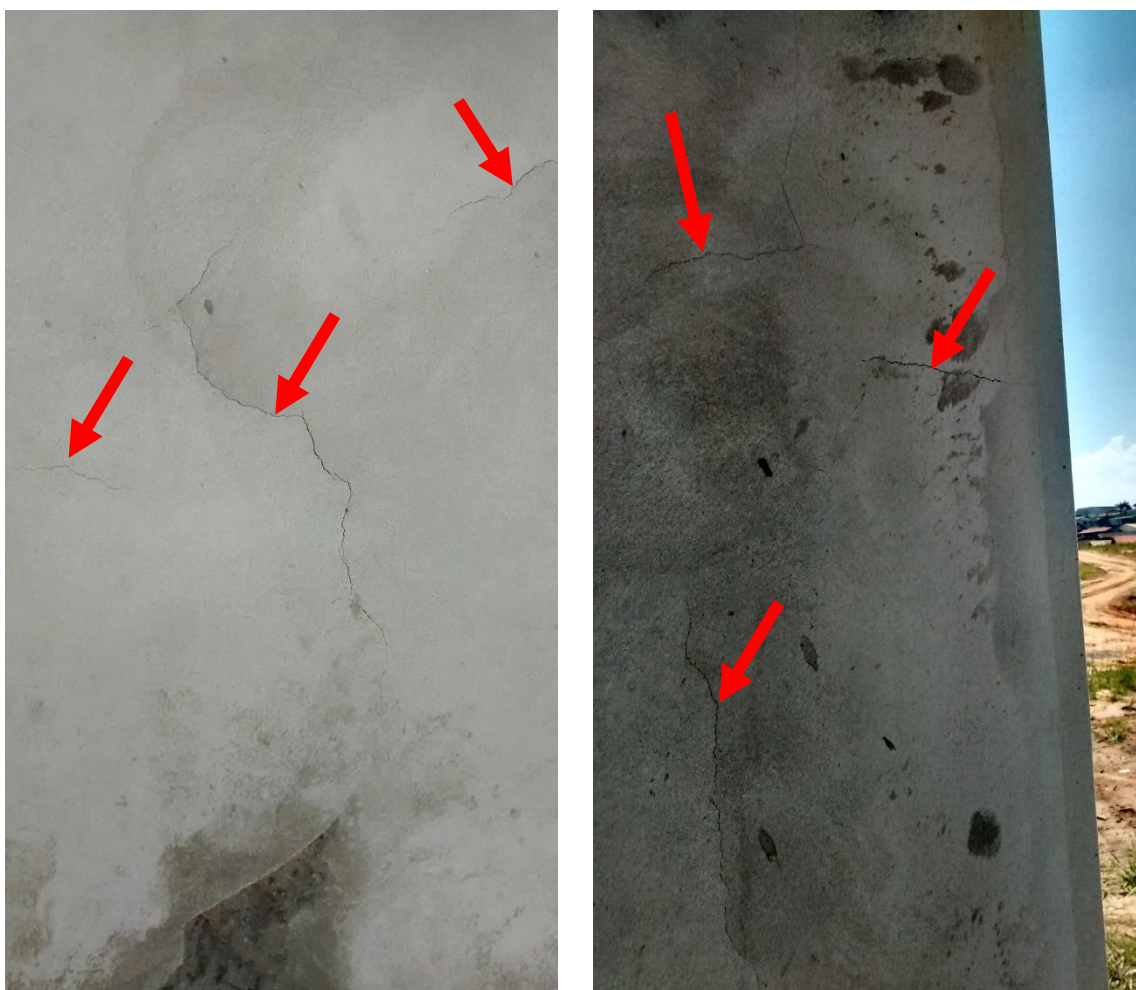
Figura 15: Fissuras existentes nos sanitários/estar.

Além da pequena evolução no andamento das obras a equipe da Câmara de Infraestrutura do Observatório Social de Criciúma pode evidenciar diversos problemas remanescentes das últimas visitas realizadas, problemas estes como as fissuras, existentes nas quadras poliesportivas, subestação e sanitários/estar.