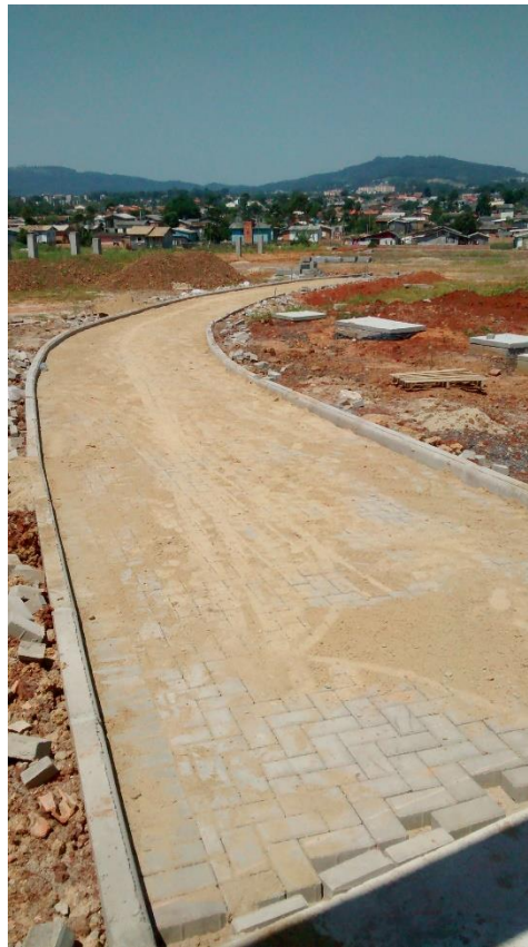
Figura 08: Caminho de acesso aos estacionamentos 01 e 02.