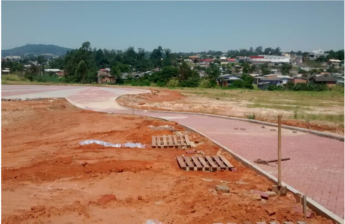
Figura 05: Caminho em execução.