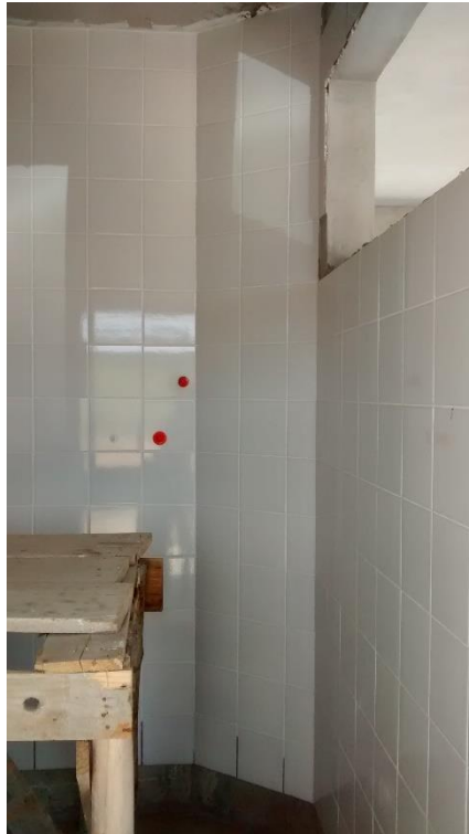
Figura 14: Revestimento cerâmico fraldário.