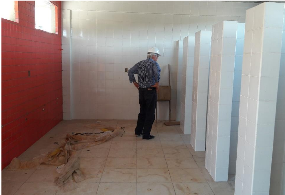
Figura 7: Sanitário feminino