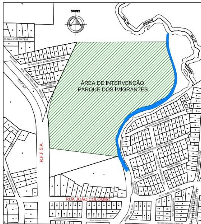
Figura 3: Planta de situação.