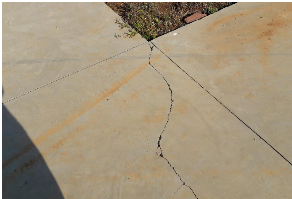
Figura 6: Fissura quadra poliesportiva