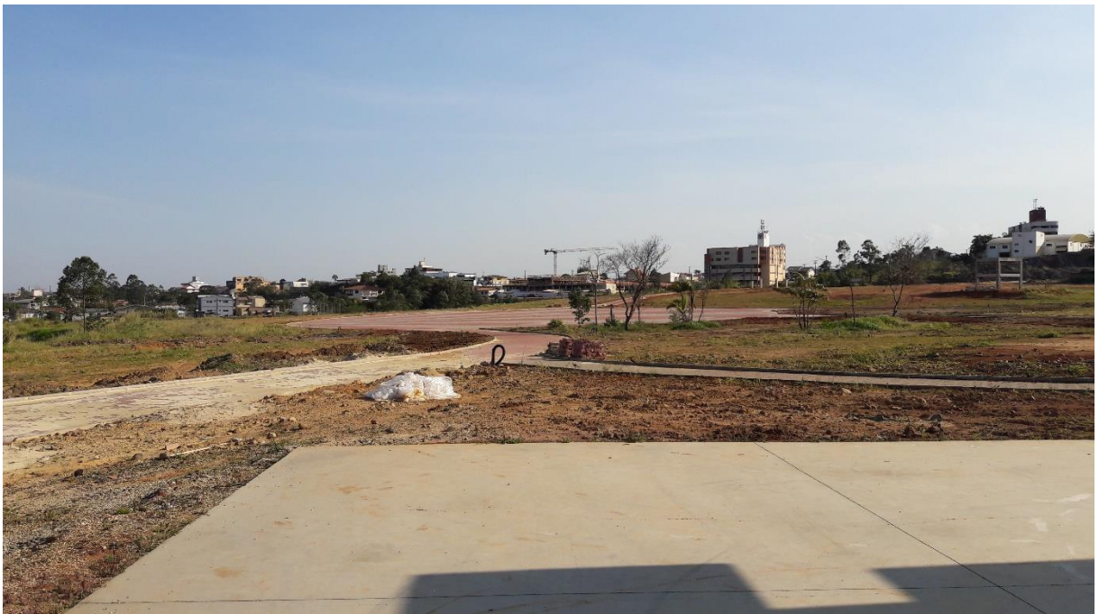
Figura 4: Visão da praça central do parque

A visita durou cerca de 30 (trinta) minutos, durante a ocorrência desta, a equipe do Observatório Social de Criciúma pode observar que a obra apresentou pouca evolução com relação à última visita realizada, inclusive foi constatado que havia apenas um funcionário trabalhando no canteiro de obras.