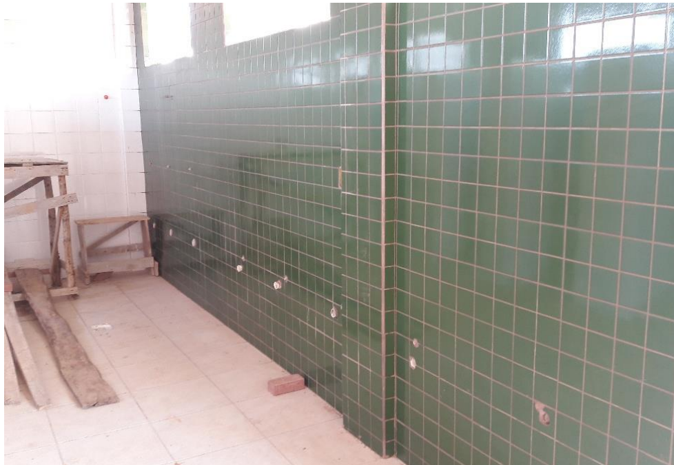
Figura 8: Sanitário masculino