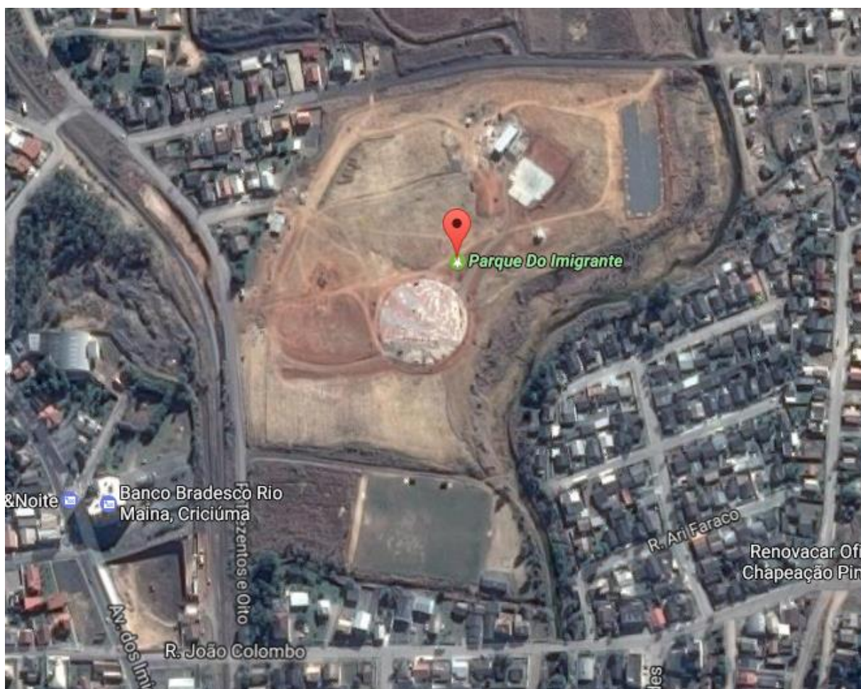
Figura 1: Localização do Parque dos Imigrantes.

A obra em acompanhamento está sendo implantada numa área de 61.094,00 m 2 , anexo ao Anel de Contorno Viário de Criciúma, bairro Vila Francesa, Distrito de Rio Maina-Criciúma/SC