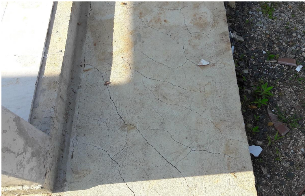
Figura 5: Fissuras calçada pergolado

Além das fissuras na quadra, também foi verificada as aparentes na calçada ao redor do pergolado anexo aos sanitários, onde estas também apresentaram um aumento significativo.