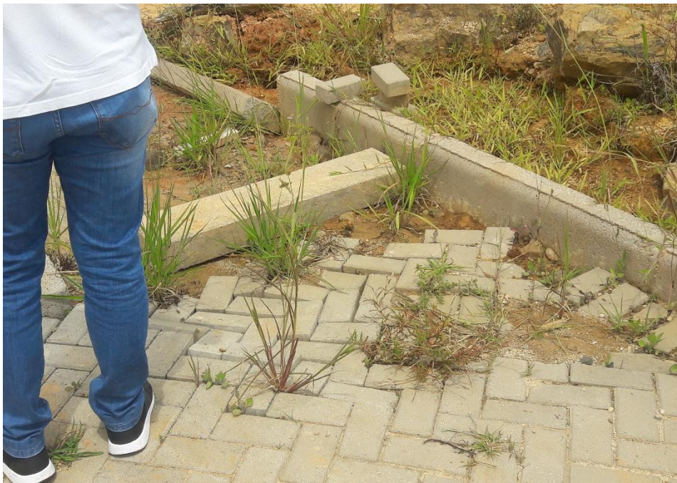
Figura 11: Ponto de acúmulo de água e surgimento de vegetação