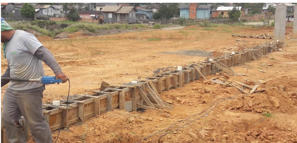
Figura 6: Trecho de concretagem