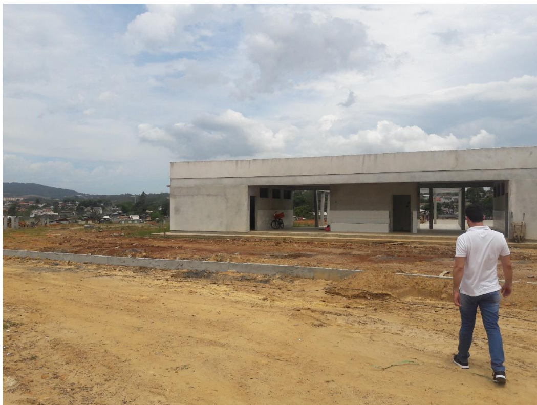
Figura 4: Edificação dos sanitários

A visita durou cerca de 30 (trinta) minutos e durante a ocorrência desta, a equipe do Observatório Social de Criciúma pode observar que a obra apresentou pouca evolução com relação à última visita realizada, no entanto haviam mais trabalhadores no local e estavam em bom ritmo de serviço.