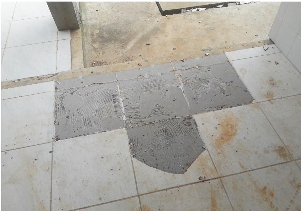
Figura 8: Piso quebrado