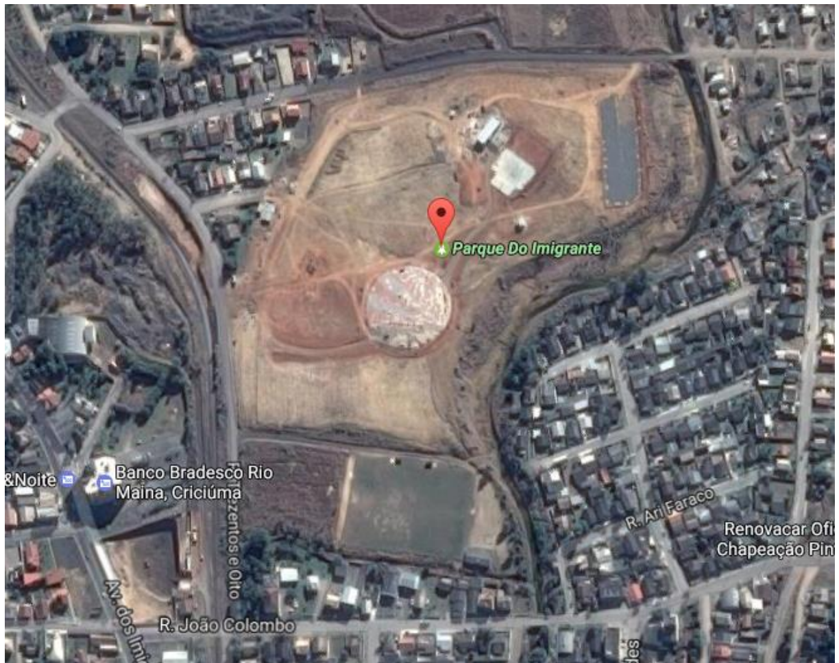
Figura 1: Localização do Parque dos Imigrantes.

A obra em acompanhamento está sendo implantada numa área de 61.094,00 m 2 , anexo ao Anel de Contorno Viário de Criciúma, bairro Vila Francesa, Distrito de Rio Maina-Criciúma/SC