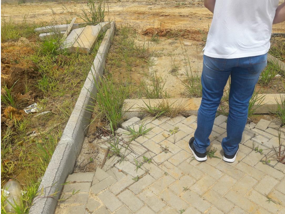
Figura 10: Vegetação entre pavers