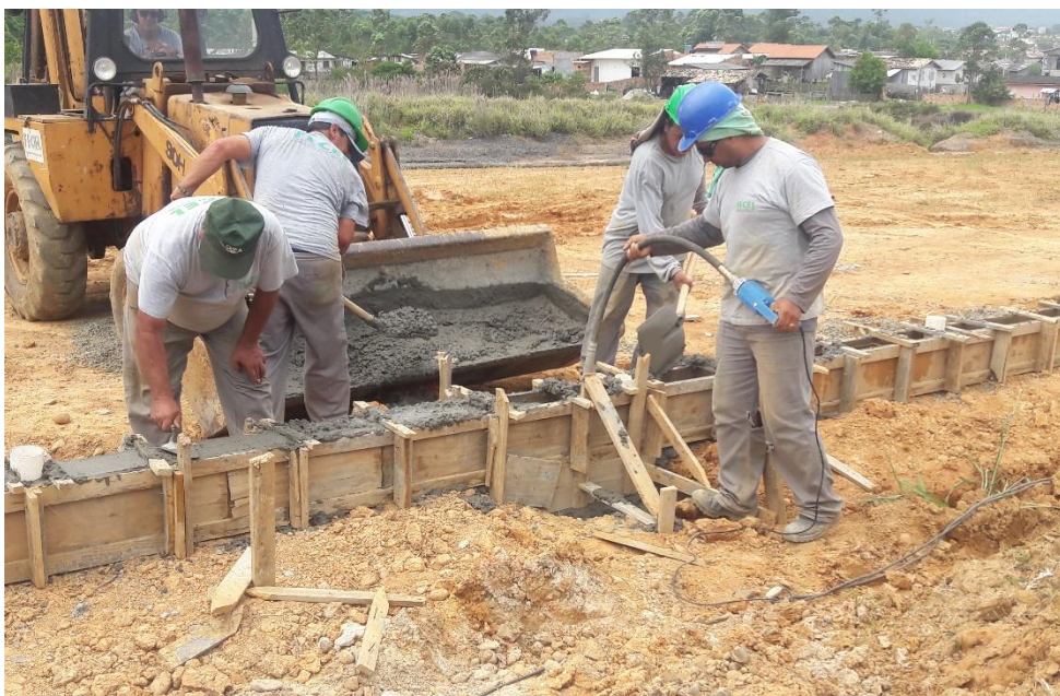
Figura 5: Concretagem da viga

Todo perímetro do parque cera cercado da mesma forma, sendo feitas as vigas de concreto armado e já deixado o espaço para inserção do tudo em ferro galvanizado para posteriormente ser chumbado, além da instalação da tela no espaçamento entre cada tubo. Os únicos lugares que a viga terá altura diferente será nos portões de acesso, onde esta também será construída, porém será feito um rebaixamento para esta ficar na altura do passeio.