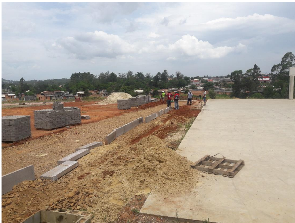
Figura 9: Alinhamento do meio fio no passeio

Em ritmo mais lento está sendo realizado a pavimentação de outro trecho do passeio, realizando a sub base em camada de 20cm e posteriormente as outras etapas até o assentamento do paver. Além deste serviço, estão fazendo o alinhamento e assentamento do meio fio do passeio.