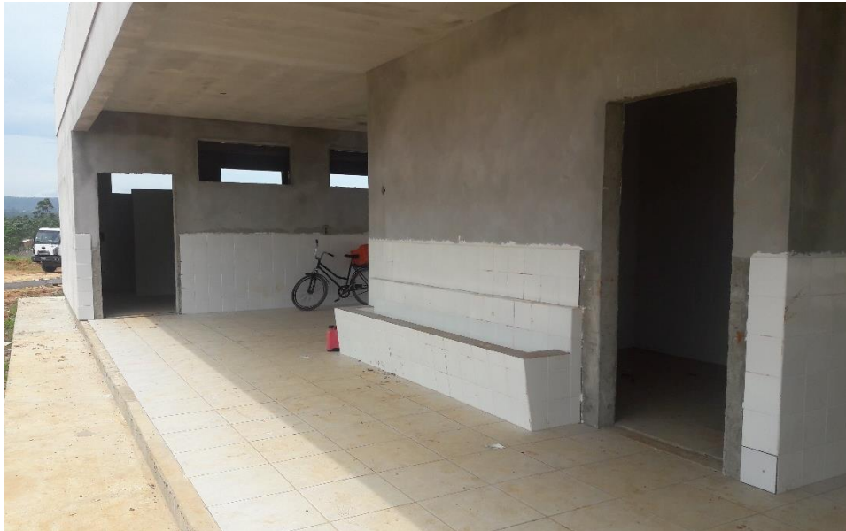
Figura 7: Acesso sanitários

Na região dos sanitários não estão mais realizando nenhum serviço, ficando finalizados até a etapa de assentamento dos pisos e azulejos até o momento. No entanto, nesta região foi possível analisar que em um local deverá ser feito um novo assentamento devido à quebra das peças.