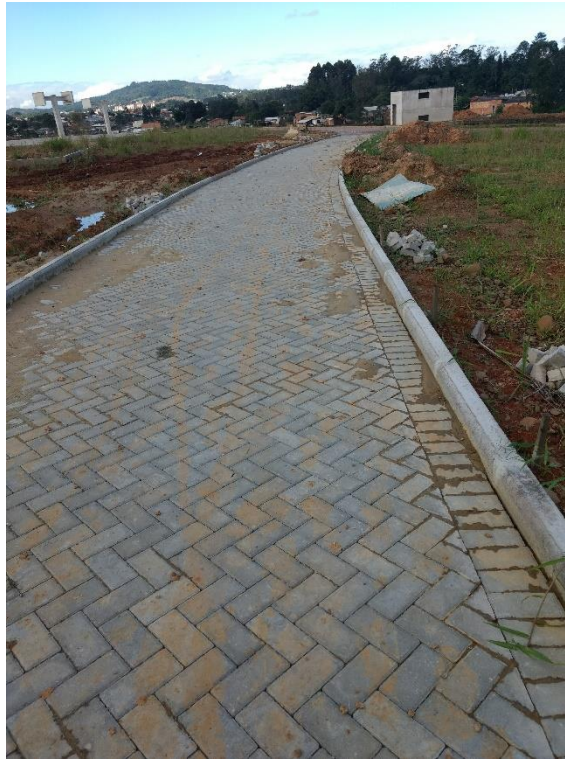
Figura 7: Instalação de paver na cor cinza. (Fonte: Dos Autores 2018)

A equipe notou que, na área de lazer e banheiros, foi iniciado os reparos dos pontos onde haviam pisos quebrados e na região do banheiro, onde foram furtados todos os registros. Foi feita a retirada do material quebrado, para que assim fosse possível ser reparado.