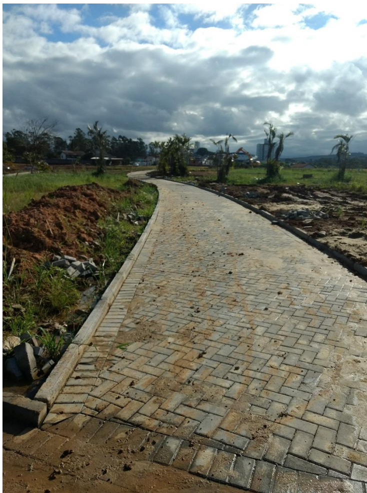
Figura 4: Instalação de paver na cor cinza.

A visita durou cerca de 1(uma) hora, e verificou-se que haviam mais trabalhadores presentes.