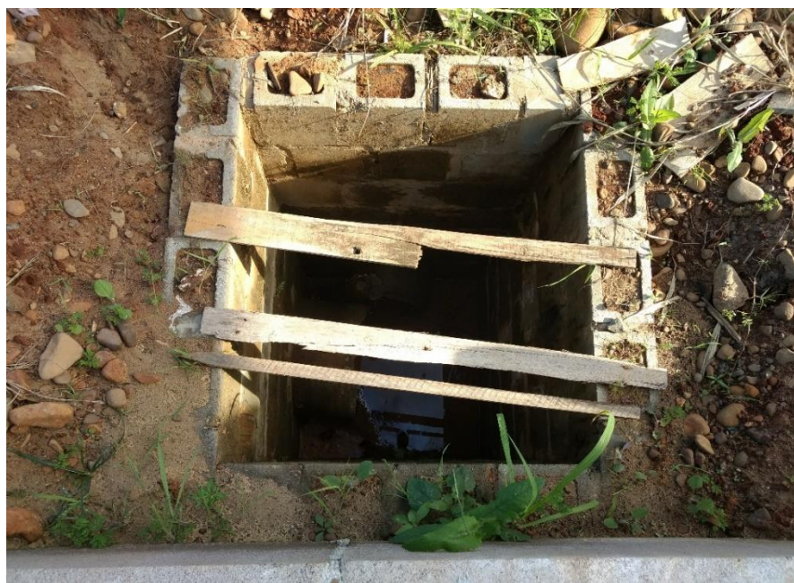
Figura 11: Boca de lobo do parque.