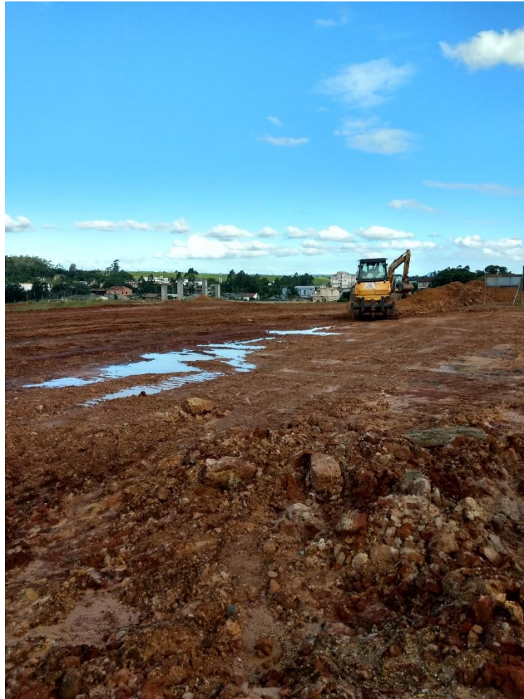
Figura 5: Maquinas realizando a terraplanagem.

No momento da visita estava sendo feito a terraplanagem em toda a extensão do parque, sendo utilizadas algumas máquinas para realizar essa etapa. Executavam também a construção de um talude entre o parque e o rio Sangão, a mesma realizada por uma máquina, a qual também preparava o meandro do rio, cuja etapa é muito importante para evitar futuros problemas com inundações.