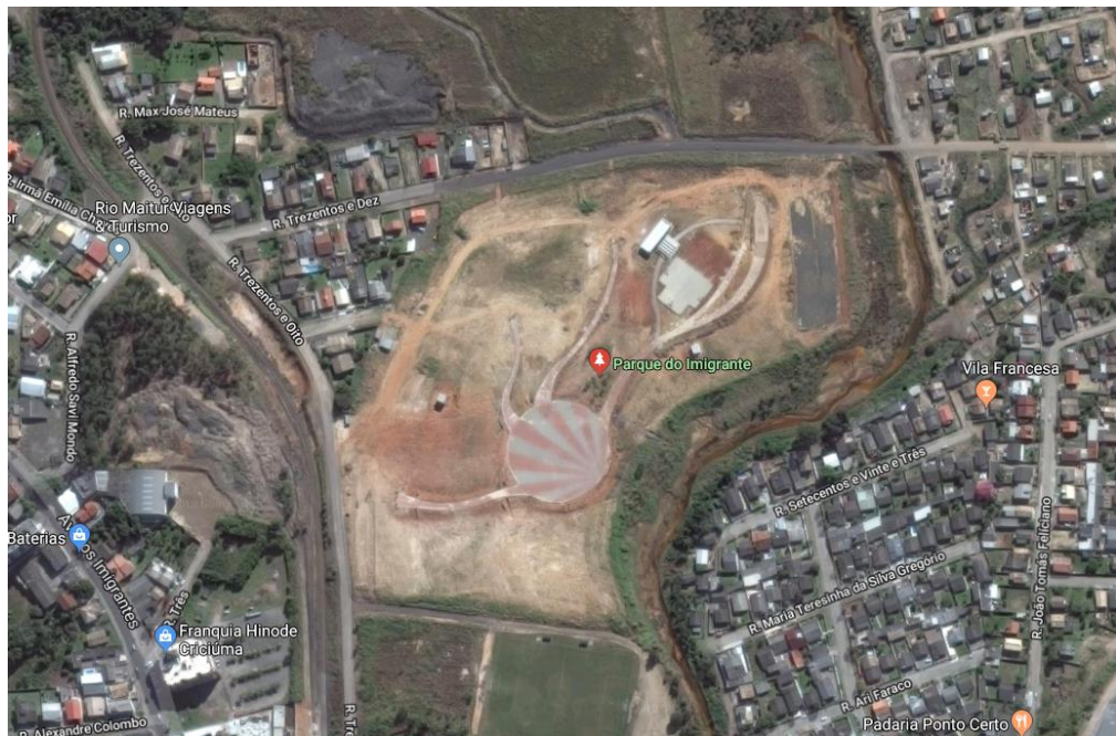
Figura 1: Localização do Parque dos Imigrantes.

A obra acompanhada está sendo executada no Parque dos Imigrantes, anexa ao Anel de Contorno Viário de Criciúma, bairro Vila Francesa, Distrito de Rio Maina-Criciúma/SC.