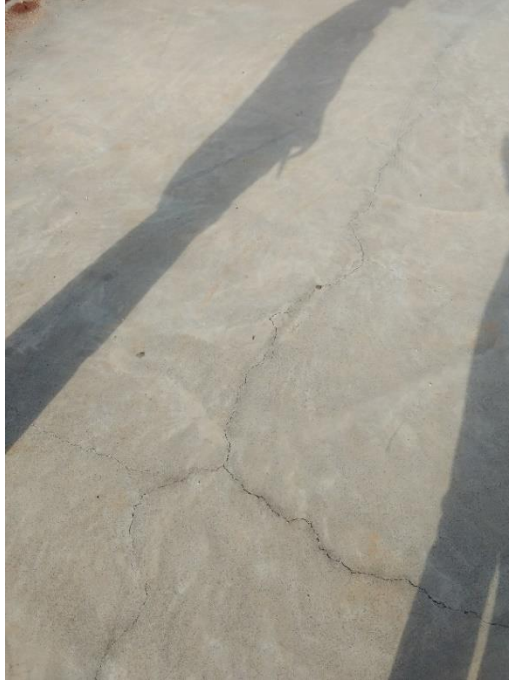
Figura 14: Fissuras na quadra poliesportiva.

Como ressaltado em outros relatórios e visto a mesma realidade nessa visita, lembramos novamente da presença de muitas fissuras na quadra poliesportiva.