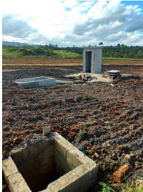
Figura 12: Sistema de drenagem do parque.

A equipe analisou os serviços relacionados ao cercamento do parque, onde terá uma viga por todo o perímetro do entorno, sendo que foi deixado o espaço para inserção do tubo em ferro galvanizado para posteriormente ser chumbado, além da instalação da tela no espaçamento entre cada tubo.