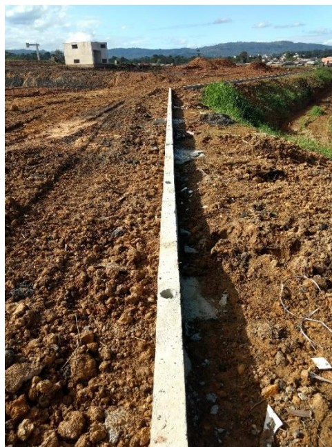
Figura 13: Viga para posterior cercamento do parque.

A equipe analisou os serviços relacionados ao cercamento do parque, onde terá uma viga por todo o perímetro do entorno, sendo que foi deixado o espaço para inserção do tubo em ferro galvanizado para posteriormente ser chumbado, além da instalação da tela no espaçamento entre cada tubo.