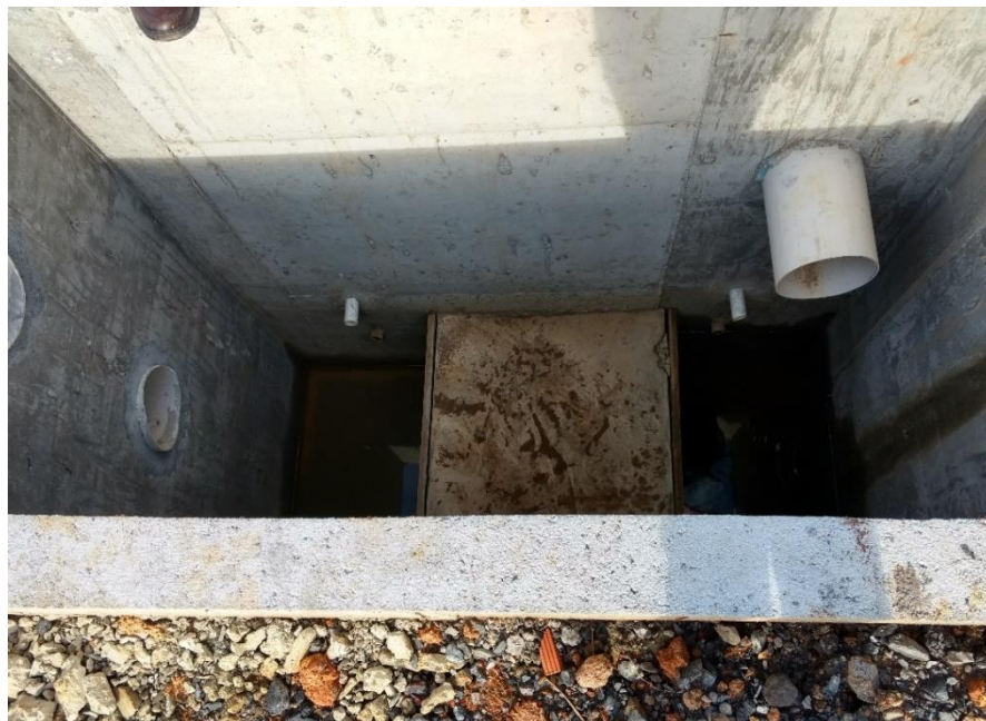
Figura 10: Parte do sistema de drenagem.

Outro ponto levantado pela equipe foi em relação aos canais de drenagem, onde foi observado que pelo parque haviam muitas caixas de bocas de lobo, espalhadas em diversos locais, além do sistema de reaproveitamento de água adotado.