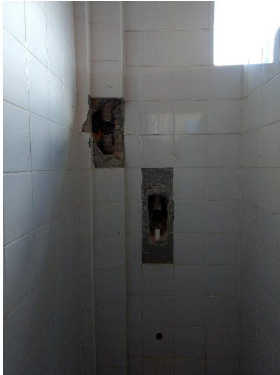
Figura 8: Início dos reparos no banheiro.