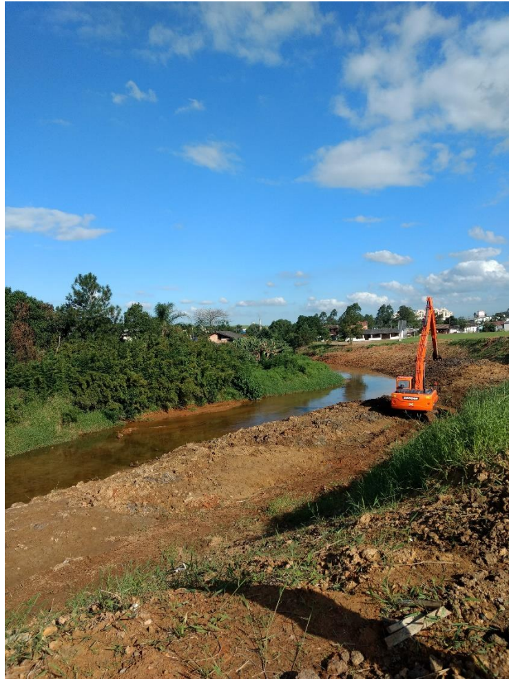
Figura 6: Preparação do meandro do rio.

Foi possível notar que os caminhos secundários, feitos com pavers na cor cinza, estavam em etapa de finalização, porém, no momento da visita não havia nenhum funcionário realizando esta instalação.