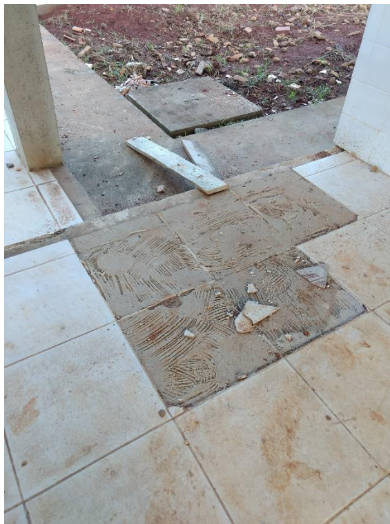
Figura 9: Início dos reparos nos pisos quebrados.