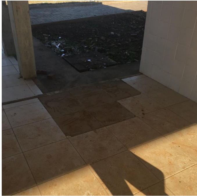
Figura 9: Pisos quebrados.