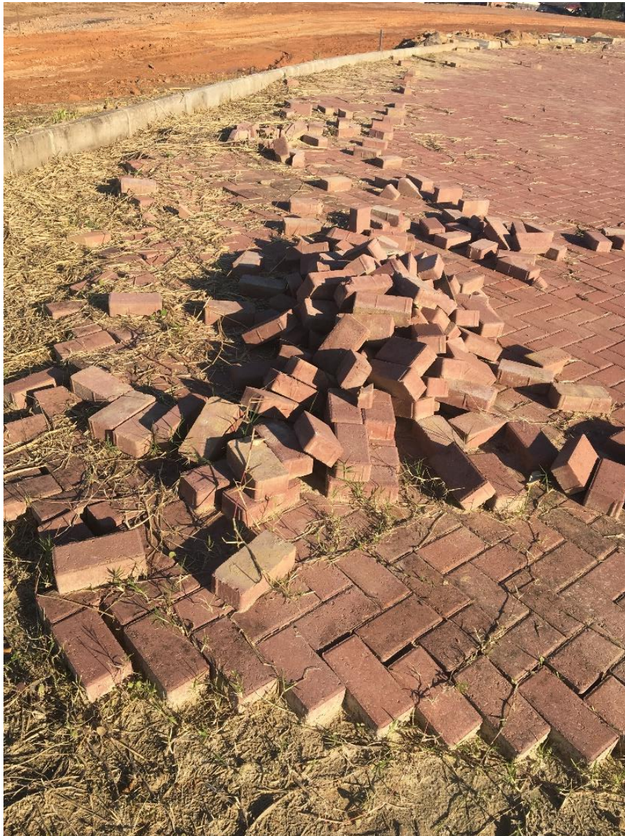
Figura 7: Caminho principal do parque.

Também foi verificado que o problema relacionado ao crescimento de vegetação entre os pavers não foi solucionado. Observou-se ainda o surgimento de desníveis nesta região, fato que deve ser cuidado com atenção para que se resolva o quanto antes possível, evitando que os mesmos aumentem e gerem maiores prejuízos ao município.