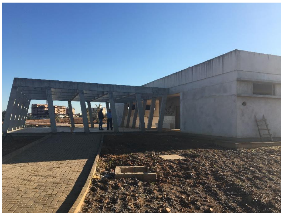
Figura 4: Área de Lazer e banheiros. (Fonte: Dos Autores 2018)

A visita durou cerca de 1 (uma) hora, durante a visita a equipe pode observar que a obra apresentou evolução em relação à última realizada. Foi iniciado a construção de uma tafona e em sequência será iniciada a instalação de uma pista de caminhada, dentre outros serviços observados ao decorrer da visita.