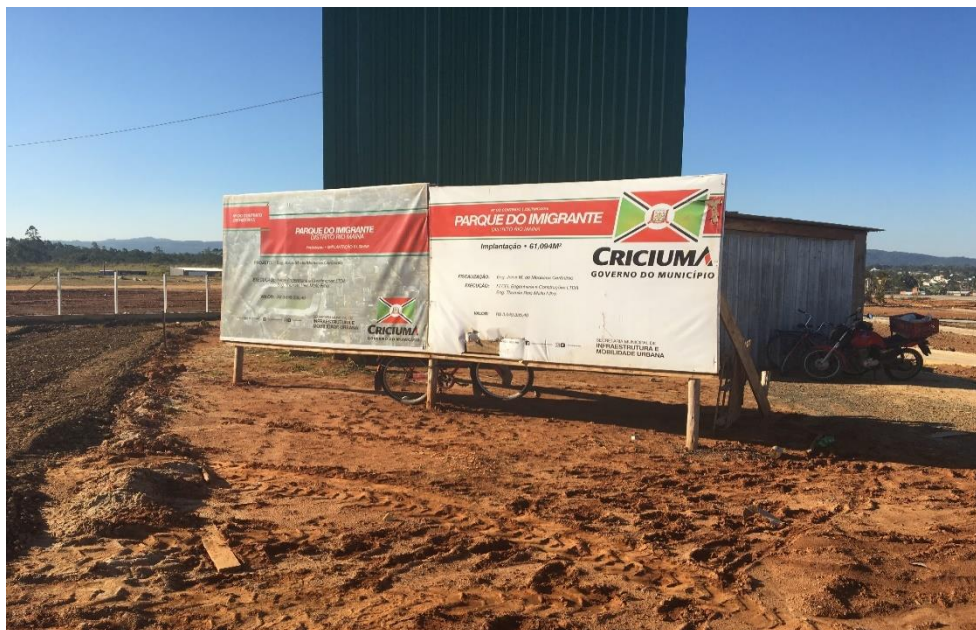
Figura 5: Placa de identificação da obra.

A equipe do Observatório pode notar que foi iniciada a instalação dos tubos galvanizados engastados na viga baldrame e futuramente será feito a instalação da tela no espaçamento entre cada tubo.