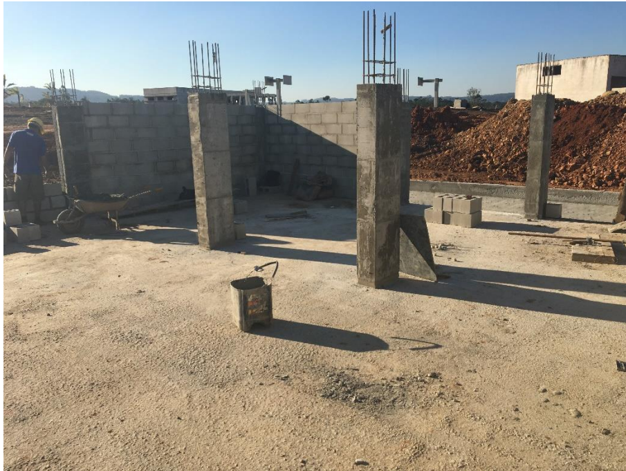
Figura 13: Laje da tafona finalizada.