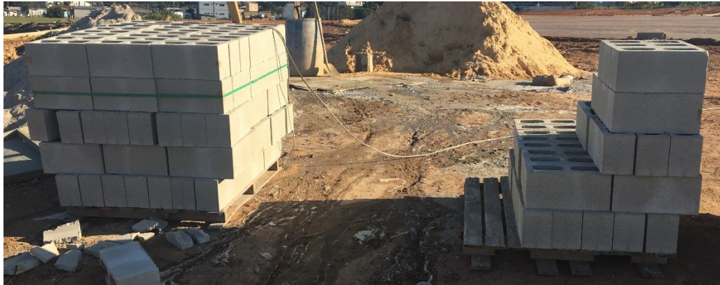
Figura 11: Armazenamentos dos blocos de concreto.

Durante a visita foi possível ver a construção de uma tafona, onde já estava finalizada a laje e estavam sendo executados os pilares em concreto armado e as paredes feitas com blocos de concreto. Também foi observado que os blocos de concreto estavam sendo armazenados corretamente sobre paletes.