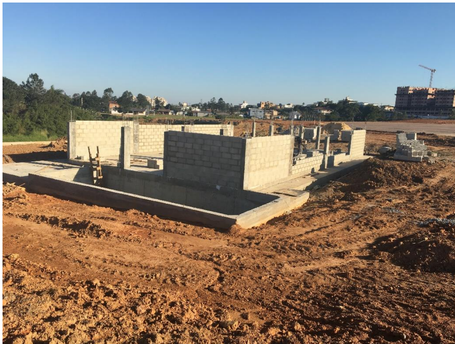
Figura 12: Tafona.