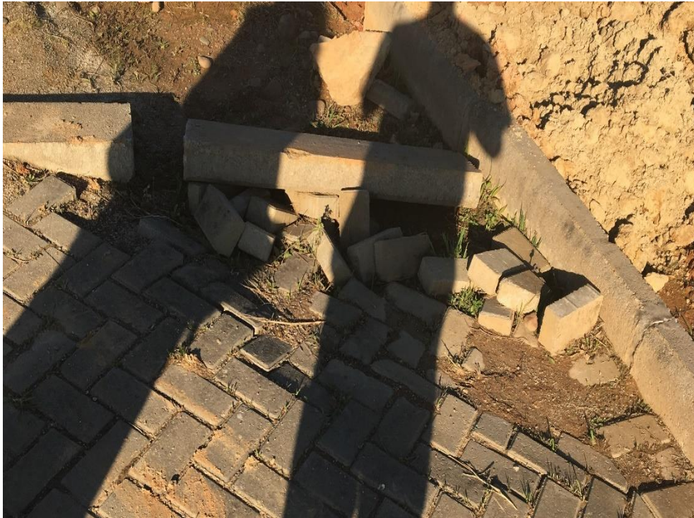
Figura 8: Caminho secundário.

A equipe do Observatório observou a situação da área de estar e banheiros, onde se encontram os bebedores, haviam pisos quebrados. Ao entrar no banheiro, dentro de cada box, notou-se que os registros de todos os banheiros foram furtados, porém a empresa responsável pela obra já iniciou os reparos, além de em muitos locais da obra serem encontrados pichações. Observou-se que não há vigilância no local.