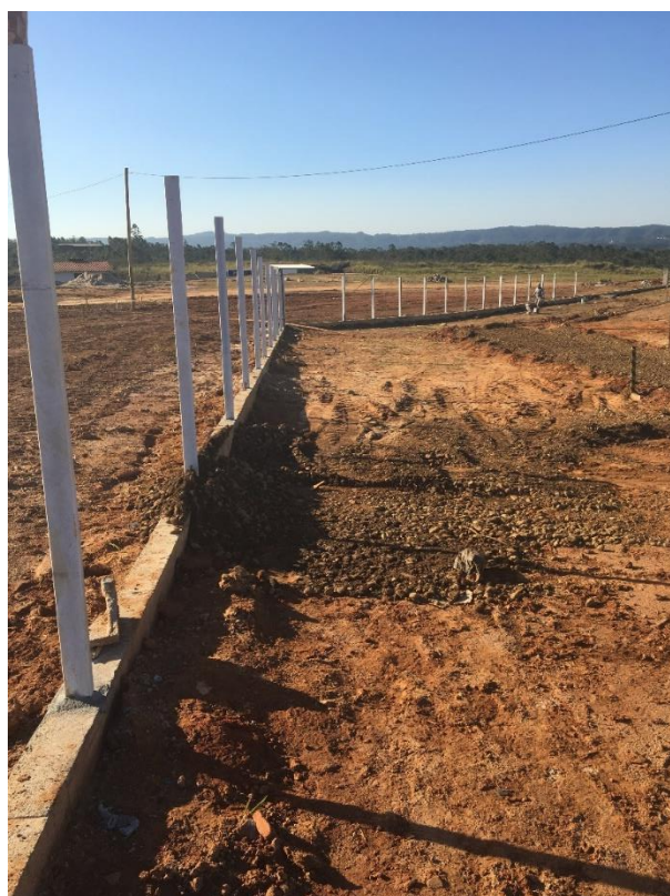
Figura 6: Instalação dos tubos galvanizados.

A equipe do Observatório pode notar que foi iniciada a instalação dos tubos galvanizados engastados na viga baldrame e futuramente será feito a instalação da tela no espaçamento entre cada tubo.