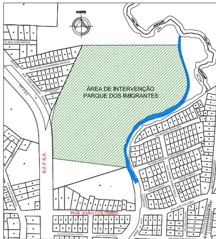
Figura 3: Planta de situação.