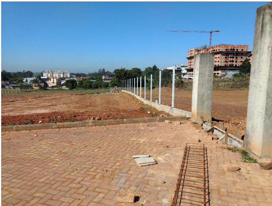
Figura 6: Tela em etapa de execução.

Outro avanço na obra do parque foi o paisagismo, onde é possível notar que foram plantados árvores e gramas. Observou-se também que a quadra de esportes de vôlei foi aterrada com areia conforme consta no projeto.