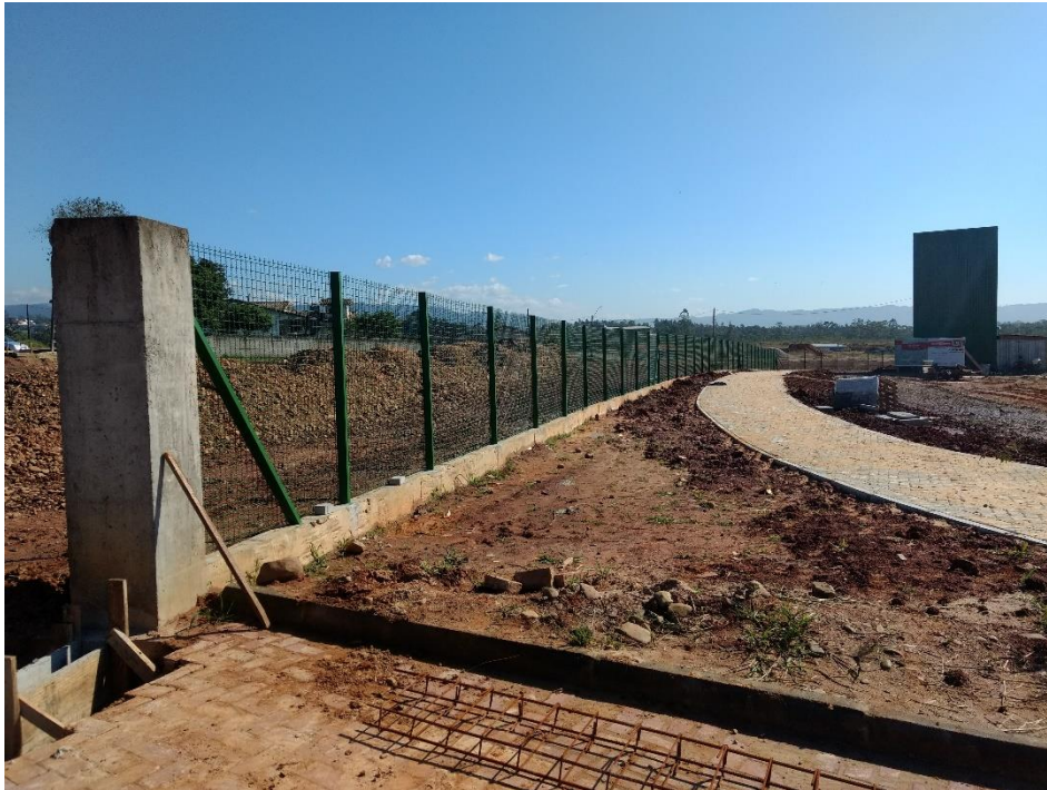
Figura 5: Instalação da tela.