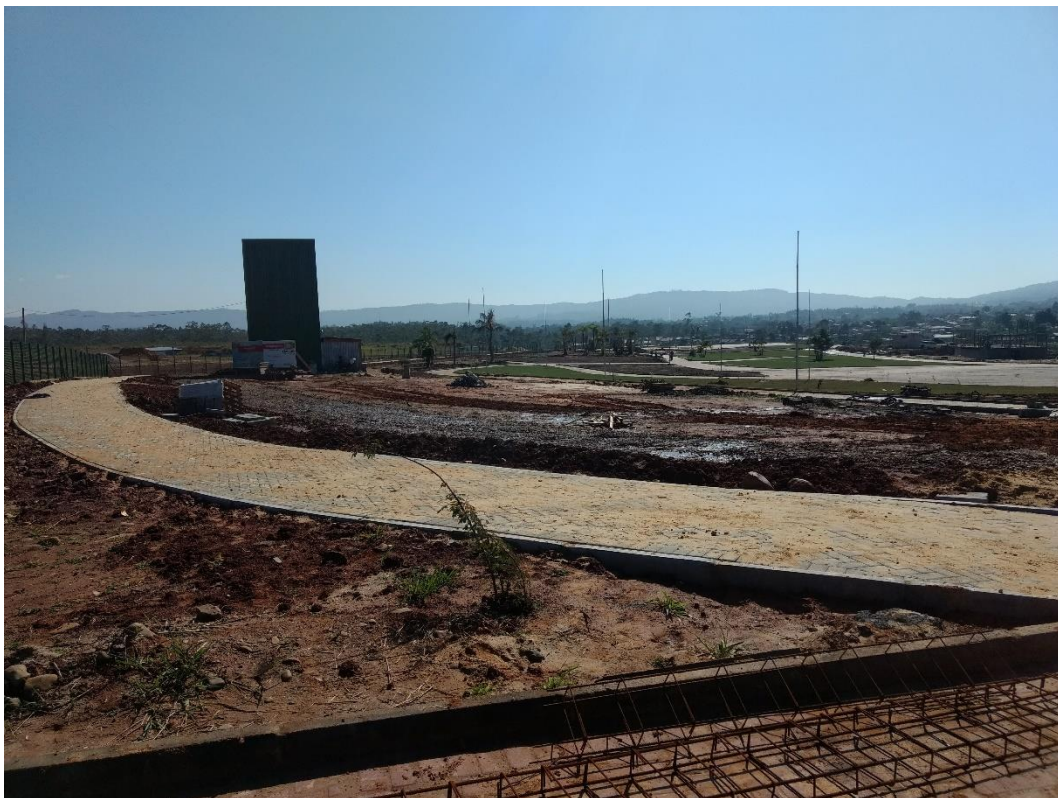
Figura 4: Vista parcial do parque.

A visita durou cerca de trinta minutos, durante a visita a equipe pode observar que a obra apresentou evolução em relação à última realizada. Houve um grande avanço nos serviços de paisagismo e as cercas estavam em fase de finalização.