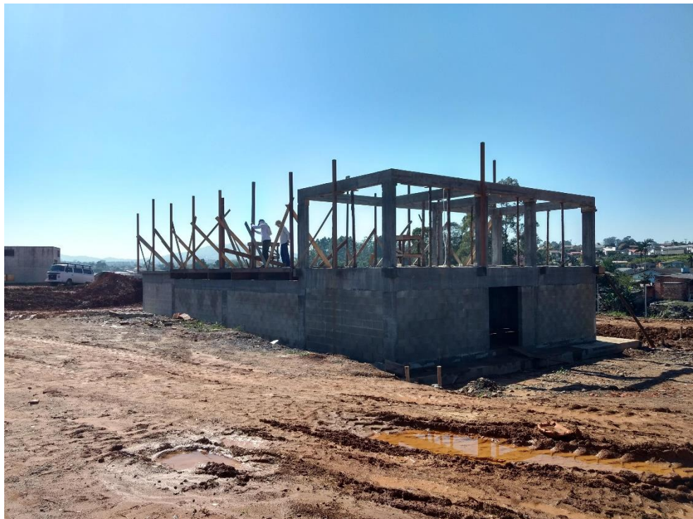
Figura 10: Tafona.