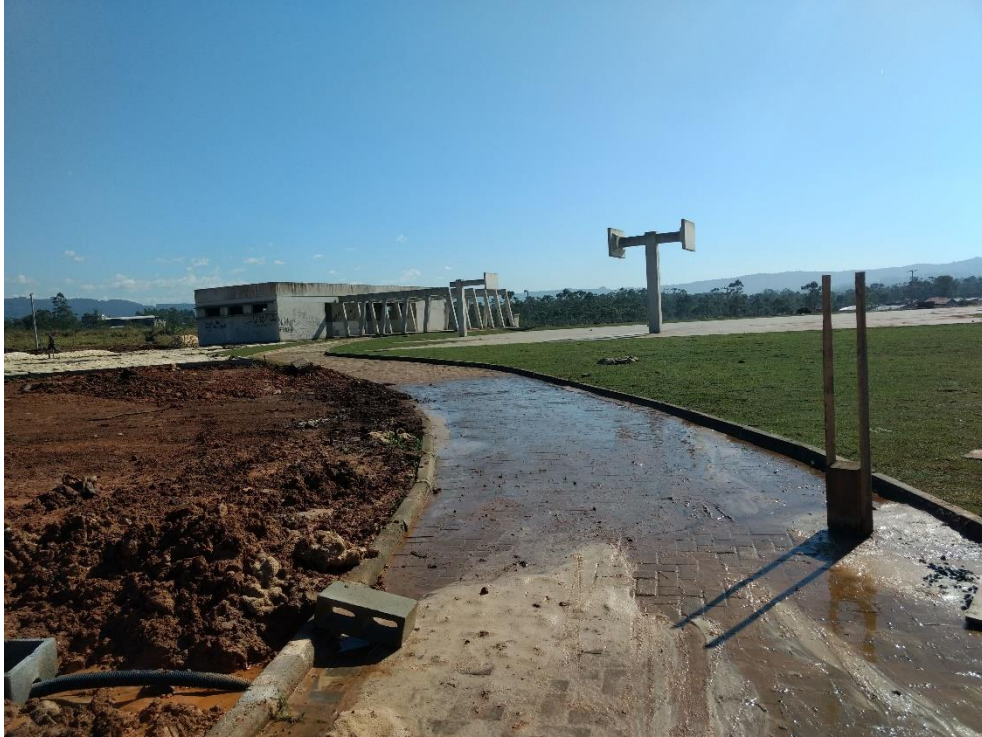
Figura 11: Vazamento.

Chamou atenção da equipe durante a visita, um possível vazamento de água em uma tubulação que se localiza abaixo dos pavers de cor cinza.