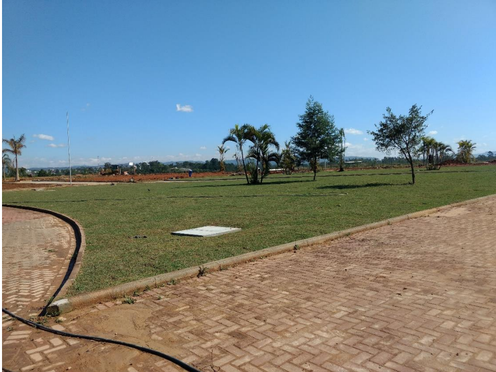
Figura 7: Plantio de grama e arvores.