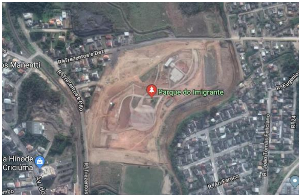
Figura 1: Localização do Parque dos Imigrantes.

A obra acompanhada está sendo executada no Parque dos Imigrantes, próximo ao Anel de Contorno Viário de Criciúma, bairro Vila Francesa, Distrito do Rio Maina em Criciúma/SC.