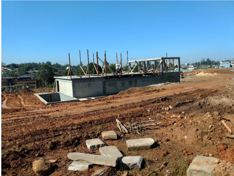
Figura 9: Tafona.

A tafona está com um bom ritmo de andamento, todo o primeiro andar apresenta-se em etapa de conclusão e está sendo realizado a execução do segundo pavimento.