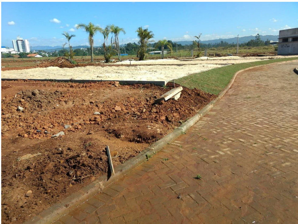
Figura 8: Quadra de vôlei de areia.