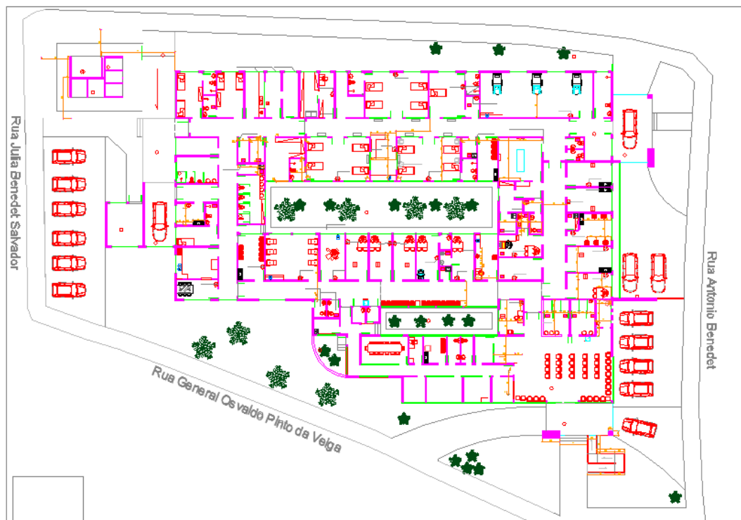
Figura 3: Planta Baixa UPA II