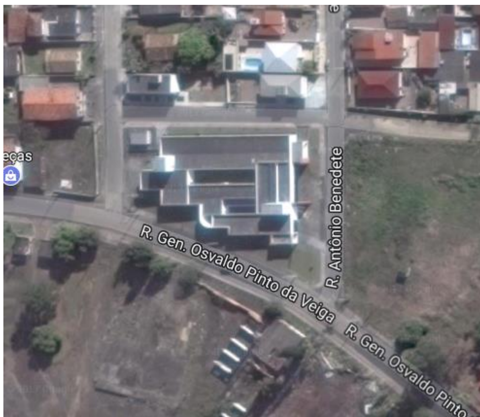
Figura 1: Localização da UPA II

Localizada na rua General Osvaldo Pinto da Veiga, bairro Próspera no Município de Criciúma/SC.