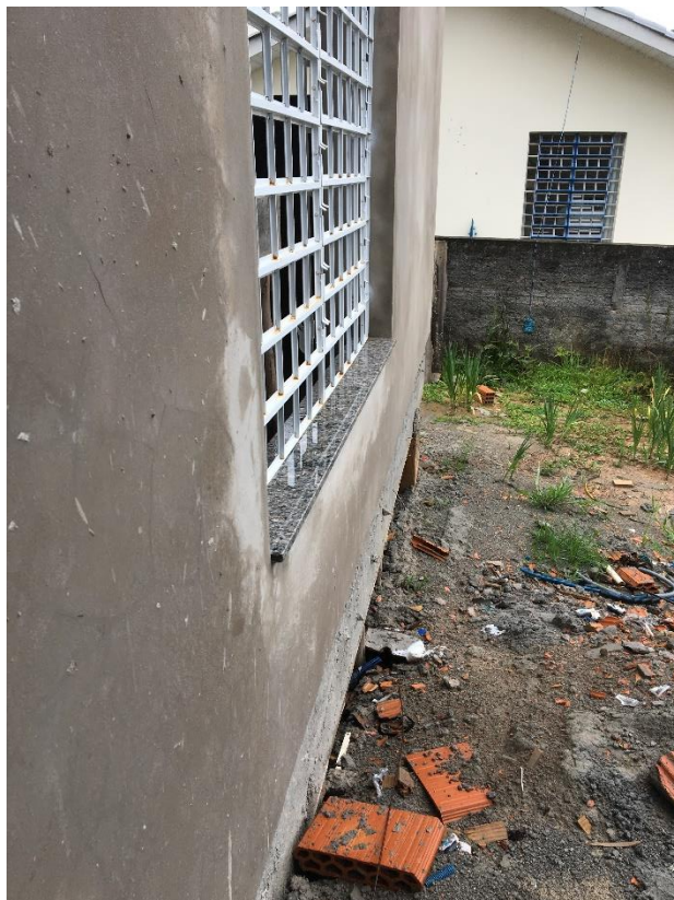
Figura 8: Chapas de granito.