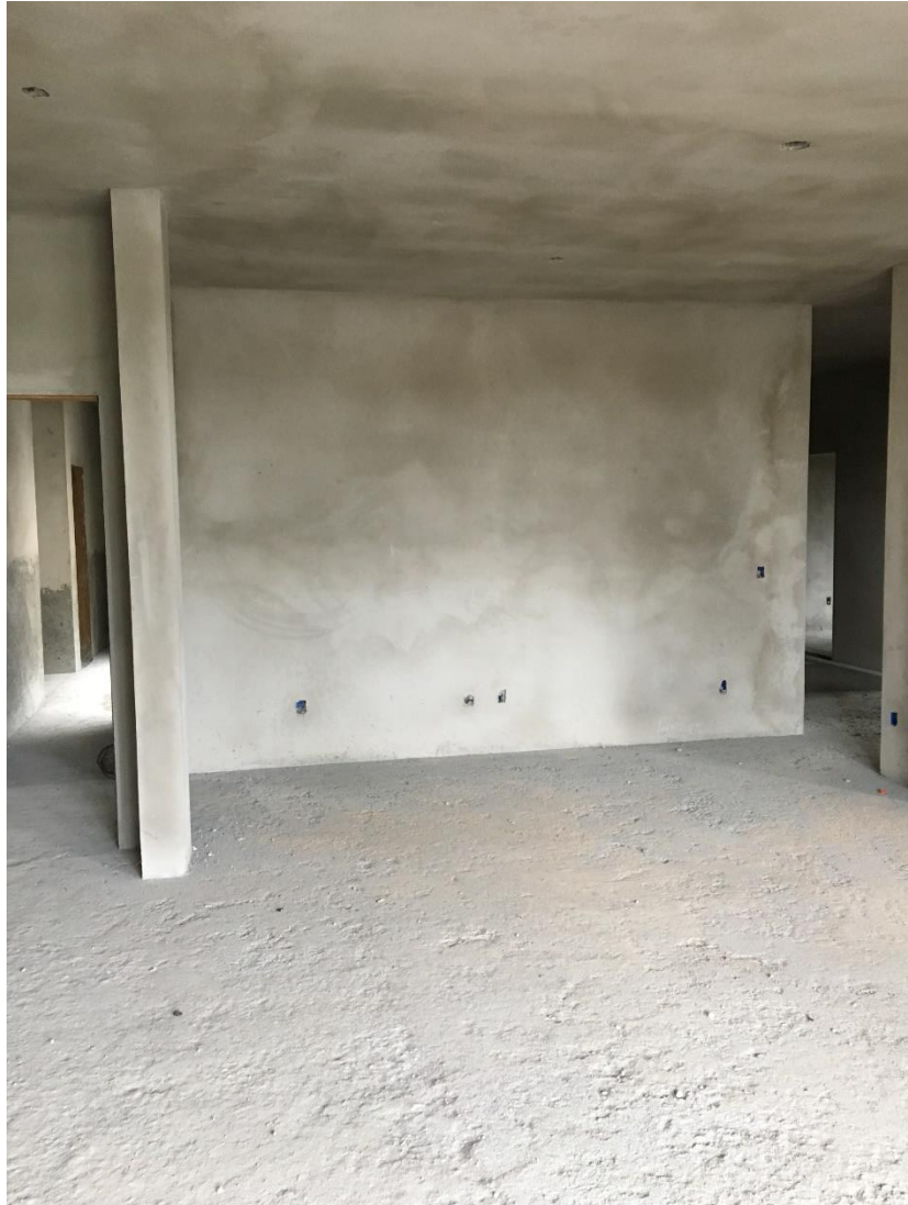
Figura 9: Área interna da unidade.

Na região interna dos ambientes verificou-se que os serviços de reboco estão finalizados, sendo possível realizar iniciar a execução do revestimento cerâmico e da pintura.