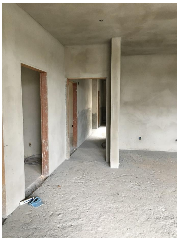
Figura 11: Área interna da unidade.