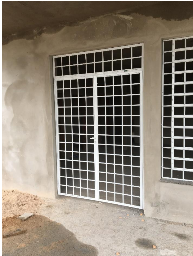
Figura 5: Entrada da unidade.