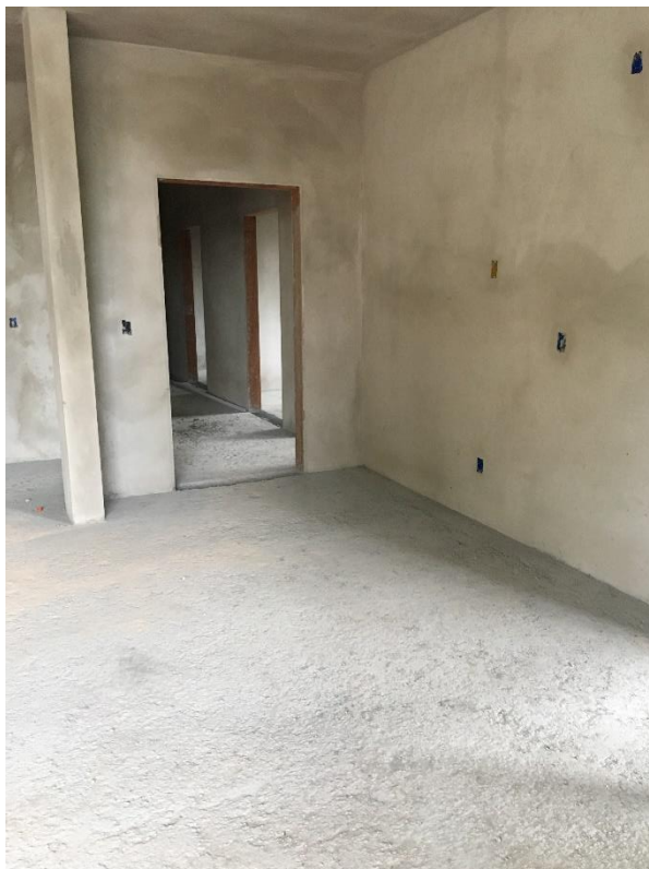
Figura 10: Área interna da unidade.