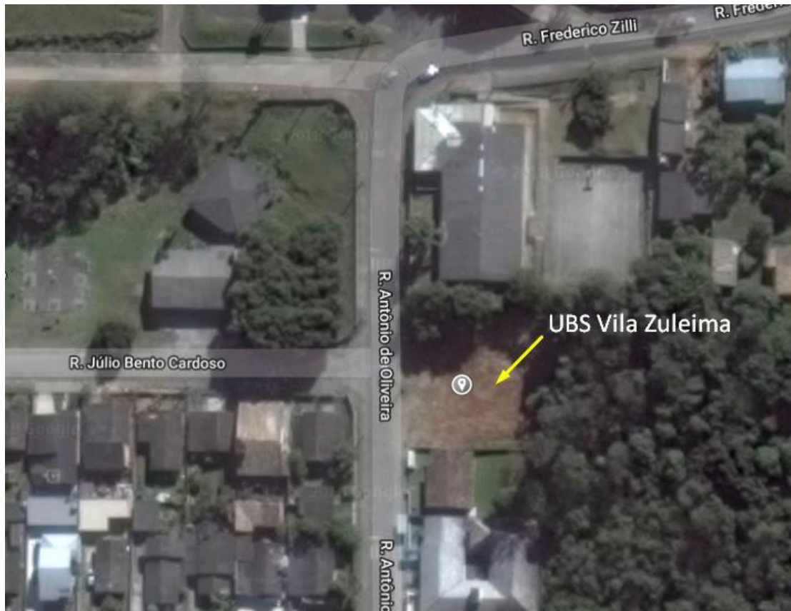
Figura 1: Localização da obra.

A obra acompanhada está localizada na Rua Antonio de Oliveira, bairro Vila Zuleima no Município de Criciúma/SC.