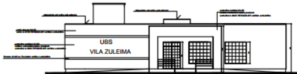
Figura 3: Fachada frontal.