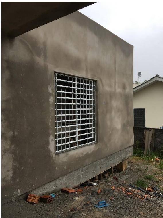
Figura 6: Fachada frontal.