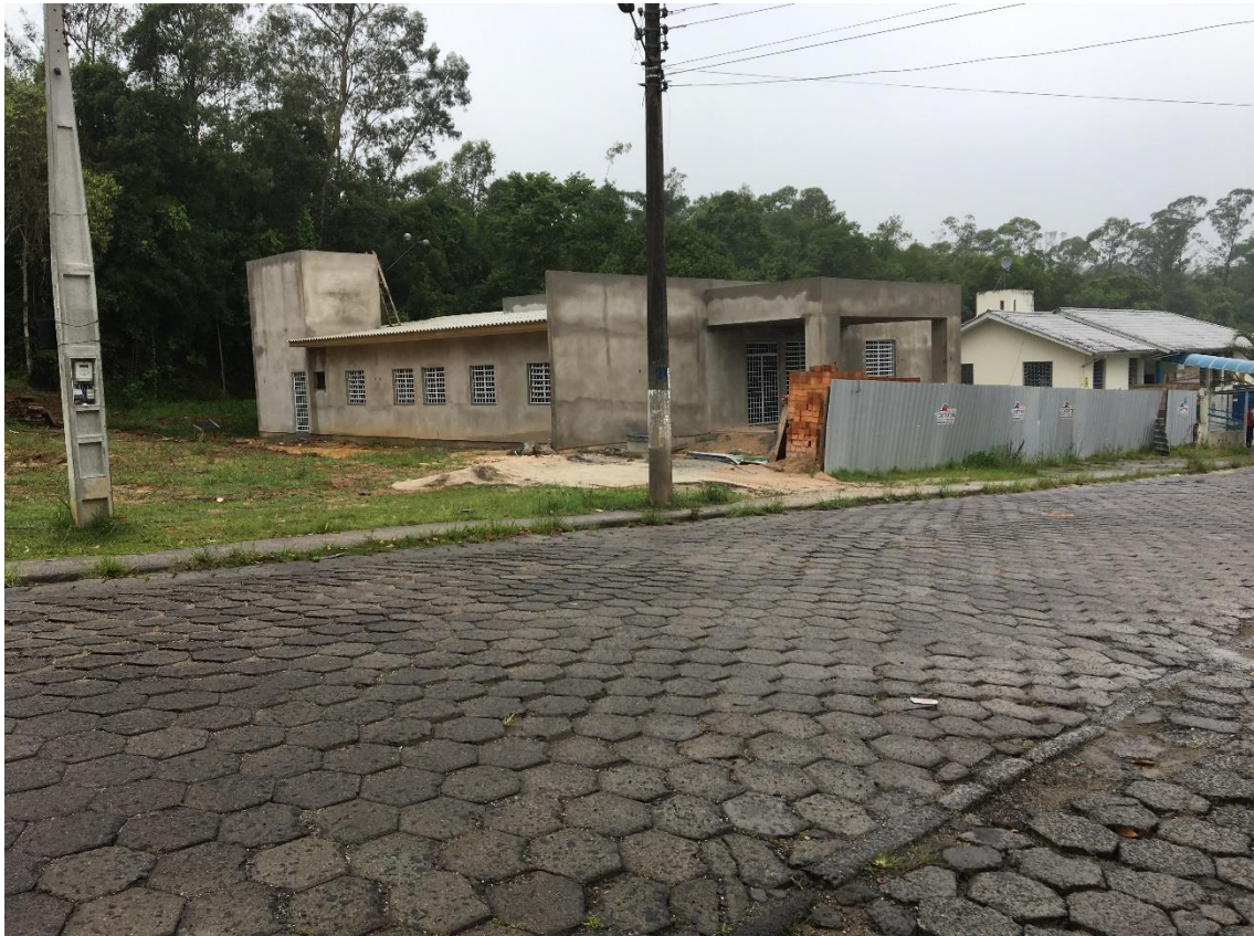
Figura 4: Vista frontal da unidade.

No dia 18 de dezembro do ano de 2018, foi realizada a quarta visita à obra de construção da Unidade Básica de Saúde do bairro Vila Zuleima, com a finalidade de verificar o andamento da obra e a qualidade dos trabalhos ali executados. A visita durou cerca de meia hora.