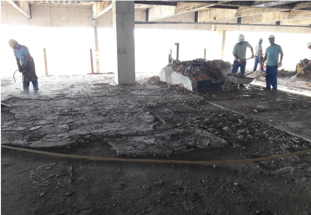
Figura 11: Área de remoção dos pisos e paredes do banheiro.