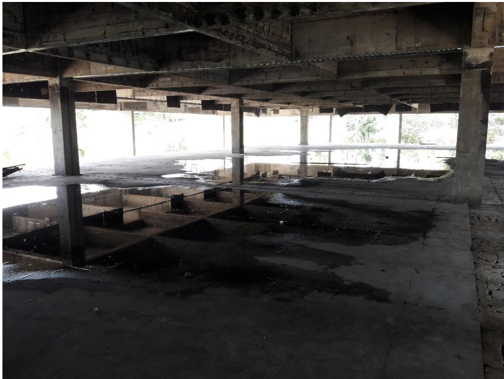
Figura 18: Água parada no andar superior.

Foi informado pela equipe de trabalho que os trabalhos que estão realizando têm um prazo de aproximadamente mais 20 dias para serem finalizados, ficando com previsão para término na semana do dia 20/02/17, terminando então toda remoção dos pisos e paredes que devem ser retiradas e então começar a recolocar os granitos e terminar de levantar as paredes dos sanitários e da escadaria. Na área menos atingida pelo incêndio já é possível começar os trabalhos, então segundo informações, os trabalhos nessa região já serão iniciados na semana do dia 06/02/17.