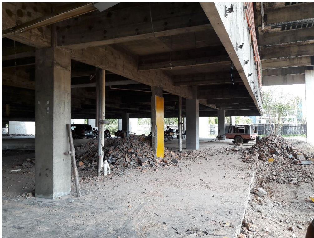
Figura 07: Entulho a ser retirado.