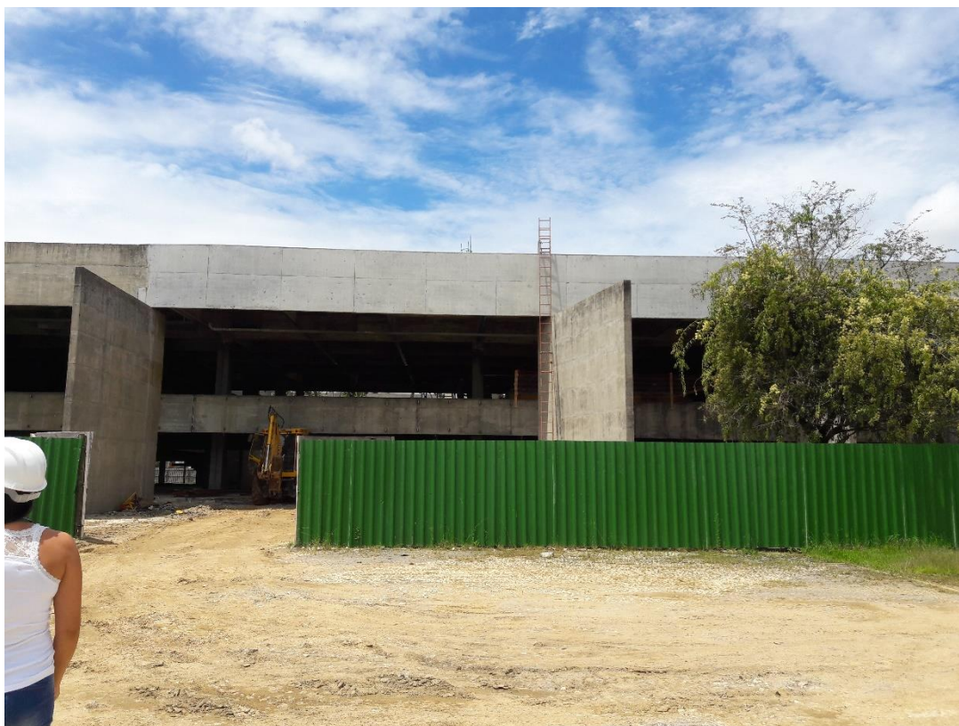
Figura 04: Vista dos fundos do Paço Municipal Marcos Rovaris.