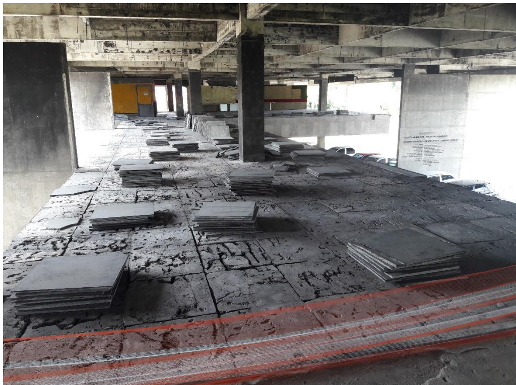
Figura 16: Armazenagem dos granitos que serão reutilizados.