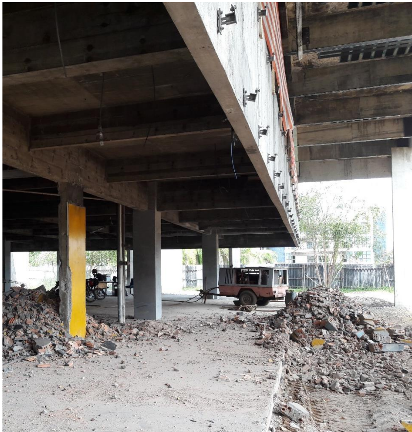
Figura 10: Todos os perfis de alumínio removidos.

Na parte superior estão realizando levantamento de alvenaria, sendo está na área em que se encontrará o banheiro e a escadaria de um dos lados do prédio, na outra parte onde foi mais afetada pelo incêndio, estão terminando a remoção das paredes que serão reconstruídas e a remoção do piso e da massa que sobraram para então recolocar o granito. Todos os pisos de granito que serão utilizados estão armazenados em pequenos montes espalhados em uma área do andar, isso mostra que a equipe de trabalho está muito bem organizada, cuidando dos materiais que irão usar e mantendo o local seguro, pois além de organizado, também é possível notarmos que a área é toda protegida com guarda corpo e telas de proteção.