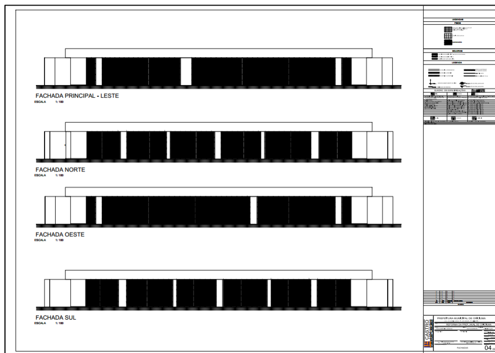
Figura 03: Fachadas do prédio.