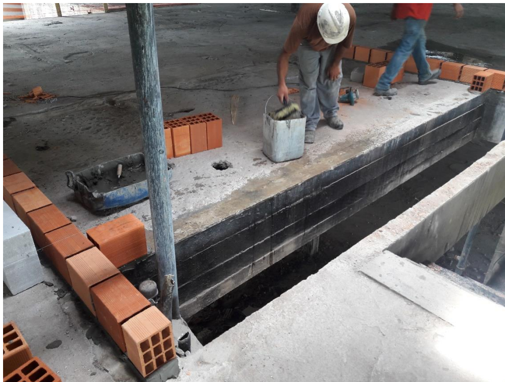
Figura 14: Levantamento da alvenaria do sanitário e escadaria.