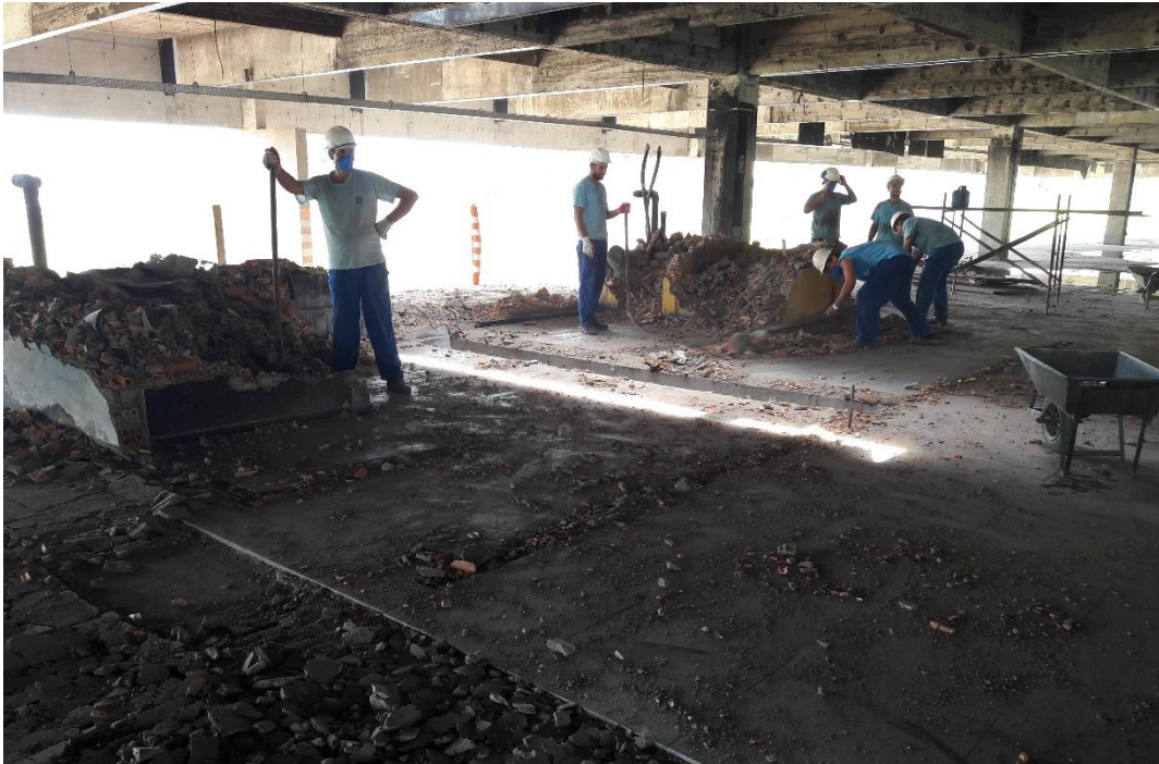
Figura 13: Área dos sanitários que será reconstruída.