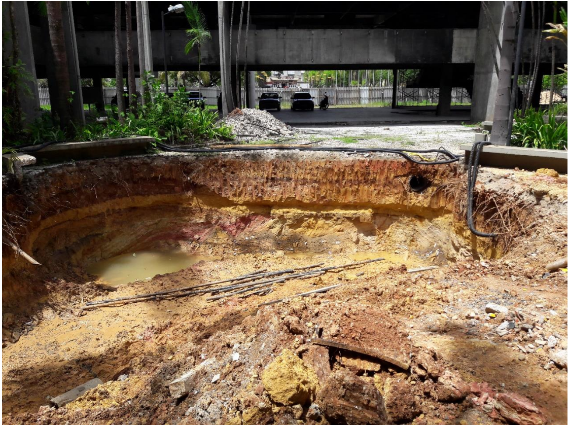
Figura 09: Escavação para construção do reservatório de água pluvial