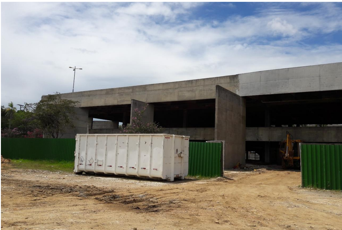
Figura 05: Local para depósito de entulho.

No local havia uma máquina cuidando da remoção dos entulhos e fazendo seu depósito em uma caçamba situada nos fundos do Paço Municipal.