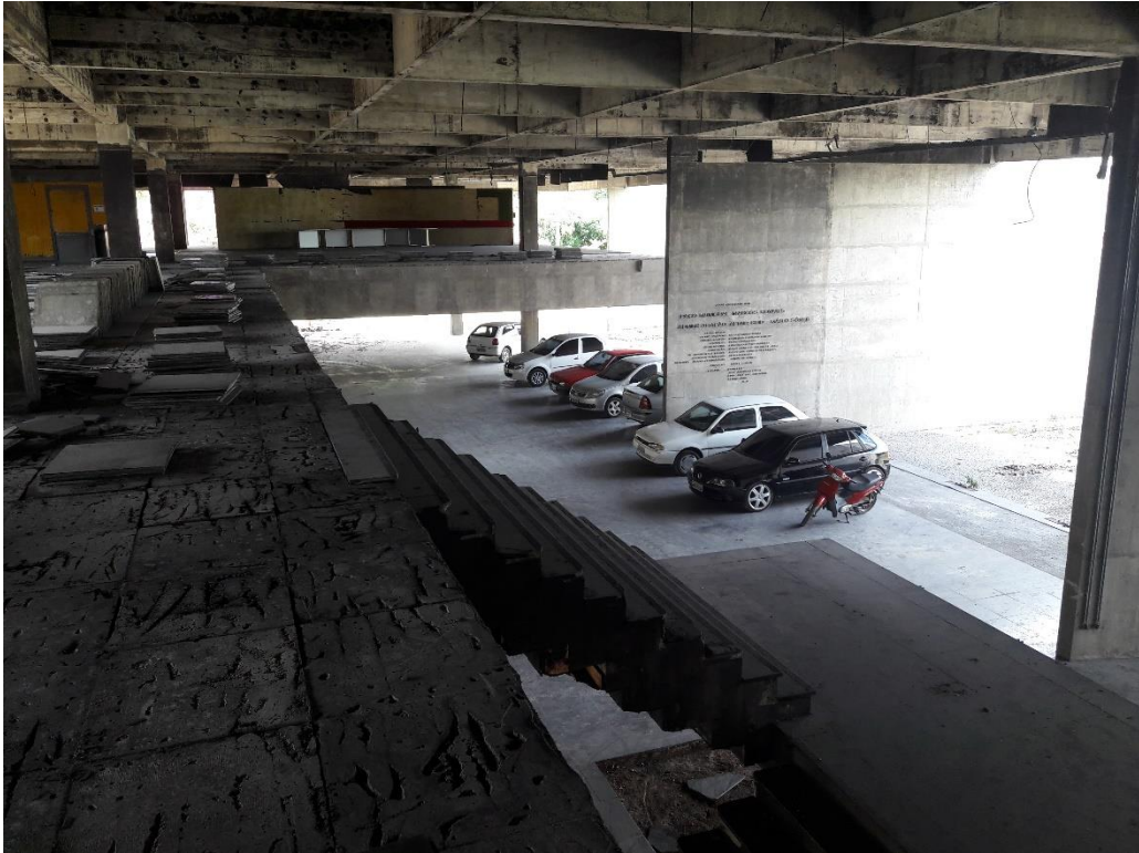
Figura 17: Área da frente do Paço Municipal.

O único ponto negativo encontrado na obra foi o acúmulo de água no andar superior, onde encontramos uma grande quantidade de água parada espalhada pelo andar, sendo que a situação se encontra assim desde o ano passado. No momento que nos encontramos, onde a proliferação dos mosquitos transmissores de doenças graves está grande, devemos cuidar ainda mais com água parada. Sabendo disso, seria interessante que fosse enviado um pedido para que essa água fosse removida para evitarmos casos dessas doenças.