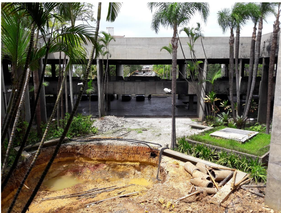
Figura 08: Escavação para construção do reservatório de água pluvial.

No térreo foi evidenciado que além dos serviços de limpeza e organização da obra, também estavam realizando outros serviços. Na área central da prefeitura estavam terminando a escavação do terreno para realizarem a construção e adaptação dos reservatórios de água pluvial. A equipe também constatou que todos os perfis de alumínio já haviam sido retirados, evitando que assim ocorra novamente um furto dos materiais. Um ponto importante citado no novo contrato, é que toda parte de segurança da obra agora será de responsabilidade da empresa executora, sendo de cuidados da mesma, a contratação de guarda armada para cuidar do local e também de responsabilidade dela caso ocorra algum outro furto de material.