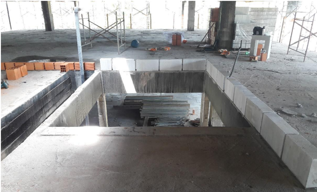
Figura 15: Escadaria que será fechada com bloco celular.