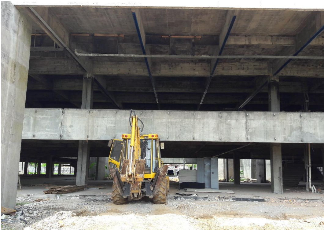
Figura 06: Retroescavadeira realizando limpeza da obra.