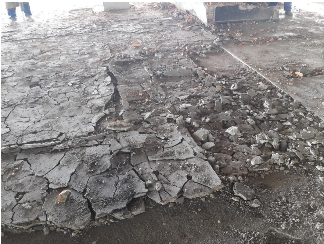
Figura 12: Piso a ser removido.