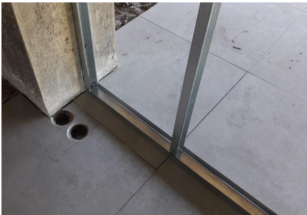
Figura 18: Detalhe instalação do perfil.