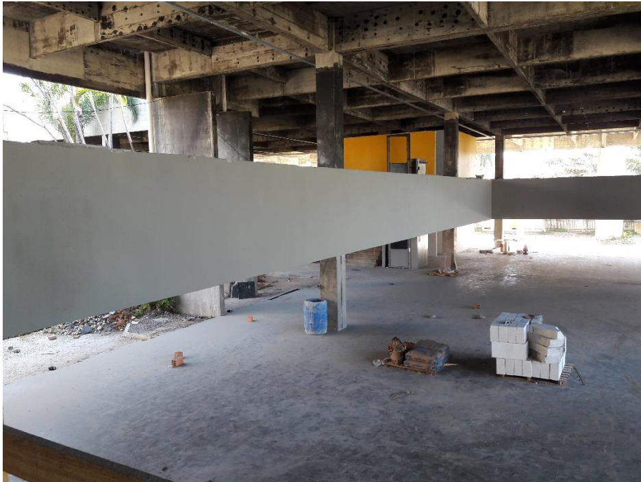
Figura 21: Face lateral da laje com pintura concluída. (Fonte: Dos autores 2017)

Durante a visita, foi reparada a presença de uma equipe cuidando do reboco na face lateral da laje e também outra realizando a pintura das regiões onde estes serviços já haviam sido concluídos. Grande parte já estava com pelo menos a primeira mão da pintura realizada.