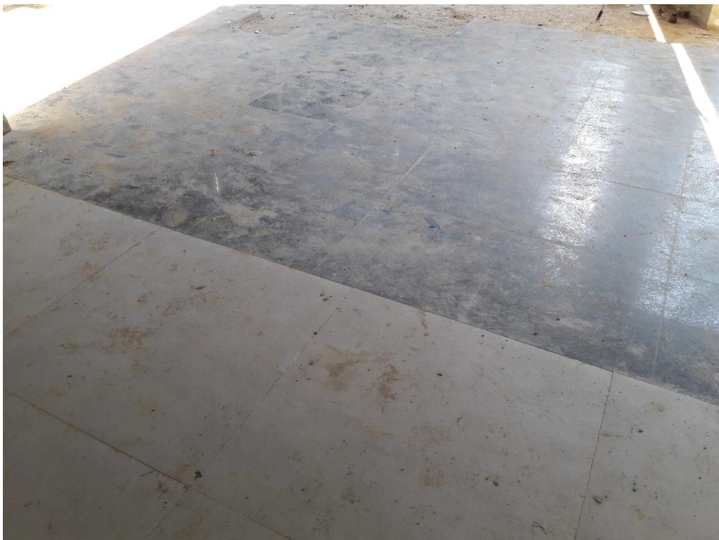
Figura 07: Encontro da cerâmica com o granito.