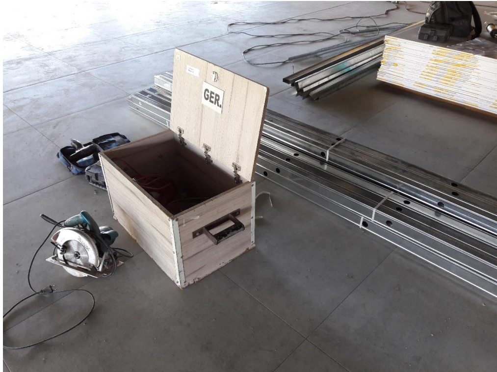
Figura 19: Materiais e ferramentas de trabalho.