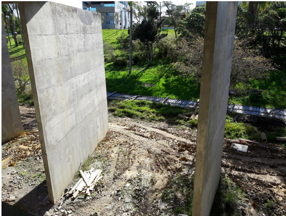
Figura 16: Tubulações já tapadas.