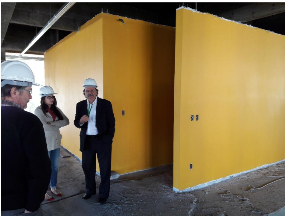
Figura 12: Parede área externa ao sanitário.