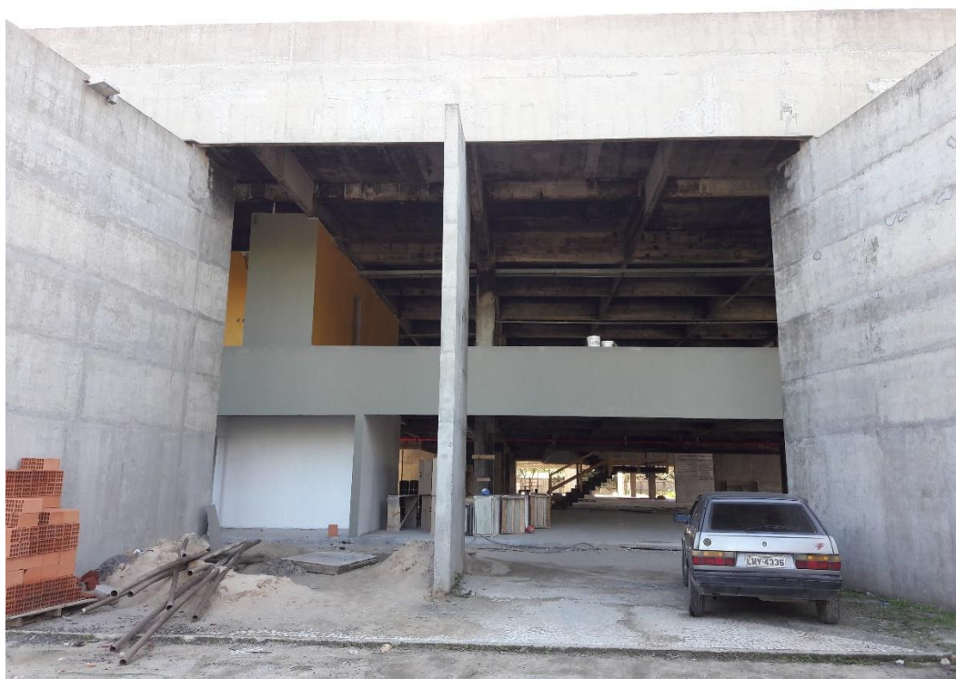
Figura 04: Entrada lateral do Paço Municipal Marcos Rovaris.