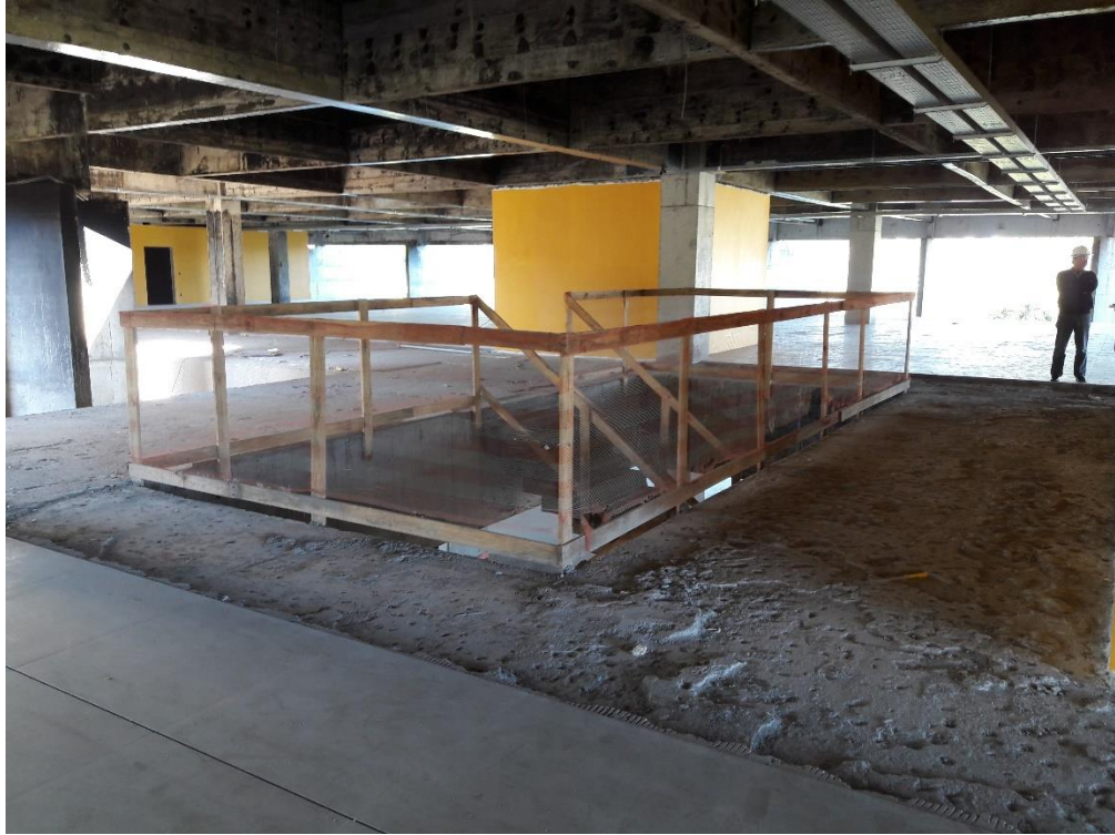
Figura 23: Guarda corpo com tela de proteção.