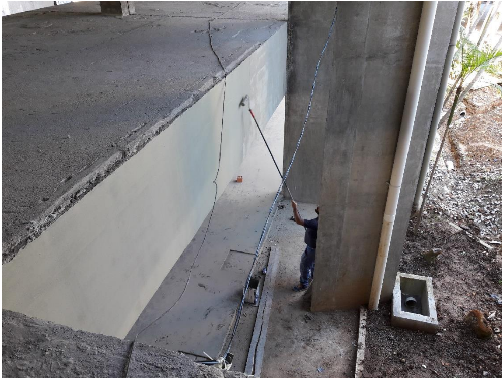
Figura 22: Pintura da face lateral da laje.

Também foi verificado pela equipe que a obra se mantém organizada, limpa e segura desde a primeira visita realizada até o momento. Apresentando placas sinalizadoras, tapume em toda obra, guarda corpo e telas de proteção. Alguns lugares o guarda corpo não está presente devido aos serviços realizados no local que impedem a instalação dos mesmos, porém o ambiente apresenta uma boa qualidade e visibilidade destas áreas de risco.