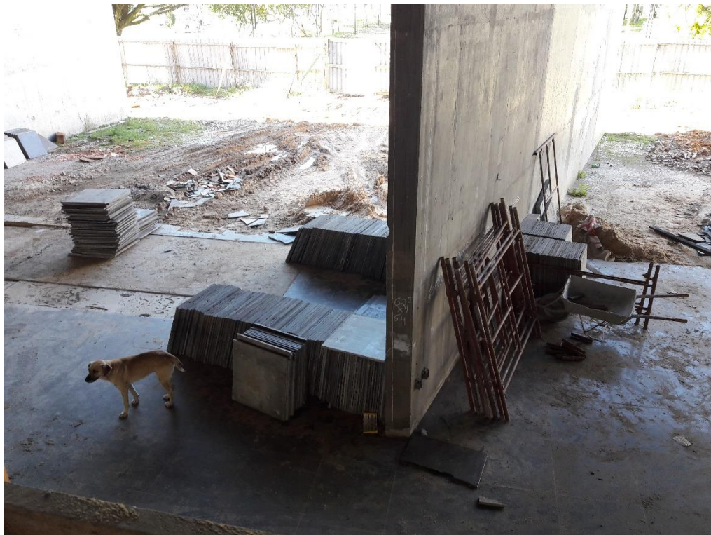
Figura 24: Materiais organizados.