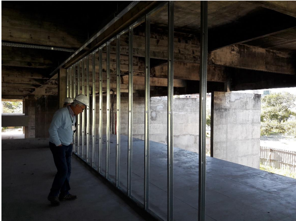
Figura 17: Perfis instalados para divisórias.