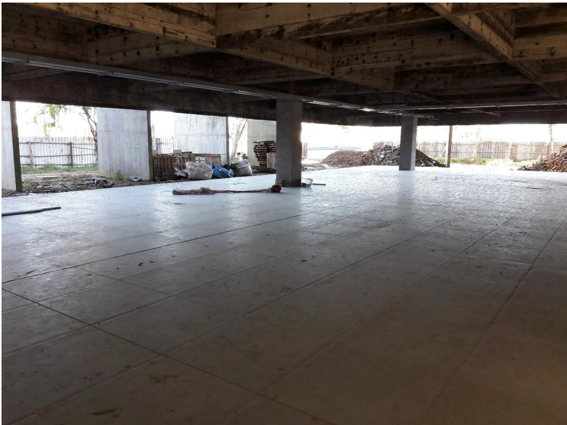
Figura 05: Piso assentado no pavimento inferior.

Ainda relacionados a estes trabalhos finalizados, a equipe notou que em algumas áreas aparentava haver um desnivelamento dos pisos, o qual era visível comparando os cantos de cada peça. Após uma vista mais rigorosa, notou-se que o problema estava no piso (peça), o qual apresentava ondulação em suas laterais, não sendo então um defeito na hora do assentamento.