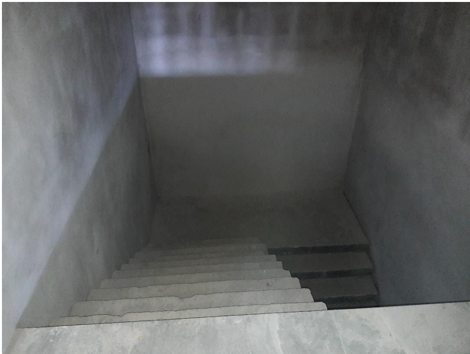
Figura 11: Escadaria apresentando serviços em etapa final.