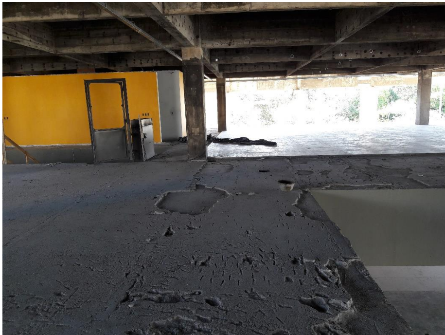
Figura 09: Área que falta aplicar o granito.