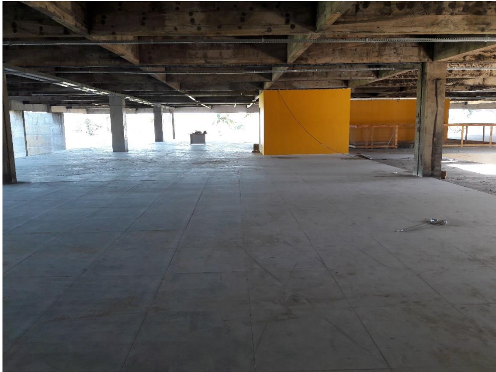
Figura 06: Piso assentado no pavimento superior.