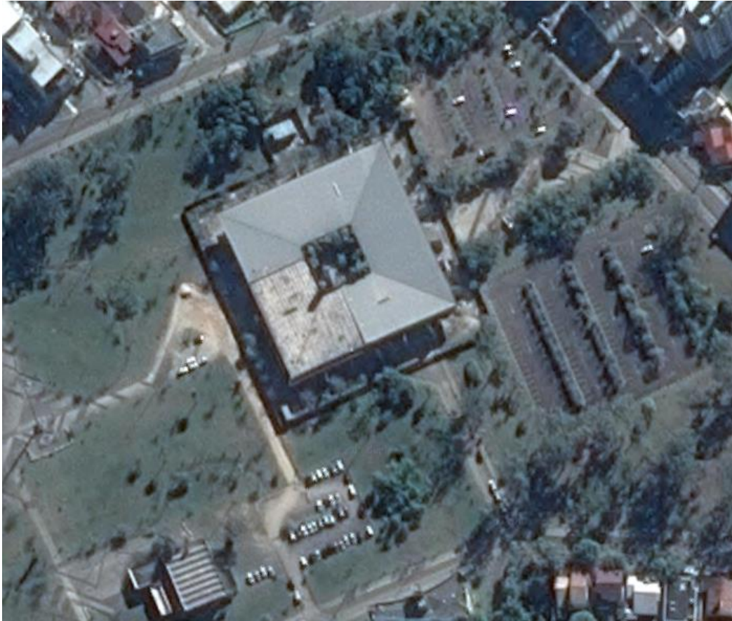
Figura 01: Localização do Paço Municipal Marcos Rovaris.

A obra acompanhada está sendo executada no Paço Municipal Marcos Rovaris, localizado na Rua Domênico Sônego, no bairro Santa Bárbara em Criciúma – SC.