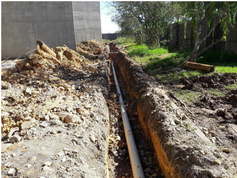
Figura 15: Foto da oitava visita, passagem da tubução.