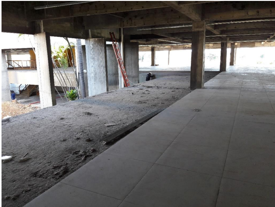
Figura 08: Área que falta aplicar o granito.

No pavimento superior, falta então o assentamento do granito que foi retirado, após feita esta etapa, todo trabalho relacionado à piso no Paço Municipal está finalizado.