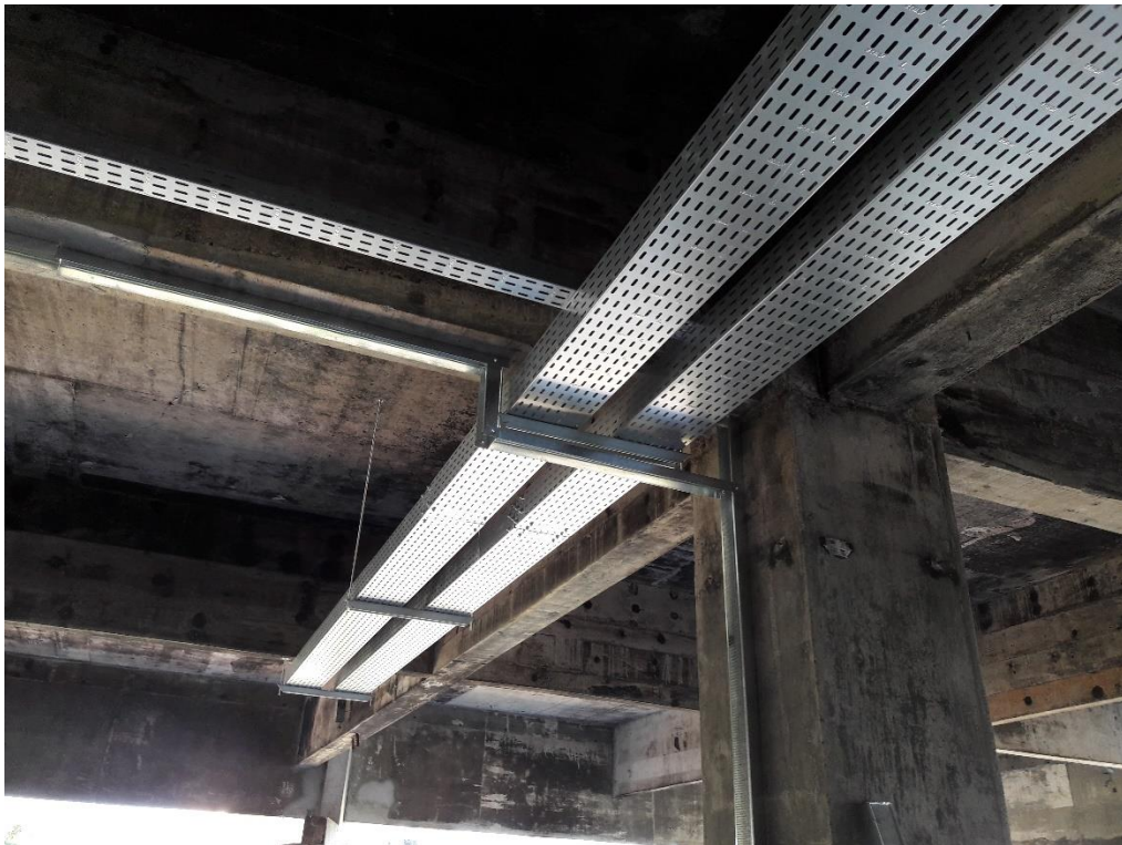
Figura 20: Eletrocalha perfurada do tipo U.