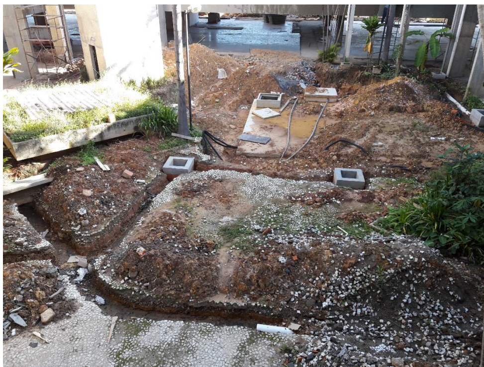
Figura 13: Valetas para passagem de tubulação.

Nesta última visita, foi notado que já haviam feito esta ligação e concluída esta etapa. Porém, no canteiro central ainda foi evidenciado que falta finalizar a passagem de tubulações para a rede de águas pluviais.