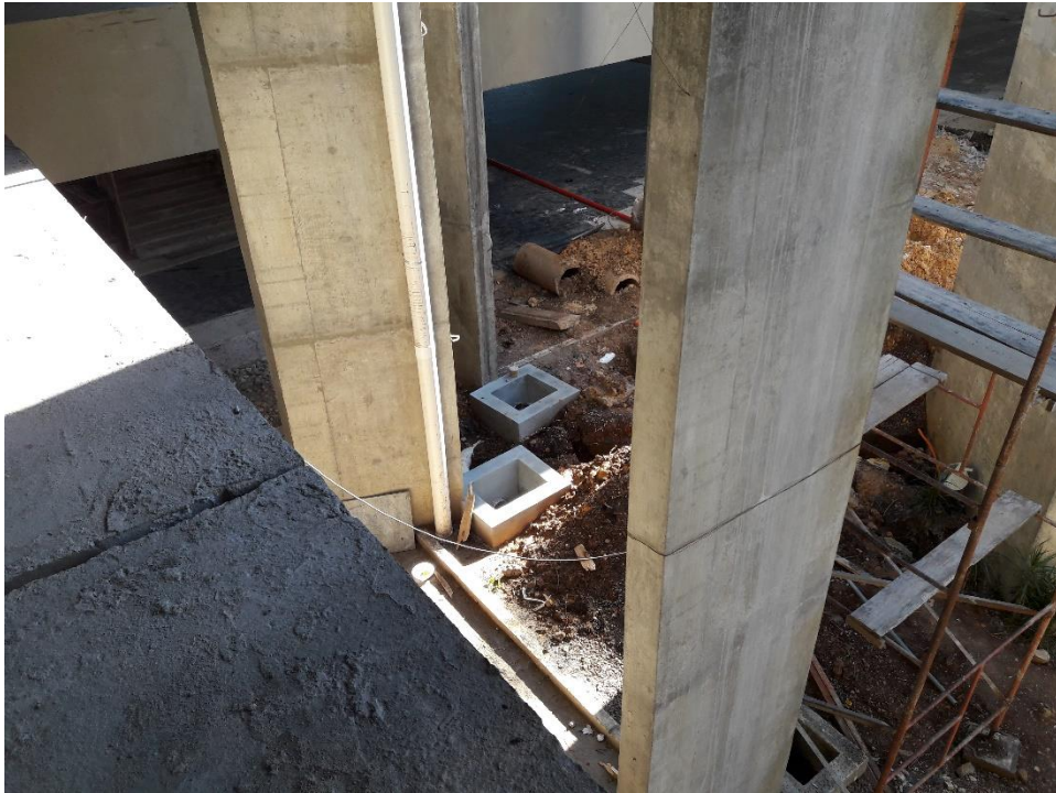
Figura 14: Caixas de inspeção.