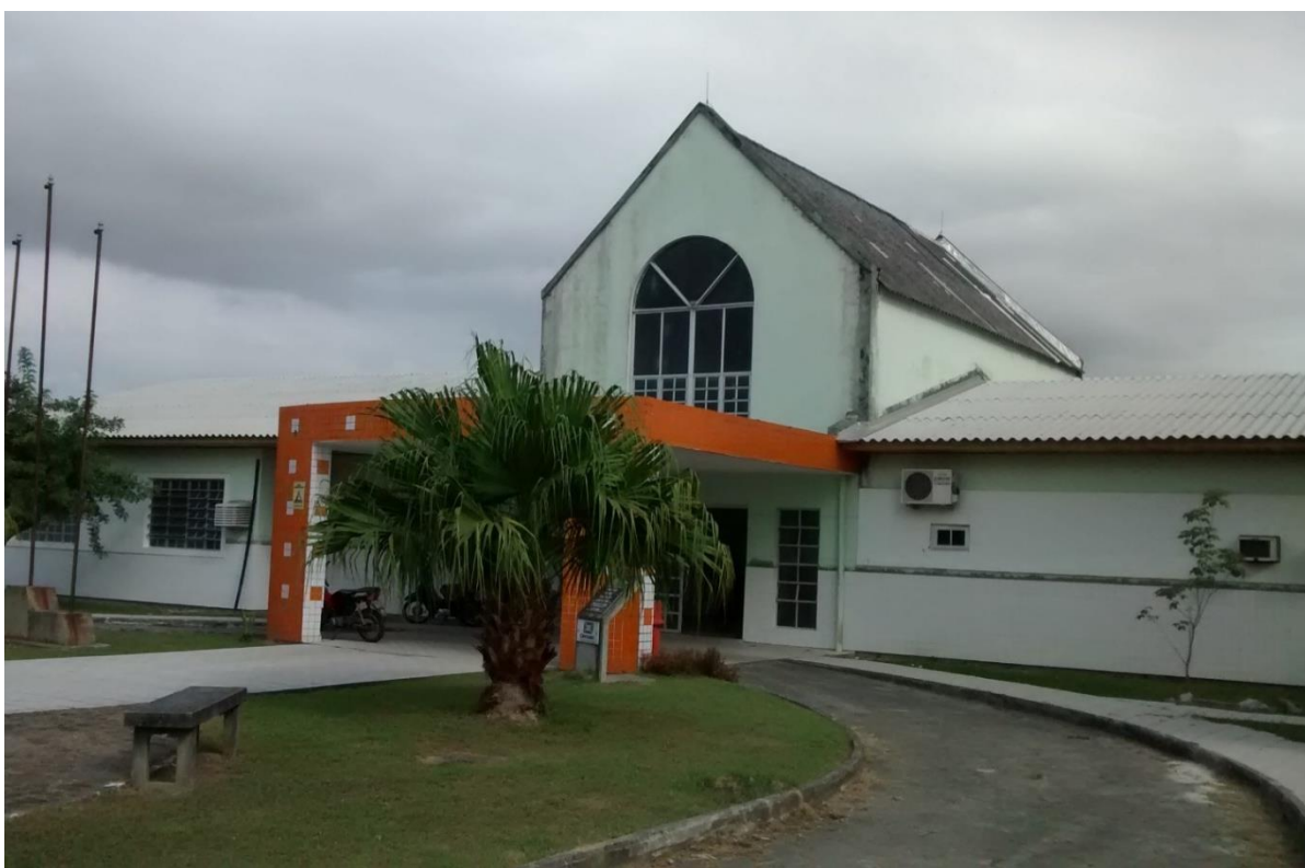
Figura 06: Policlínica do Rio Maina vista frontal.

As visitas duraram cerca de 1 (uma) hora e durante a ocorrência destas foi verificado que a substituição do revestimento cerâmico da área externa do prédio, que estava em andamento na última visita realizada, apresentou uma certa evolução. Foi observado ainda que foi iniciado as obras de ampliação e reforma dos ambientes internos da Policlínica do Rio Maina.