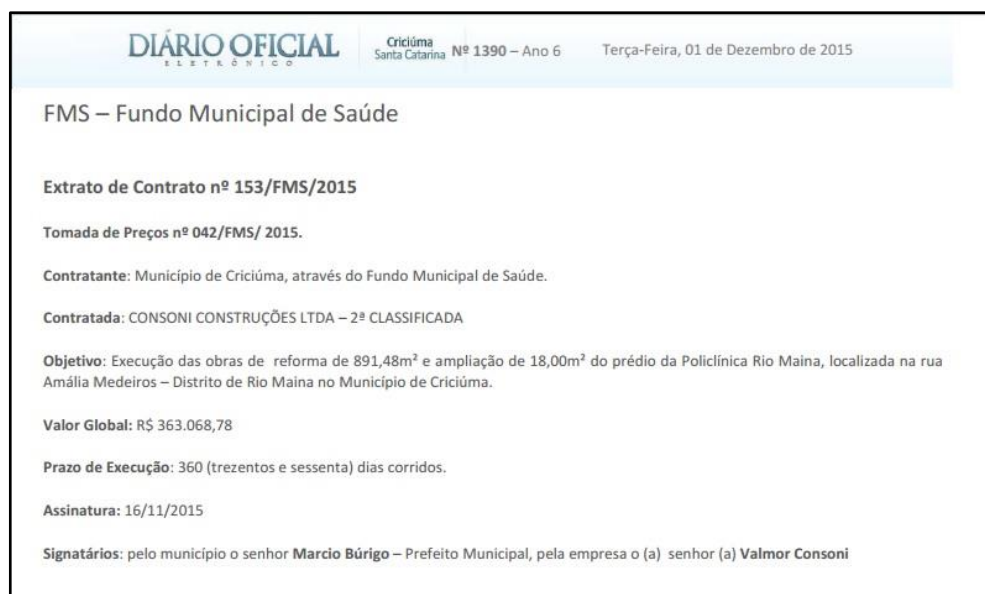
Figura 02: Publicação do novo contrato, número 153/FMS/2015.

Já no dia 01/12/2015 foi publicado no Diário Oficial Eletrônico o novo contrato, número 153/FMS/2015, com a segunda colocada no processo licitatório.