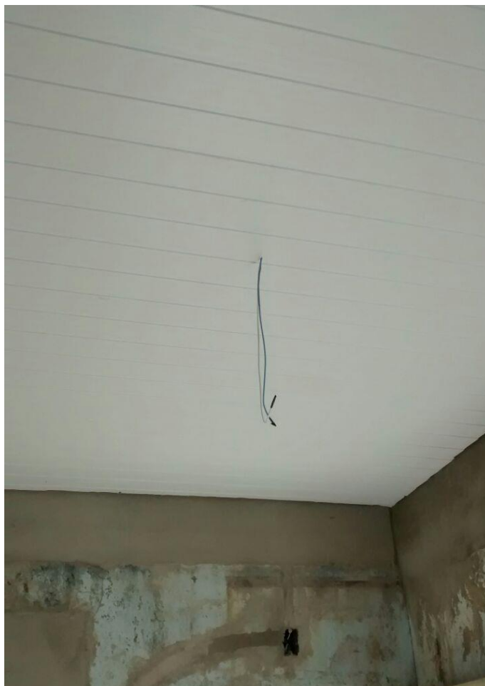
Figura 19: Instalação da cobertura em PVC.

Verificou – se também que estava sendo instalada a cobertura em PVC nos depósitos.