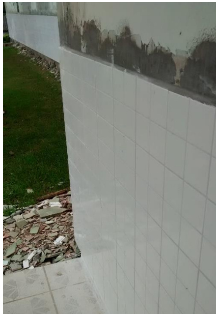
Figura 08: Revestimento cerâmico externo substituído.