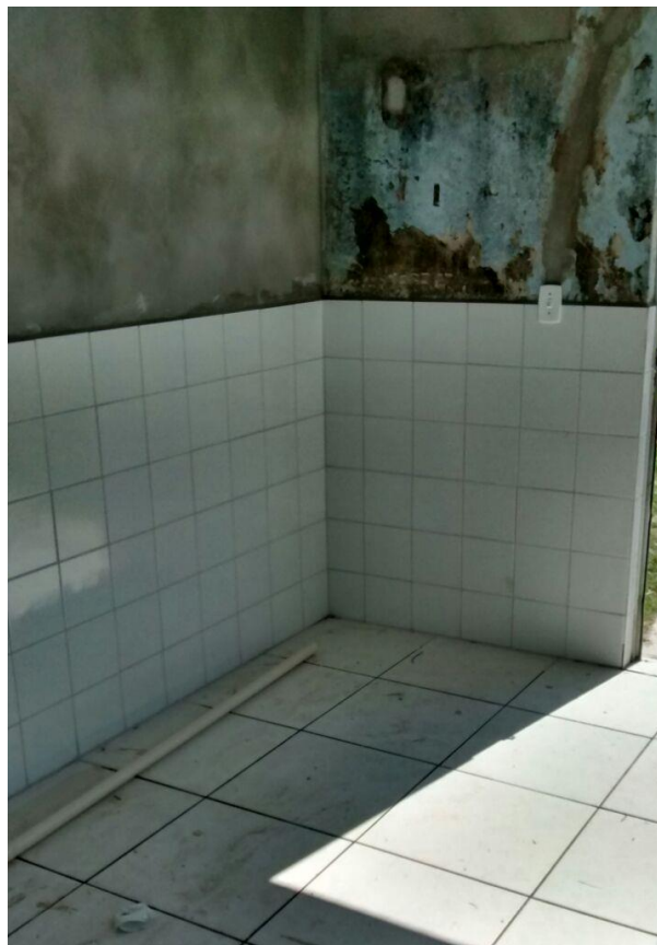
Figura 14: Colocação revestimento cerâmico.