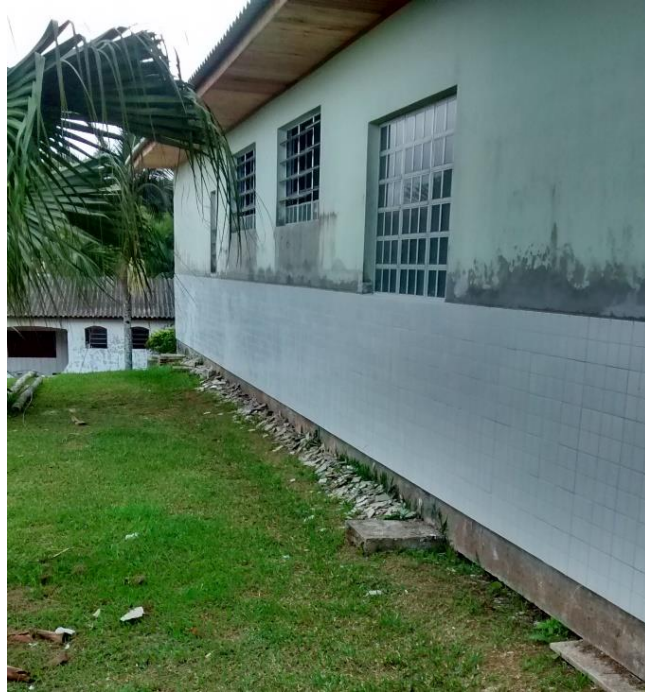
Figura 09: Revestimento cerâmico externo substituído.