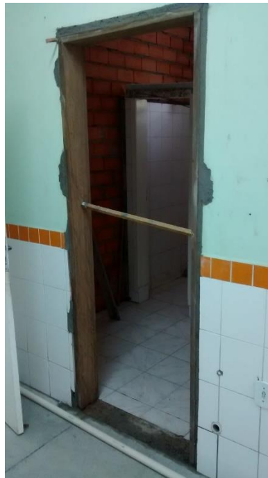
Figura 18: Marco da porta instalado.

Também foram instalados os marcos das portas que dão acesso ao depósito e as áreas limpas e sujas.