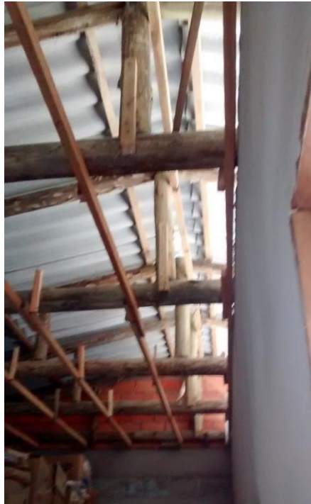
Figura 15: Telhado construído sobre um dos depósitos.

Foi construída uma parede entre o depósito e a área limpa, já entre a área limpa e área suja foi aberta uma passagem entre estes dois ambientes citados.