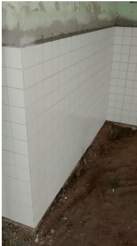
Figura 10: Revestimento cerâmico externo substituído.