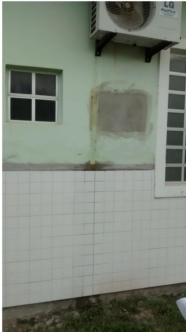
Figura 11: Água do condicionador de ar em contato com o revestimento cerâmico.

Também foi observado pela equipe no decorrer das visitas que em alguns pontos do prédio da Policlínica do Rio Maina ocorre o despejo da água dos condicionadores de água na parede do prédio, mais precisamente aonde foi feita a substituição do revestimento cerâmico, com o passar do tempo isto poderá causar maiores problemas a estrutura do prédio, o ideal é que se despeje esta água em local adequado.