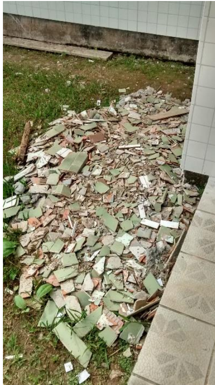
Figura 20: Resíduos da construção no pátio.