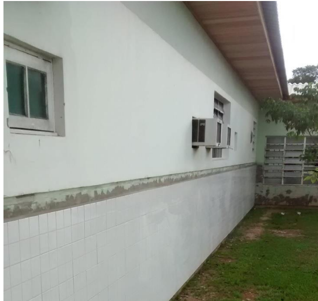
Figura 07: Revestimento cerâmico externo substituído.

Foi evidenciado durante a visita que a substituição do revestimento cerâmico das paredes externas do prédio. A substituição foi feita por revestimento cerâmico na cor branca, com uma altura de 1,20 m do chão.