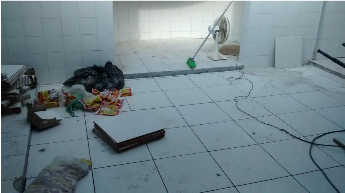
Figura 13: Pavimentação em revestimento cerâmico dos depósitos.