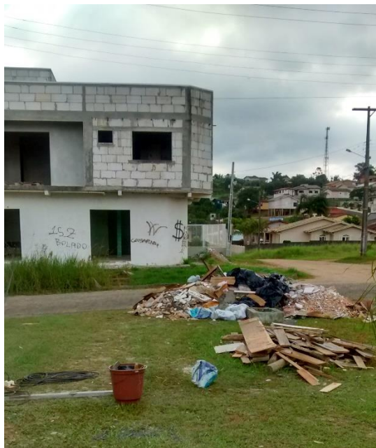
Figura 21: Resíduos da construção no pátio.