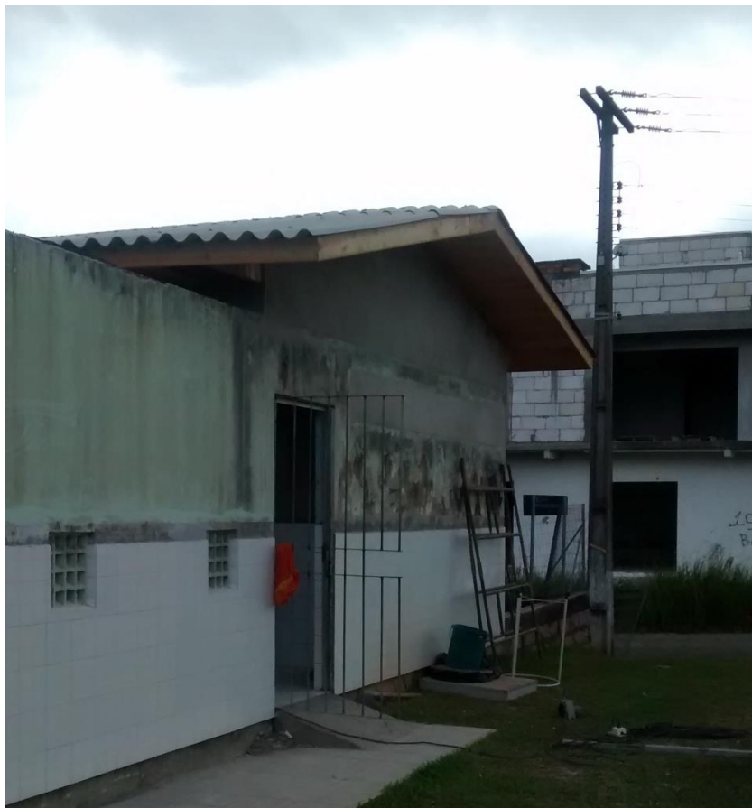
Figura 12: Depósitos da Policlínica do Rio Maina.

As áreas internas em que a obra iniciou foram: os depósitos, a área limpa, a área suja e áreas de uso dos funcionários da Policlínica do Rio Maina. Nos depósitos foi feita a construção da cobertura em um dos depósitos a ser utilizado e ainda estava sendo colocada a pavimentação em revestimento cerâmico, o piso colocado foi de cor branca de 40 x 40 cm e nas paredes estavam sendo colocados os azulejos na cor branca de 20 x 20 cm.