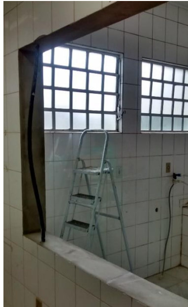
Figura 17: Abertura realizada na parede entre as áreas limpas e sujas. (Fonte: Dos Autores 2016)

Também foram instalados os marcos das portas que dão acesso ao depósito e as áreas limpas e sujas.