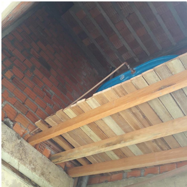
Figura 12: Caixa d'água provisória.