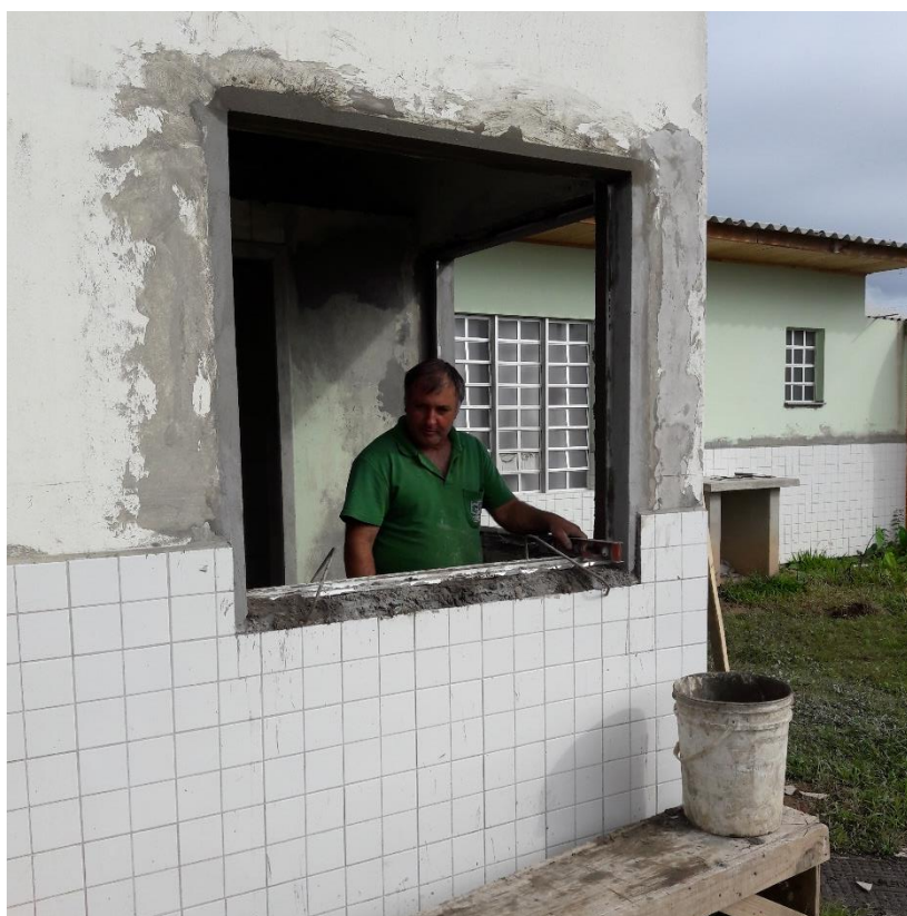
Figura 10: Instalação da esquadria no dia 03/04/2017.