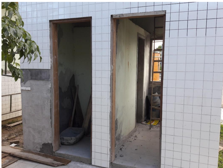
Figura 09: Avanço encontrado no dia 26/04/2017.