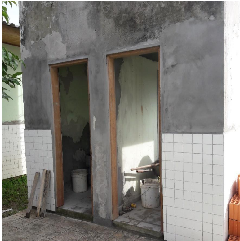
Figura 08: Estado do serviço realizado no dia 03/04/2017.

Além dos serviços citados anteriormente, foi notado que haviam começado a construção e reparo da calçada, serviço o qual não havia sido iniciado no dia 03/04/2017. A análise deste serviço foi de maneira superficial, não podendo então gerarmos uma análise de qualidade na execução, porém de acordo com o que foi analisado e pelas fotos registradas, os métodos e cuidados utilizados na realização deste, estão de forma coerente com um bom serviço.