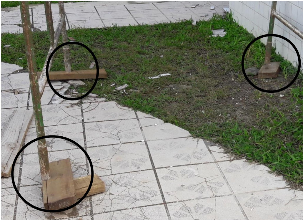
Figura 15: Apoio inadequado dos andaimes.

Um ponto negativo nos serviços detectado pela equipe, gira entorno da segurança dos funcionários ali trabalhando. Na instalação dos andaimes, foi observado que por motivos de nivelamento, foram colocados pedaços de madeira para nivelar a estrutura, porém em alguns pontos de apoio o risco de ocorrer um acidente é grande. Conforme imagem abaixo, o apoio está no limite do suporte, correndo grandes chances de escapar e tombar a estrutura provocando acidentes.