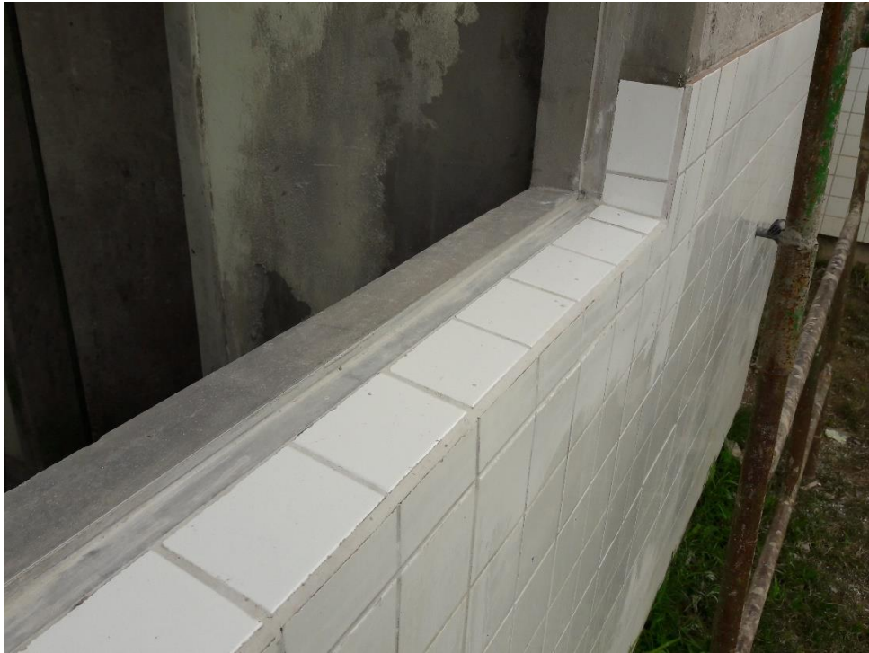
Figura 11: Esquadria já finalizada no dia 26/04/2017.