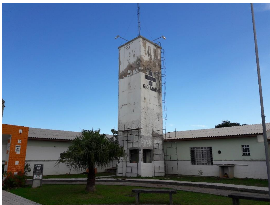
Figura 06: Local de realização dos trabalhos.

Pôde-se observar que a obra estava paralisada, tal constatação ficou evidenciada após a verificação de que não havia nenhum funcionário da empresa responsável pela execução da obra no local. Porém conforme foi informado por funcionários da unidade, haveriam 2 (dois) funcionários da empresa responsável trabalhando no local, apesar de não estarem presentes no momento da visita.