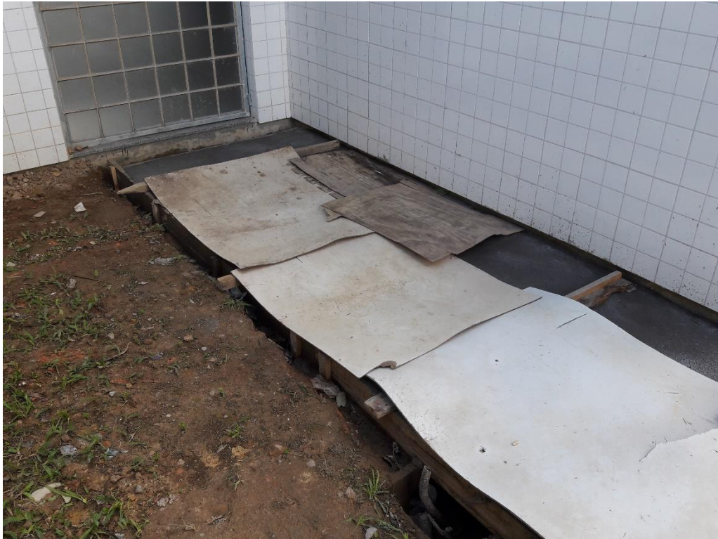
Figura 13: Construção da calçada acesso direto à unidade.