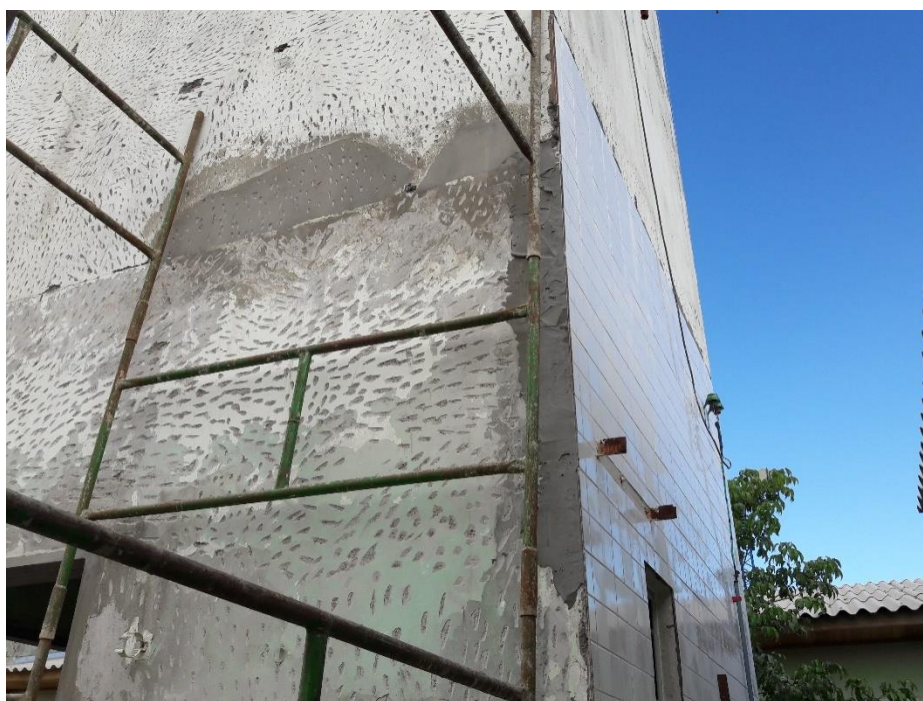
Figura 07: Remoção do revestimento para assentar o azulejo.

Conforme foi constatado, os serviços estão paralisados e a reforma está com um andamento muito lento, abaixo do recomendado por se tratar de uma urgência.