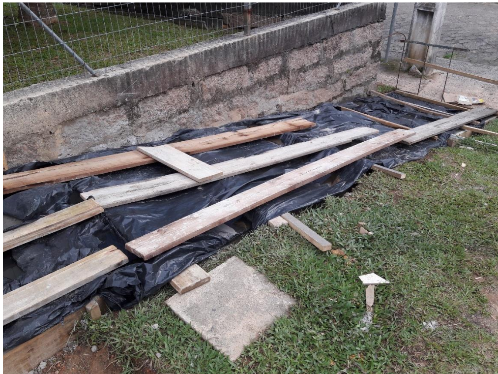
Figura 14: Construção da rampa de acesso.