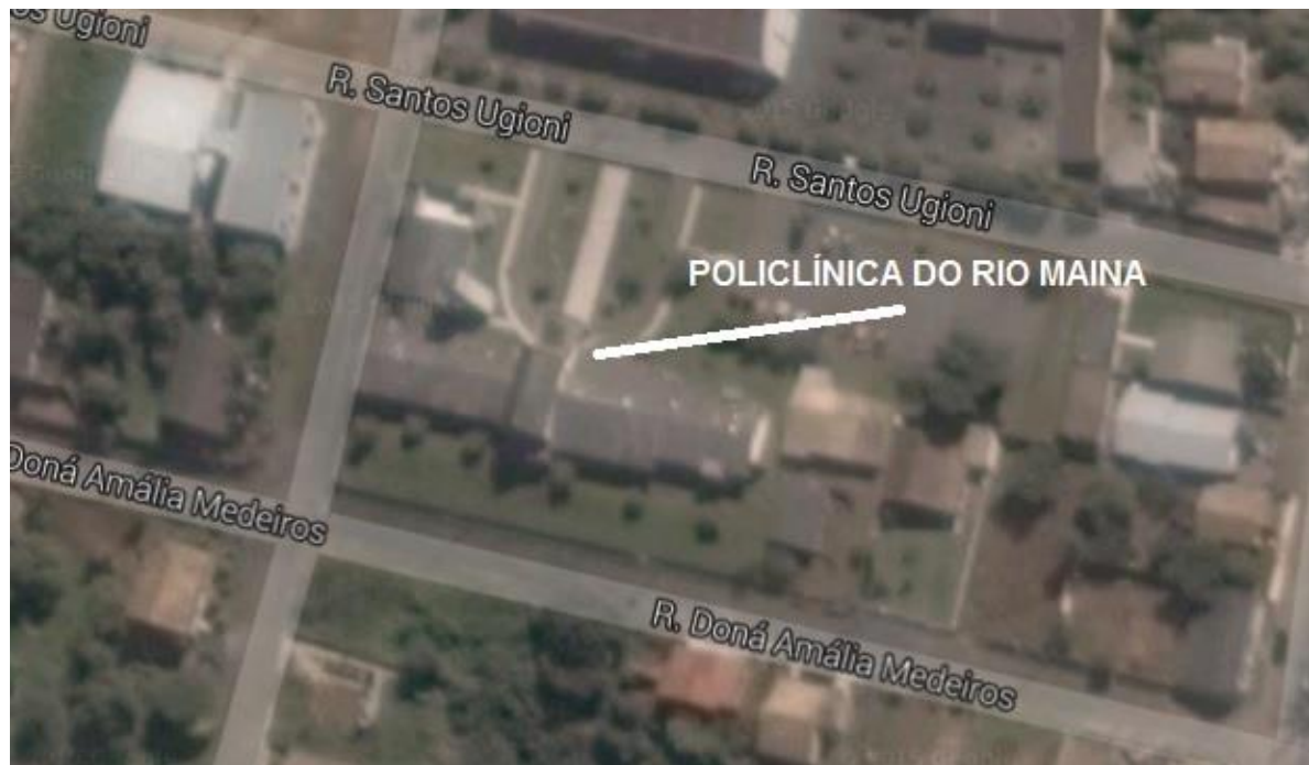
Figura 03: Localização Policlínica do Rio Maina.

A obra acompanhada está sendo executada na Policlínica do Rio Maina, que está localizada na Rua Amália Medeiros no Distrito de Rio Maina em Criciúma – SC.