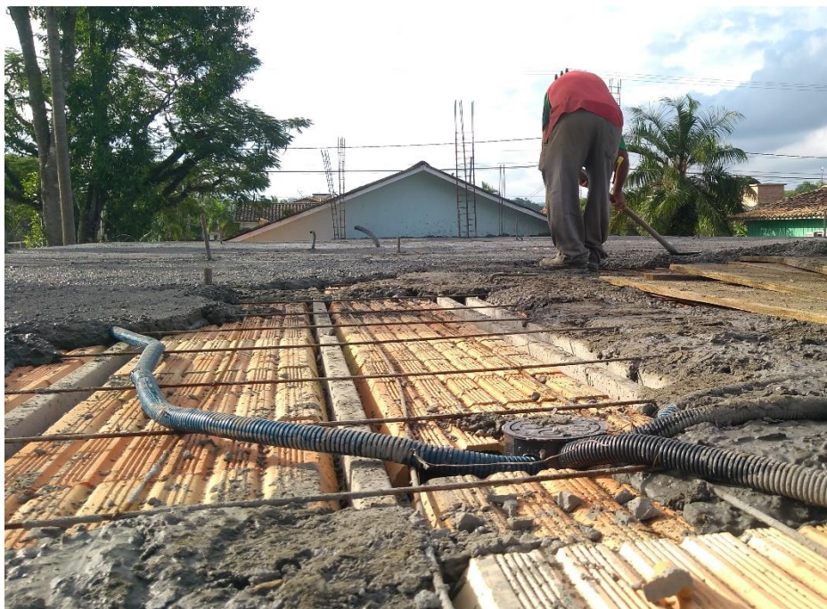
Figura 19: Concretagem da laje e trabalhador sem EPI