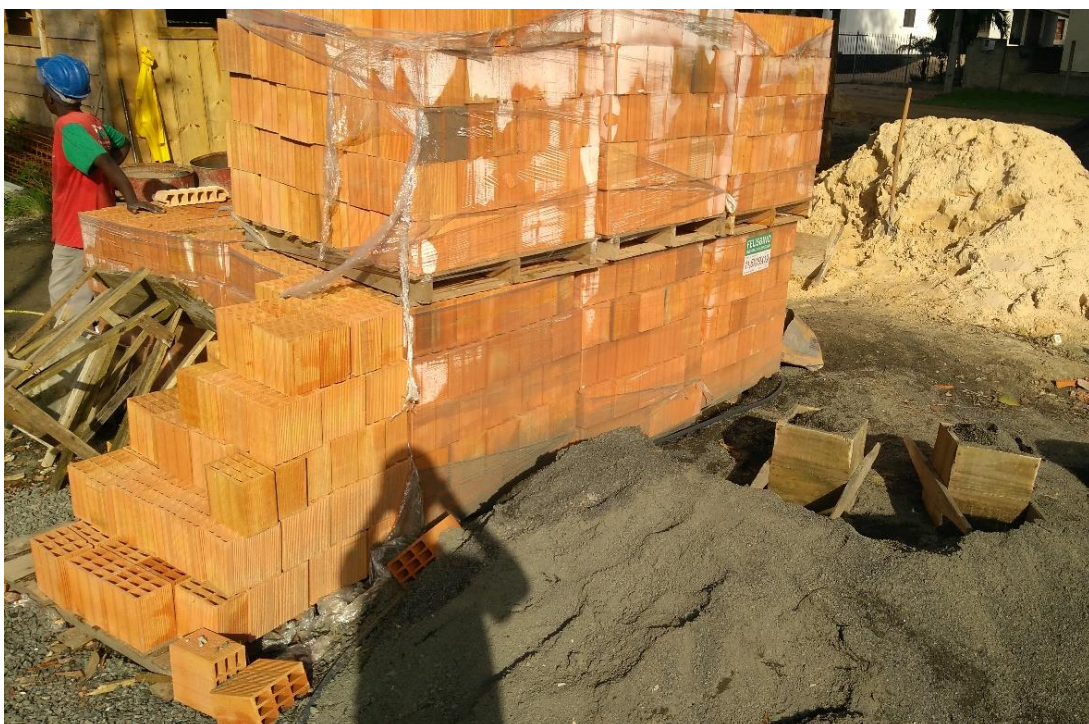
Figura 15: Armazenamento de blocos cerâmicos