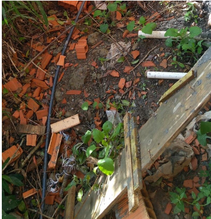
Figura 12: Entulho da obra descartado incorretamente

Percorrendo o canteiro, não foi observado nenhuma mudança com relação ao armazenamento dos materiais desde a primeira visita, porém as barras metálicas encontravam-se em processo de oxidação, pois ficaram expostas à agentes naturais como a chuva e a umidade.