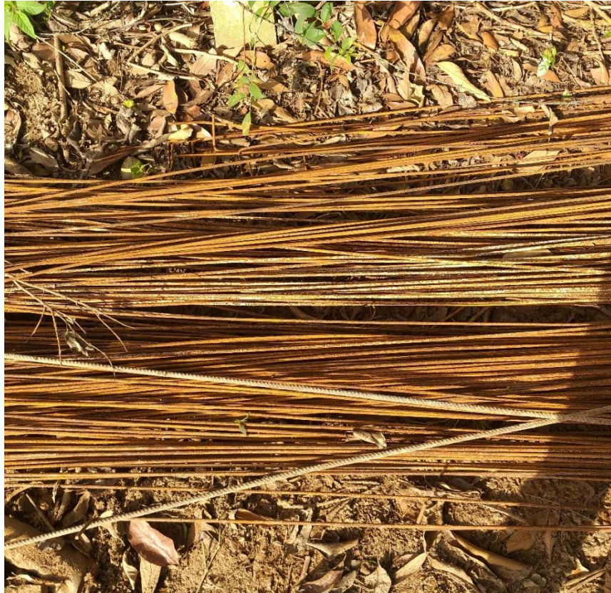
Figura 16: Barra metálica e processo de oxidação