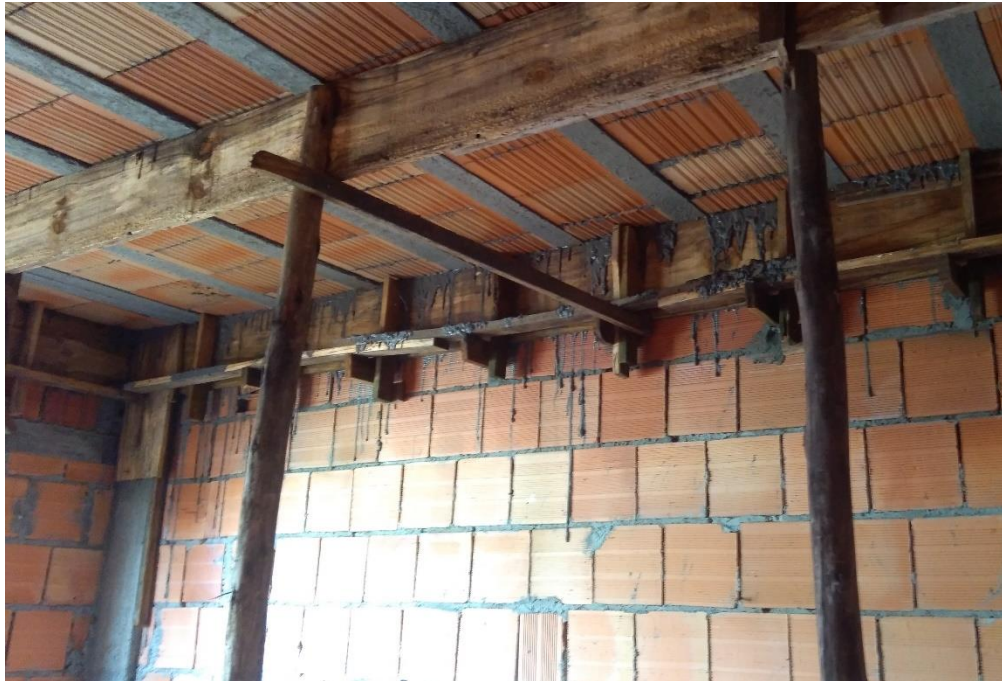
Figura 20: Etapa de execução da laje pré-moldada