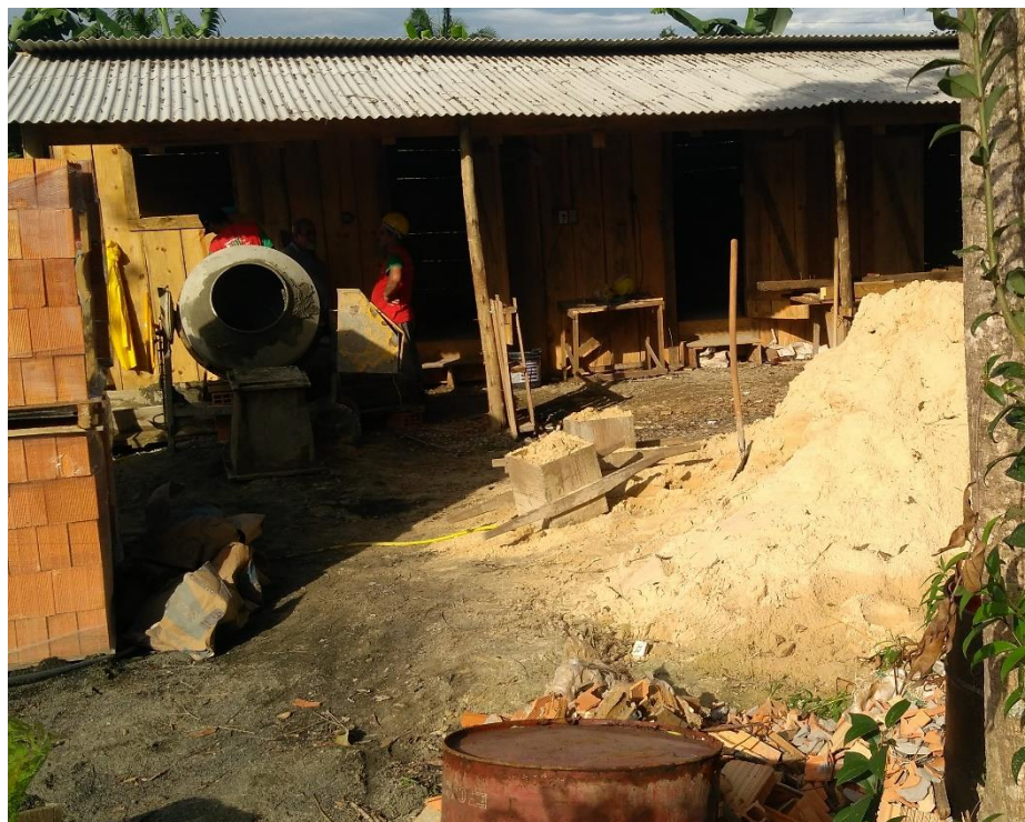
Figura 9: Canteiro de obras