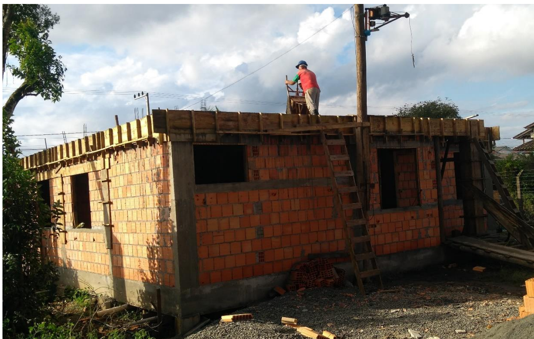
Figura 7: Fachada posterior UBS Mãe Luzia