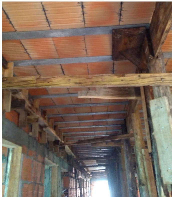
Figura 23: Etapa de execução da laje pré-moldada