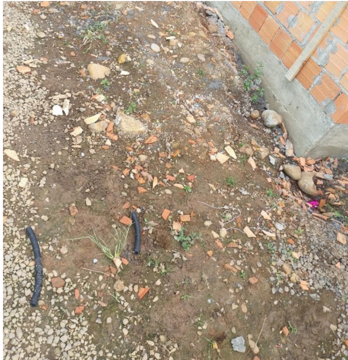
Figura 10: Entulho da obra descartado incorretamente

Na primeira visita realizada à obra, notou-se que havia muita sujeira por e todo o canteiro de obra além de desorganização, problema este que persistia na segunda visita.