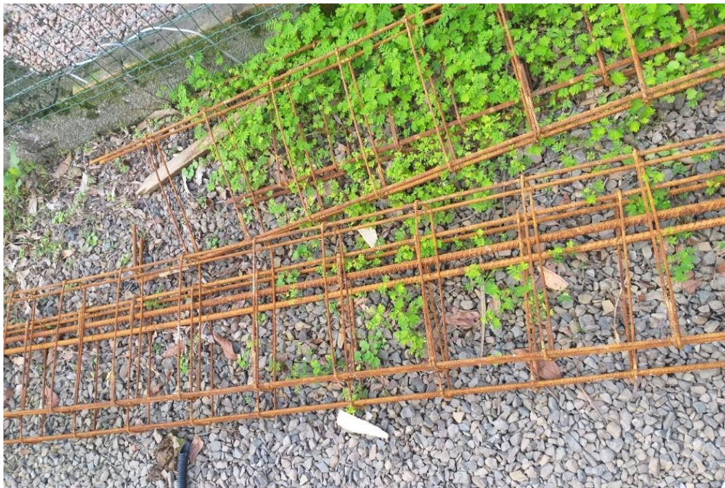
Figura 17: Ferragem em processo de oxidação