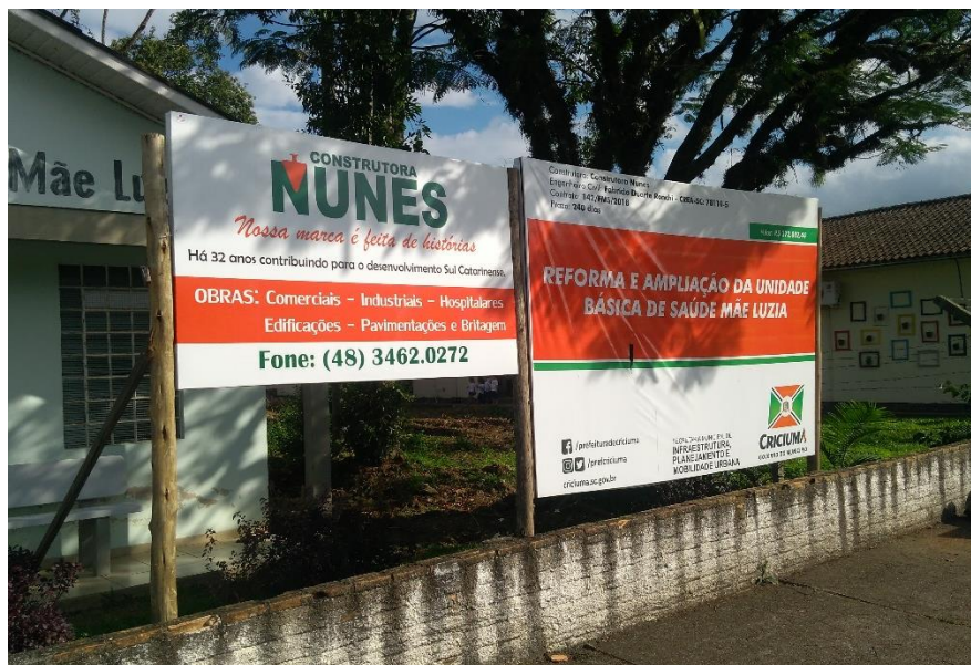
Figura 4: Placa para identificação da obra em execução.

No dia 24 de abril do ano de 2019, foi realizada a segunda visita à obra de construção da Unidade Básica de Saúde do bairro Mãe Luzia, com o objetivo de verificar o andamento e condições da obra, e a qualidade dos serviços ali executados. A visita durou cerca de trinta (30) minutos.