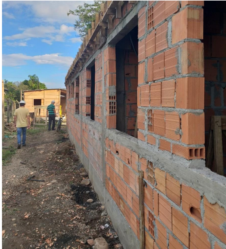
Figura 6: Fachada lateral UBS Mãe Luzia