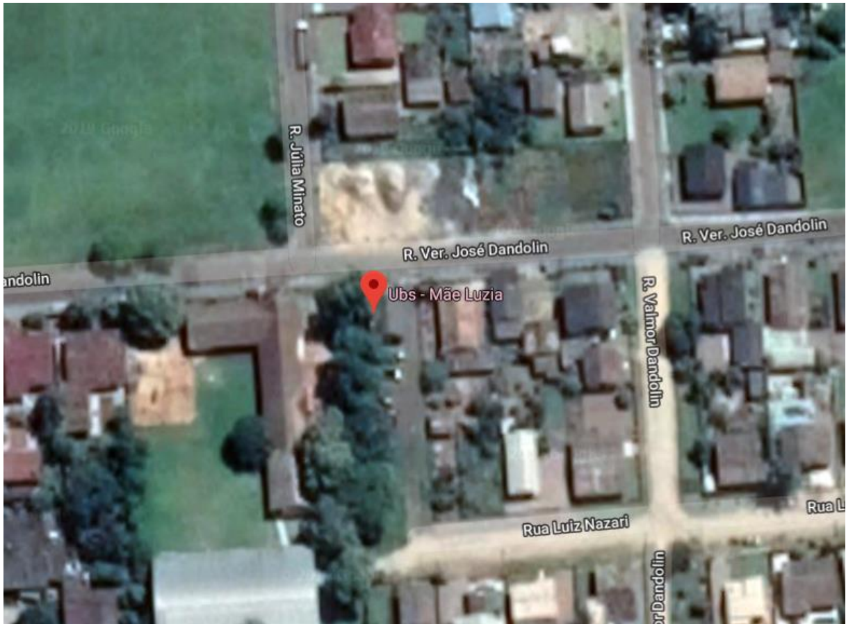
Figura 1: Localização da UBS Mãe Luzia.

A obra acompanhada está sendo executada na UBS Mãe Luzia, localizada na rua Ver. José Dandolini – bairro Mãe Luzia no Município de Criciúma - SC.