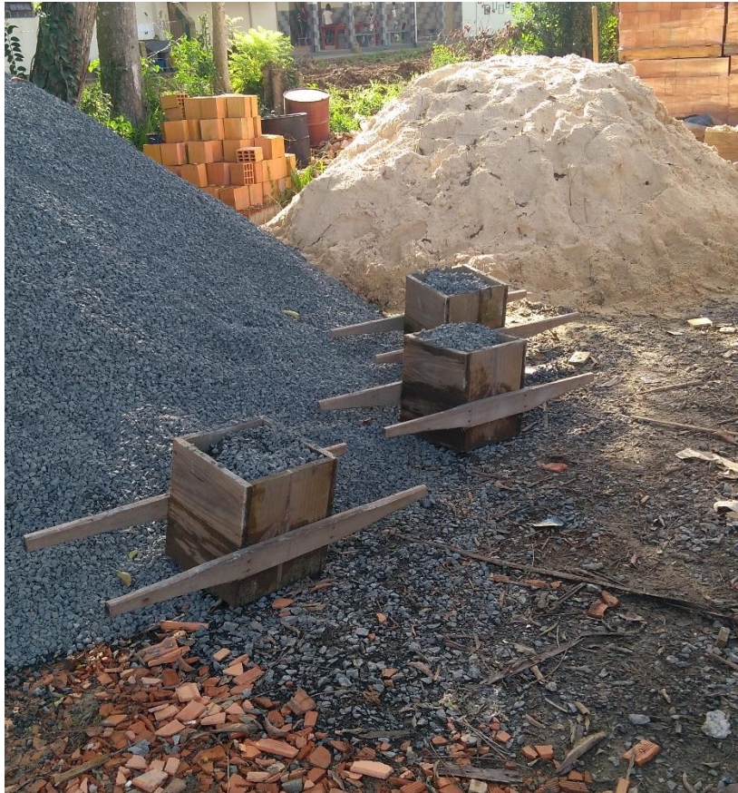
Figura 8: Padiolas