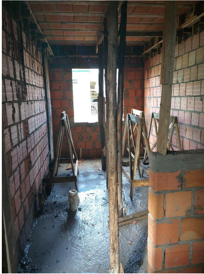
Figura 22: Consultório - Etapa de execução da laje pré-moldada