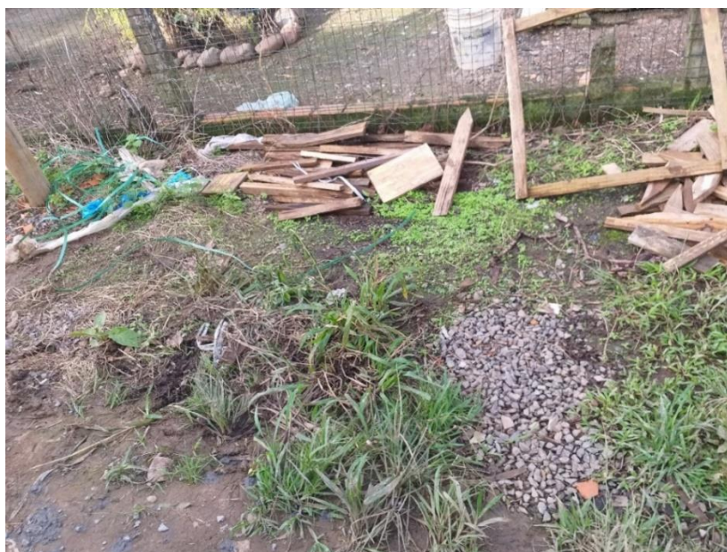
Figura 11: Entulho da obra descartado incorretamente