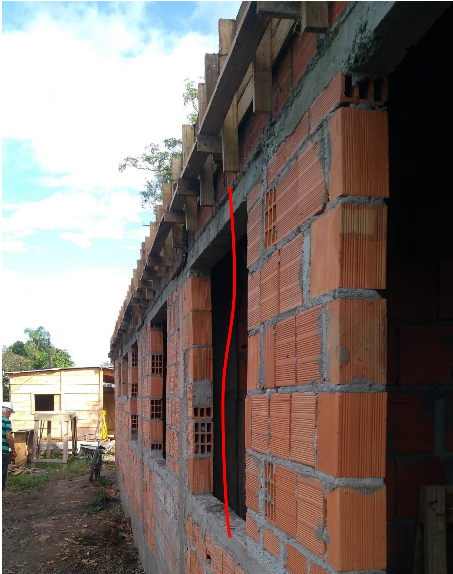
Figura 24: Barriga nas paredes externas da edificação

Na última visita foi observado barrigas nas paredes externas da edificação, estas que ainda permanecem e estão ainda mais visíveis.