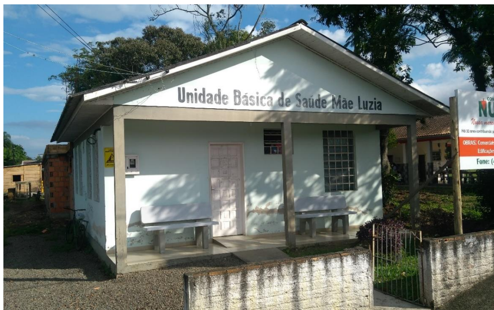
Figura 5: Fachada Frontal UBS Mãe Luzia