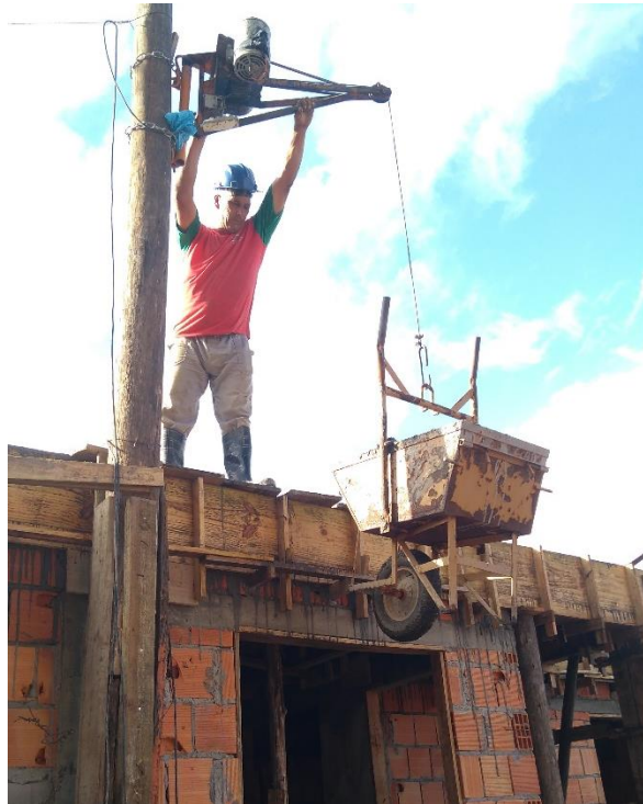
Figura 18: Trabalhador sem EPI necessário

Sobre o andamento da obra, esta está em fase de execução da laje pré-moldada. Diversos trabalhadores estavam no local fazendo a concretagem da mesma, alguns sem os EPIs necessários.