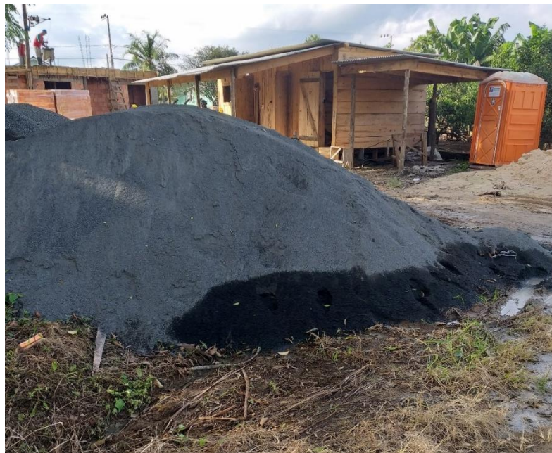
Figura 13: Armazenamento do material

Percorrendo o canteiro, não foi observado nenhuma mudança com relação ao armazenamento dos materiais desde a primeira visita, porém as barras metálicas encontravam-se em processo de oxidação, pois ficaram expostas à agentes naturais como a chuva e a umidade.