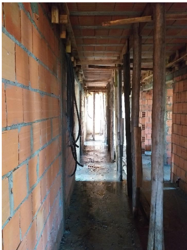
Figura 21: Corredor de acesso - Etapa de execução da laje pré-moldada