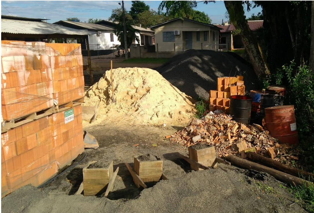
Figura 14: Armazenamento dos materiais