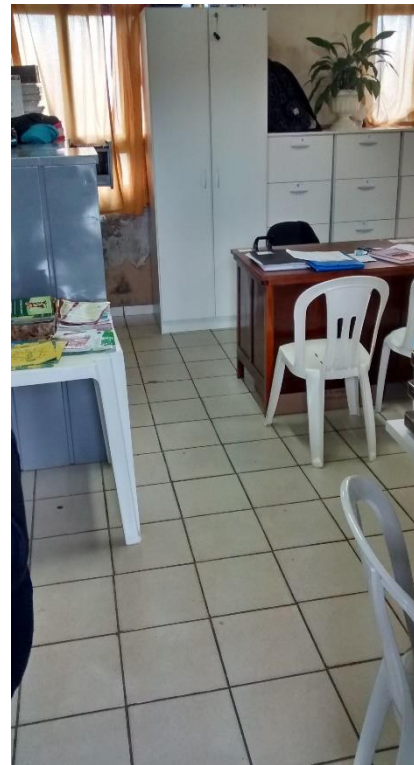
Figura 12: Salas a serem demolidas com a ampliação do CRAS.