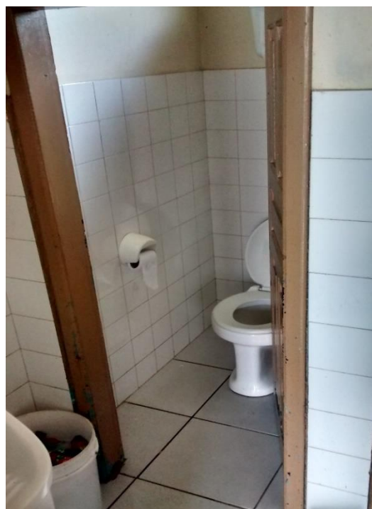
Figura 06: Banheiro.