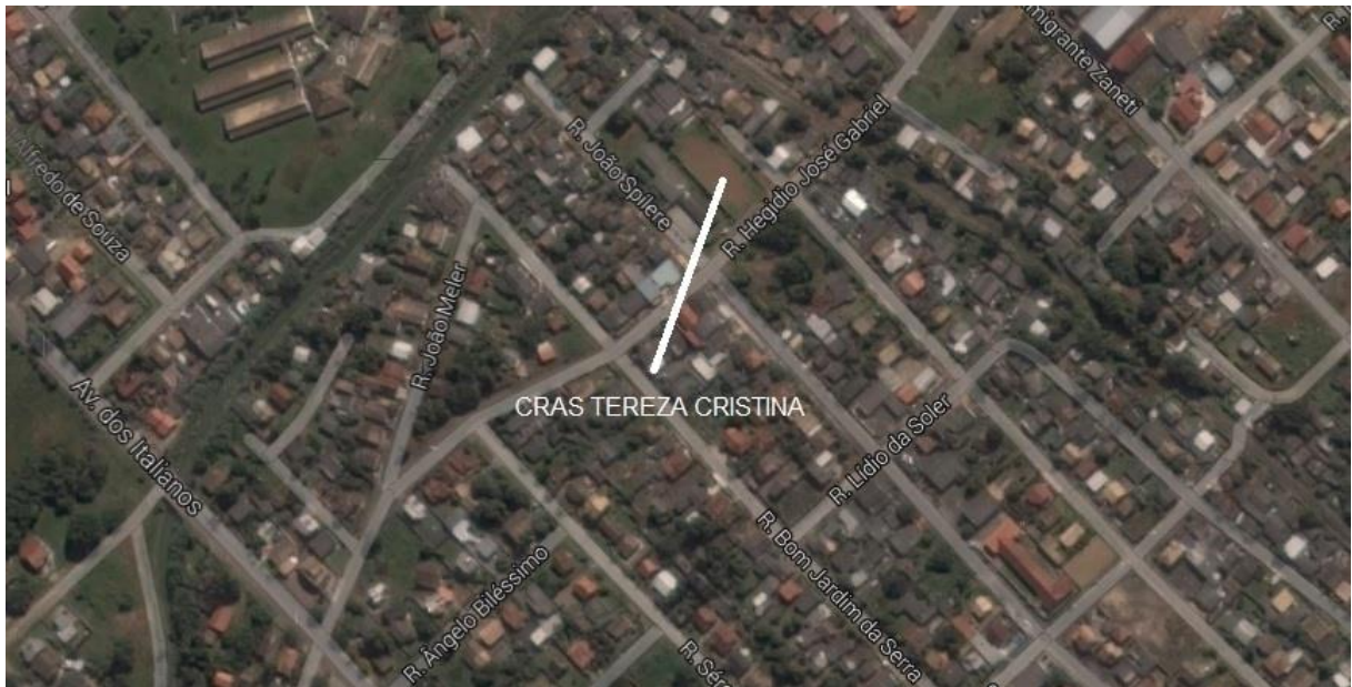
Figura 01: Localização CRAS Tereza Cristina.

A obra acompanhada será executada no CRAS Tereza, que está localizado na Rua José Spillere no Bairro Tereza Cristina em Criciúma – SC.