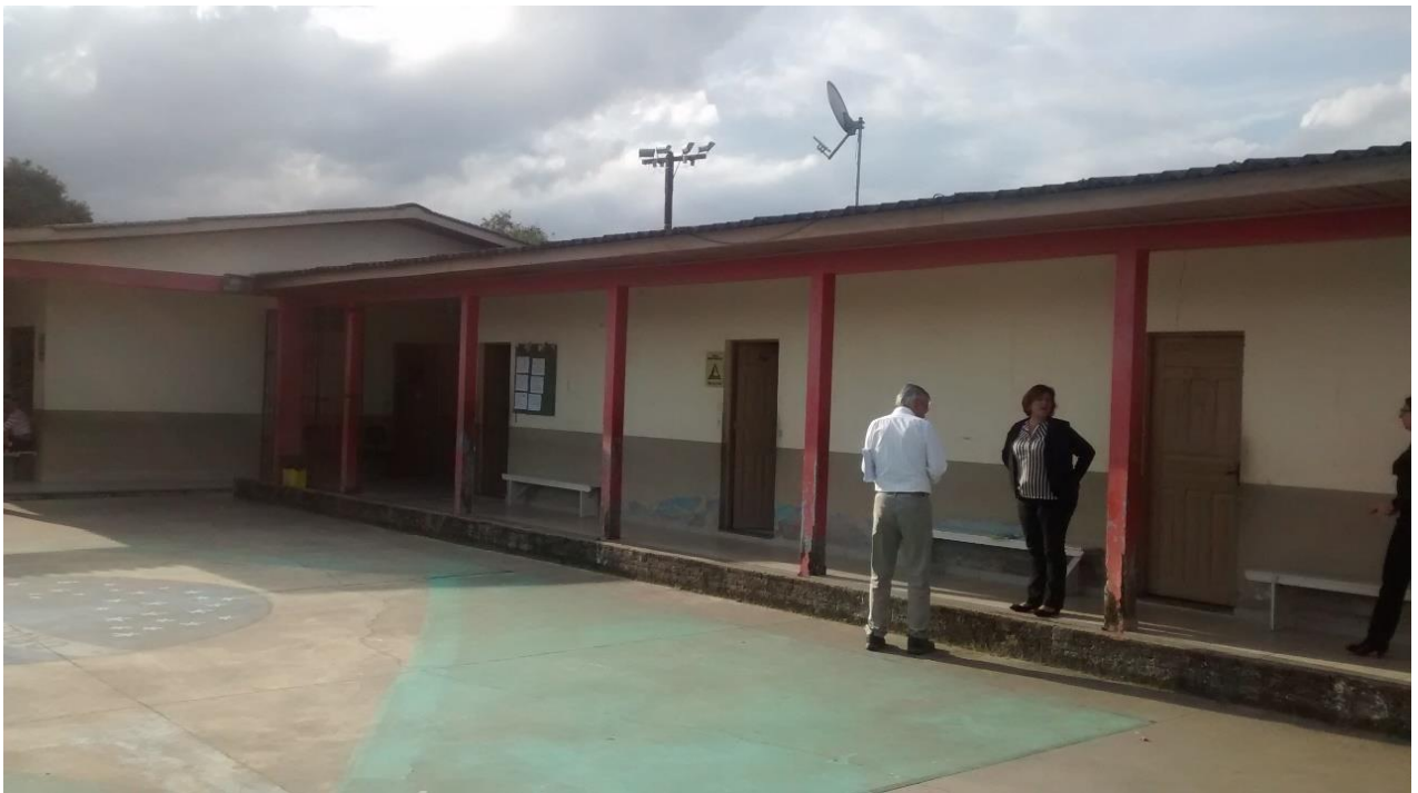
Figura 04: Pátio e área do CRAS a ser ampliada.

A visita durou cerca de 1 (uma) hora e durante a ocorrência desta algumas informações importantes foram repassadas. O CRAS Tereza Cristina atende atualmente 10 bairros considerados em situação de risco do município de Criciúma – SC e possui cerca de 1800 famílias cadastradas, conforme comentado pela coordenadora do CRAS a instituição serve ainda café da manhã, almoço e janta diariamente. No CRAS são desenvolvidas atividades como aulas de computação, aulas de danças, etc.