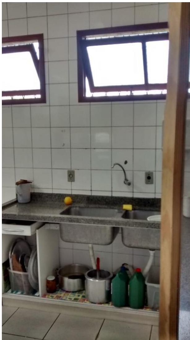
Figura 07: Cozinha.

Conforme verificado o prédio apresenta muitos pontos com infiltrações. Existem infiltrações na parte inferior das paredes, isso verifica – se principalmente na parte posterior no prédio, local aonde o solo apresenta – se bastante encharcado. As paredes devido a esse problema já tiveram a sua camada de pintura destruída e acabam se “esfarelando” ao sofrer algum tipo de atrito.