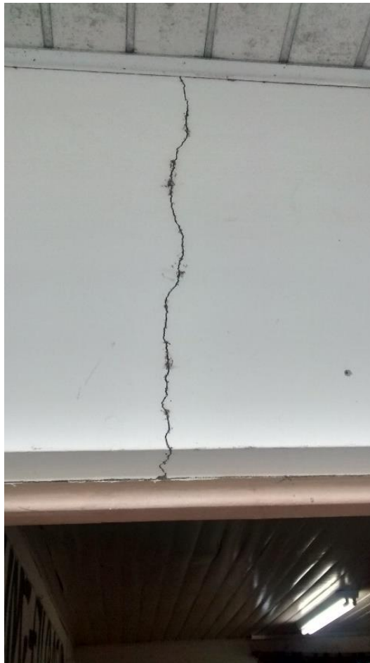
Figura 10: Paredes apresentando fissuras.

Verificou –se também que o prédio apresenta fissuras em alguns locais, tais como: sobre as portas e cantos de paredes. Na parte frontal do prédio existem ainda pilares que estão com as ferragens expostas devido ao desgaste dessas estruturas, comprometendo assim o desempenho desses pilares uma vez que as ferragens apresentam inclusive oxidação.