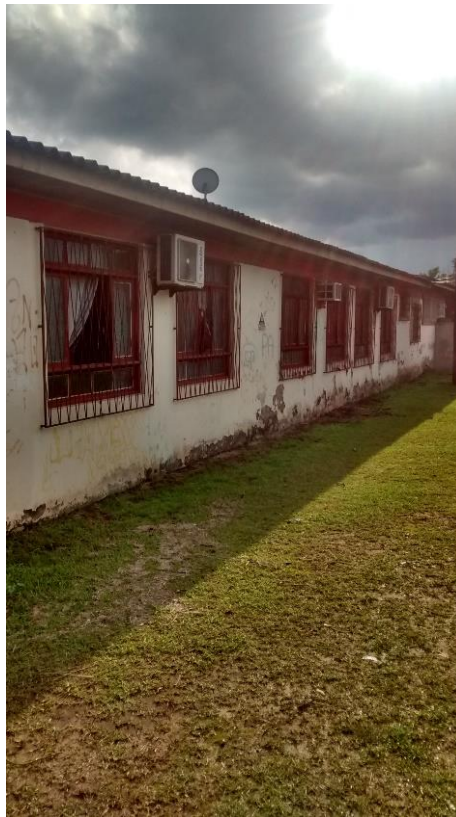
Figura 09: Paredes da parte inferior do prédio apresentando infiltração.