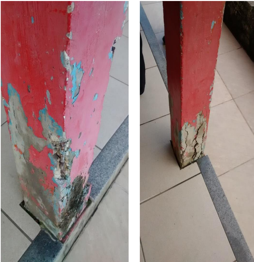
Figura 11: Pilares com ferragens expostas.

Ainda foi constatado que alguns ambientes sofrerão ampliação em seu espaço físico por questões de um melhor conforto para o desempenho das atividades naquele local. As salas apresentam o pé direito muito baixo o que com a incidência do sol acaba gerando um aumento acentuado da temperatura, já em outros ambientes que serão ampliados como a cozinha e banheiros o aumento será feito afim de aumentar o espaço físico existente. Conforme verificado durante a visita, o banheiro existente, por exemplo, também funciona como um depósito de materiais de limpeza.