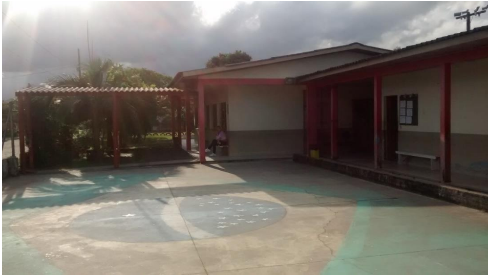
Figura 05: Pátio e entrada do CRAS.

A área a ser reformada no prédio é de 256,15 m 2 , conforme constatado durante a visita verificou – se que os blocos a serem reformados apresentam diversas patologias em sua estrutura, de acordo com as fotos em anexo.