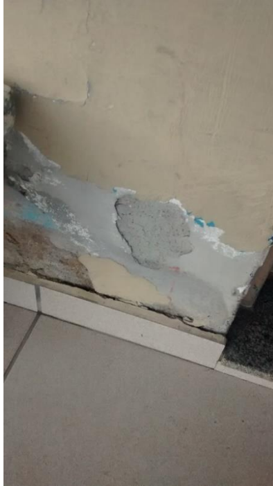
Figura 08: Paredes apresentando infiltração.