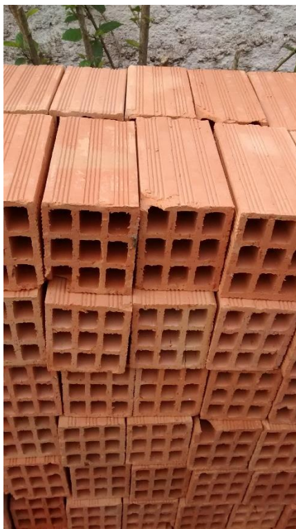
Figura 06: Tijolos a serem utilizados na alvenaria.