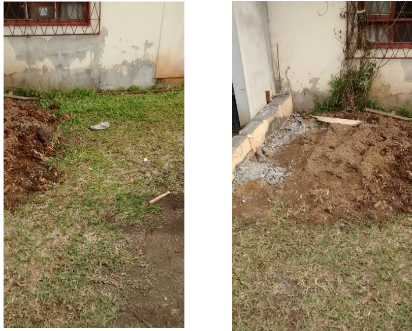
Figura 08: Sala com infiltração na parede.