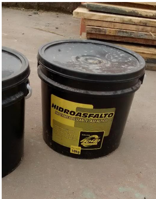
Figura 07: Impermeabilizante.