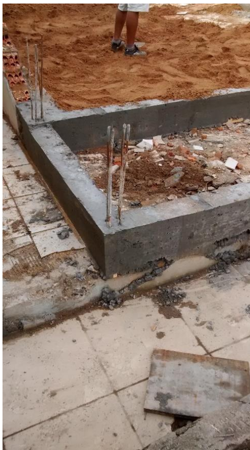
Figura 05: Arranques.

No pátio de obras já estavam alocados os tijolos, que estavam conforme o memorial descritivo e o impermeabilizante a ser utilizado para a impermeabilização das vigas de baldrame.