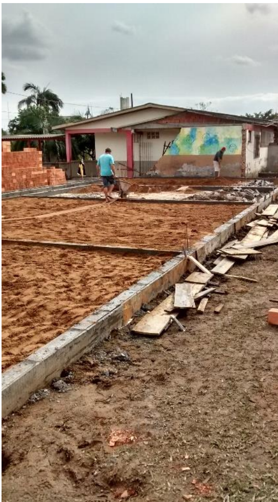
Figura 04: Aterramento das vigas de baldrame.

Com relação a nova estrutura as fundações já estavam todas executadas, os arranques estavam finalizados e as vigas de baldrame também. O pessoal da obra estava executando neste dia o aterro das vigas para posterior concretagem da pavimentação do CRAS.