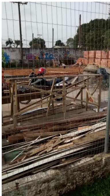
Figura 03: Área do CRAS demolida.

A visita durou cerca de 1 (uma) hora e durante a ocorrência desta constatou – se que a obra já estava sendo executada e estava de acordo com o cronograma físico. Conforme a ordem de serviço assinada no dia 18 de junho de 2015 a obra seria executada a partir desta data no prazo de 270 dias, no dia da visita a obra estava em seu 24º dia. De acordo com o cronograma físico da obra nos primeiros 30 dias seriam executados os serviços iniciais da obra tais como: demolição da estrutura antiga, execução de fundações, arranques e vigas de baldrame.