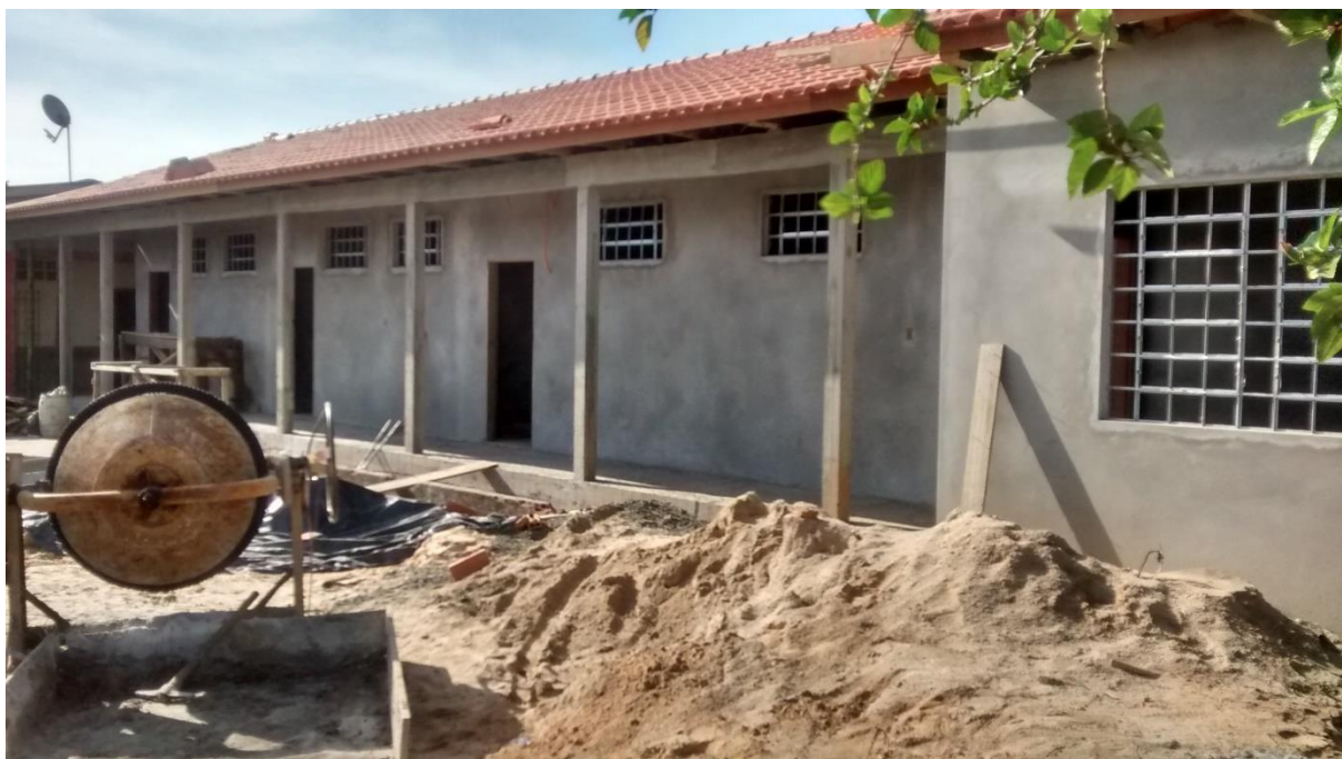
Figura 05: Fachada frontal do CRAS.

A visita ocorreu no 72ª dia de obra, verificou-se que de acordo com o cronograma físico de execução da obra os serviços detalhados para este período estão de acordo e estão sendo executados ou já foram executados. Por exemplo os serviços iniciais, os serviços de fundações, arranques, vigas de baldrame e impermeabilização estavam executados, outros serviços que estavam sendo executados no dia da visita e que estão previstos até o prazo de 90 dias, conforme o cronograma físico, são colocação das esquadrias e a execução da cobertura, respectivamente 50% e 30% destes serviços.