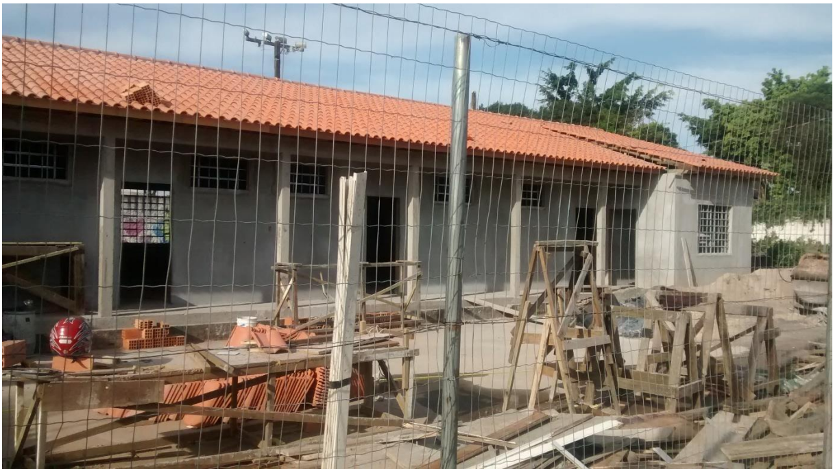
Figura 04: Fachada frontal do CRAS.

A visita durou cerca de 1 (uma) hora e 30 (trinta) minutos, durante a ocorrência desta verificou-se que as estruturas em alvenaria bem como a cobertura já estavam sendo executadas, também foi observado que estavam sendo colocadas as janelas basculantes quadriculadas 20x20 cm.