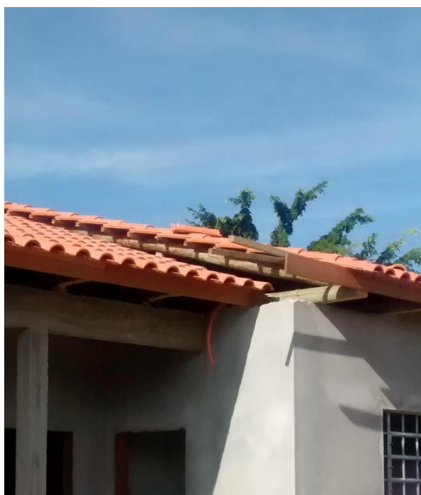
Figura 06: Detalhe da elevação da cobertura sobre o depósito.

de apoio das armações sobre o depósito é maior que o restante do vão de cobertura, ainda conforme relatado por ele os responsáveis técnicos da obra analisaram o caso e chegaram à conclusão de que seria colocado uma chapa metálica para evitar a entrada de água, porém conforme verifica-se na foto disponível no relatório ficou esteticamente feio e além do mais o risco de infiltrações ou qualquer outro problema devido a esta elevação na cobertura aumenta se não for bem executado o reparo a este problema.