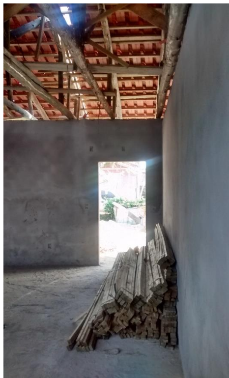
Figura 10: Sala de aula.