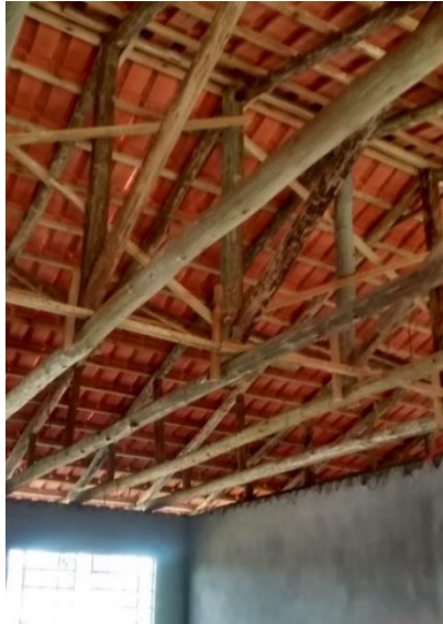
Figura 07: Armações vistas da parte interna do prédio.

e no depósito. No dia da visita o pessoal da obra estava executando acabamento aonde foram instaladas essas esquadrias. A pavimentação conforme verificada já estava executada bastando apenas os serviços de colocação do revestimento cerâmico.