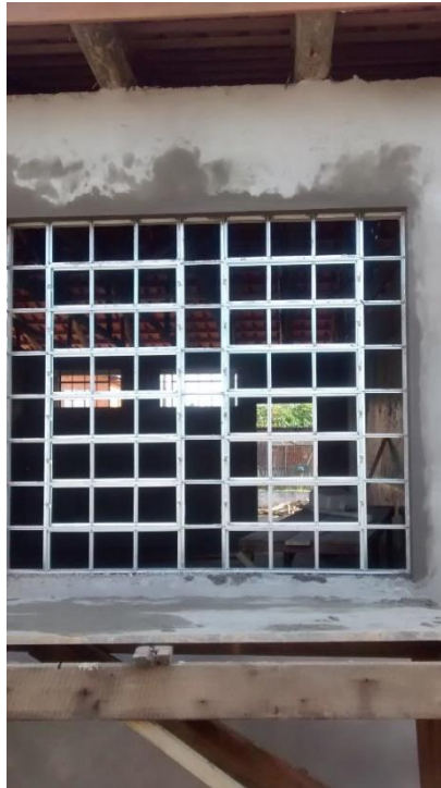
Figura 09: Esquadrias recebendo acabamento no dia da visita.