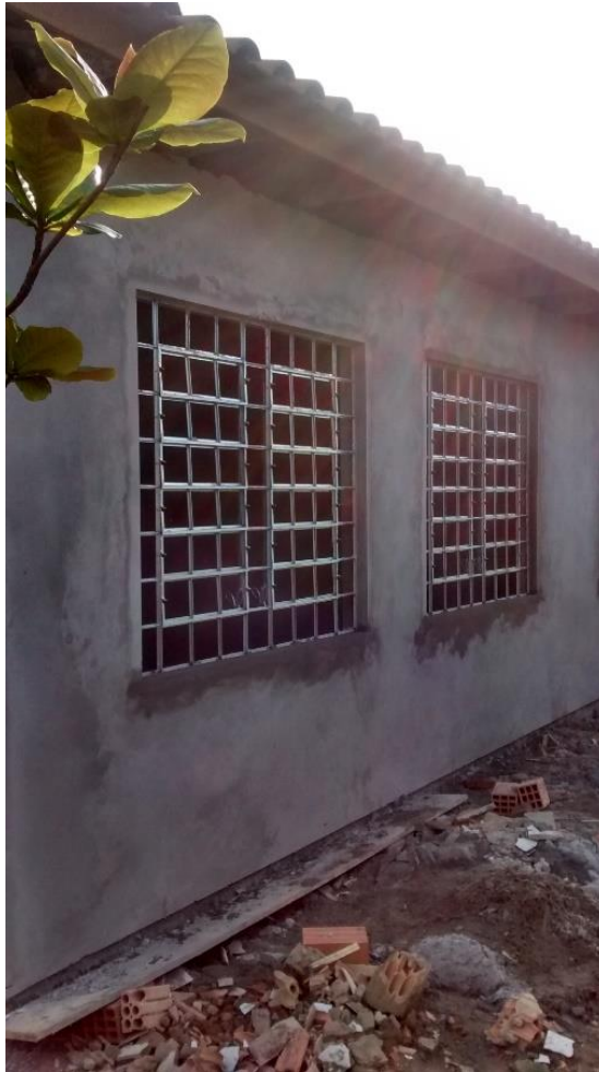
Figura 11: Fachada posterior do CRAS.

Na ampliação dos banheiros e cozinha constatou-se que as obras estavam e em ritmo mais lento que os demais, as paredes estavam executadas e os vãos para colocação das esquadrias também, porém estes ambientes estão em contato com a parte do CRAS que está em funcionamento e terá que ser feita uma recolocação do pessoal do CRAS para a finalização destes ambientes isso explica o ritmo mais lento das obras nestes dois locais citados.