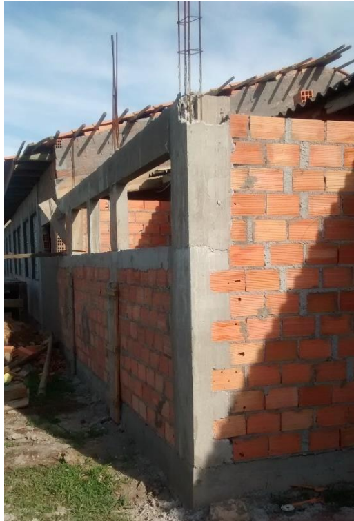
Figura 12: Ampliação banheiros e cozinha.