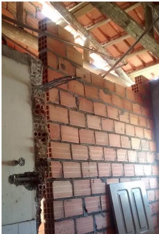
Figura 13: Ampliação banheiro.