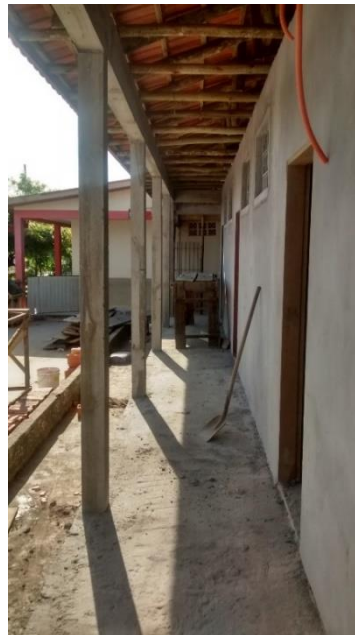
Figura 08: Circulação fachada frontal.