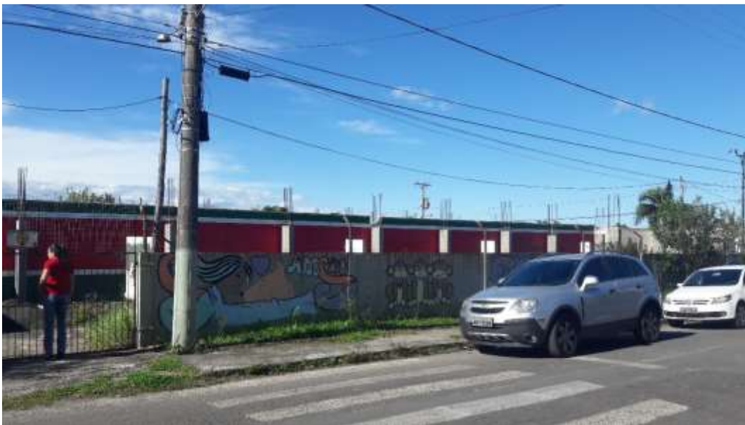
Figura 01: Fachada da escola.