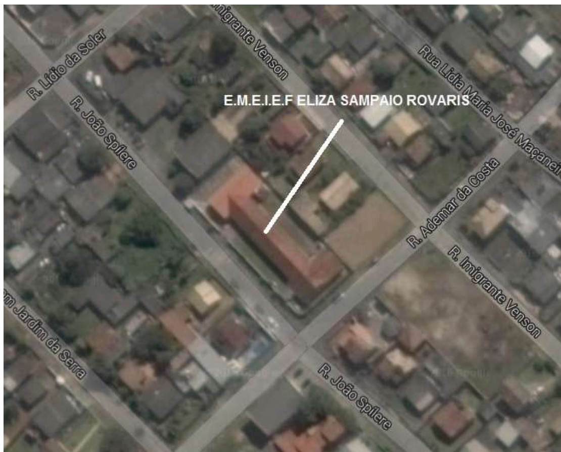
Figura 01: Localização da E.M.E.I.E.F. Eliza Sampaio Rovaris.