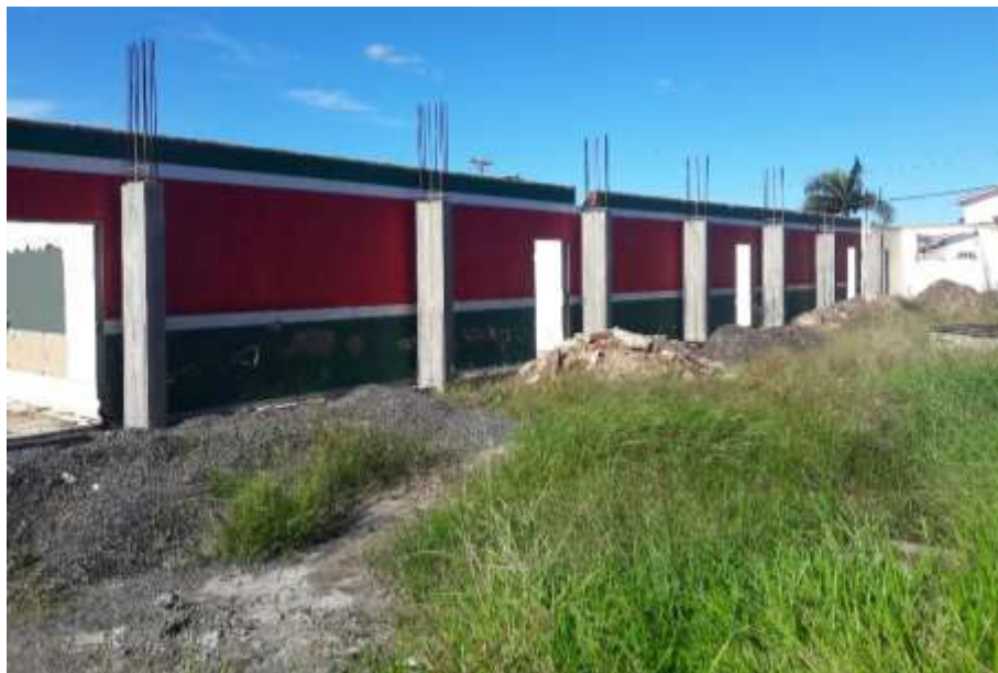
Figura 03: Ferragem exposta e mato alto.