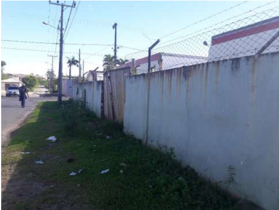
Figura 05: Sujeira ao redor da obra.