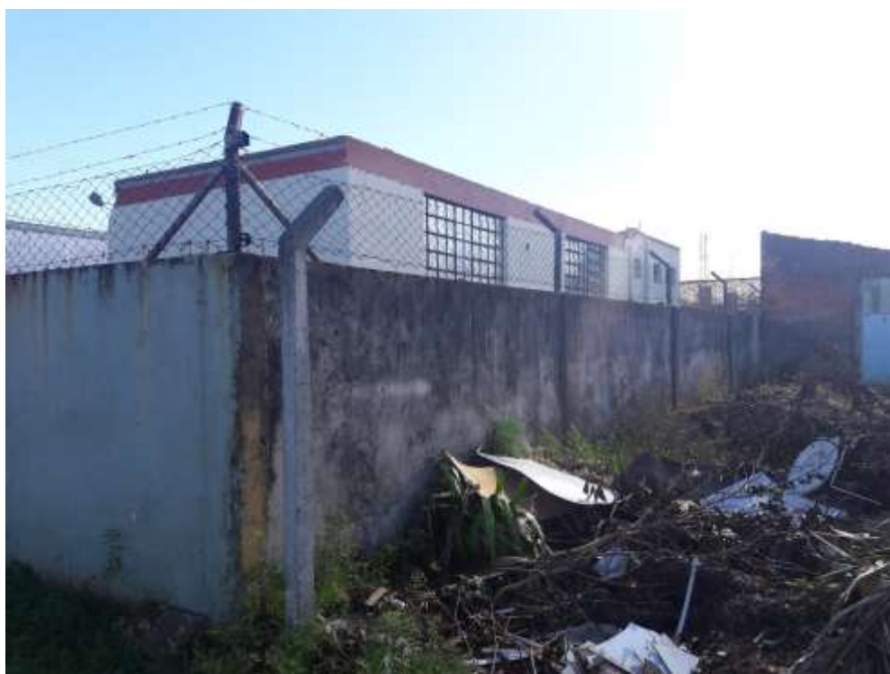
Figura 04: Sujeira acumulada nos fundos da escola.

A parte externa da obra apresenta muito lixo acumulado, principalmente no terreno que faz fundo com a escola. O cuidado com a limpeza tanto com a parte interna como externa é um ponto muito importante a ser cuidado, tanto pela empresa responsável como também pelo próprio município. Isso demonstra um respeito maior com o dinheiro público e valoriza o que foi executado, além de ser um problema para a saúde pública. Sugerimos tomar providencias para resolver esta situação para que assim, a obra esteja apenas paralisada, e não com sinais de abandono absoluto e desrespeito com o dinheiro já investido.