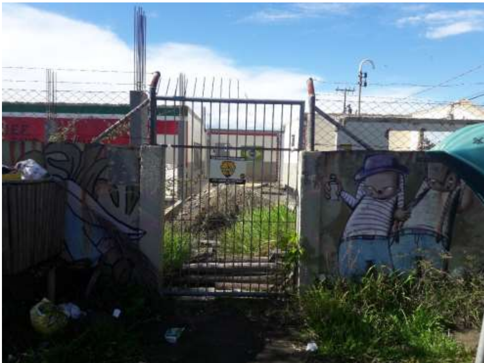
Figura 06: Lixo acumulado e mato alto no portão de entrada.