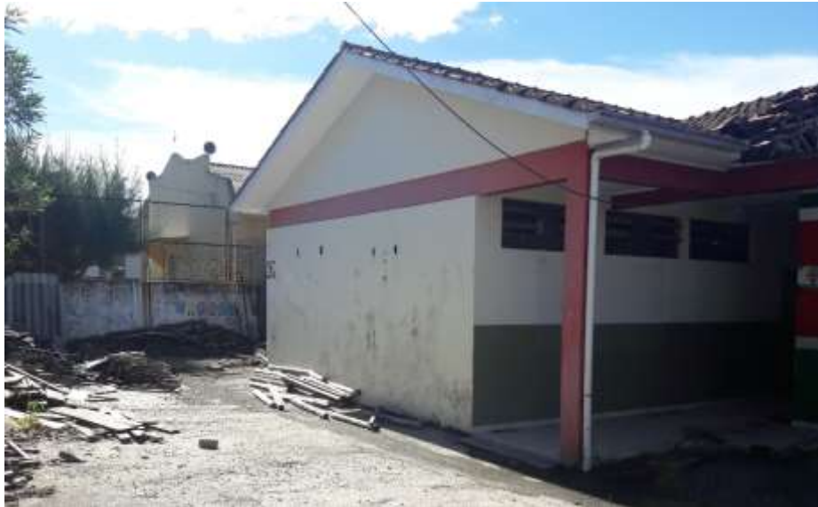
Figura 02: Materiais de construção armazenados incorretamente.

estão sujeitos a intempéries e conseqüentemente patologias geradas assim. Alguns materiais como barras de aço, agregados graúdos e miúdos e entre outros, estão estocados de maneira incorretas, sendo que estes estão apenas soltos pelo terreno da obra sem que estejam protegidos.