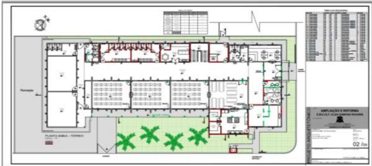
Figura 02: Planta baixa nível térreo.