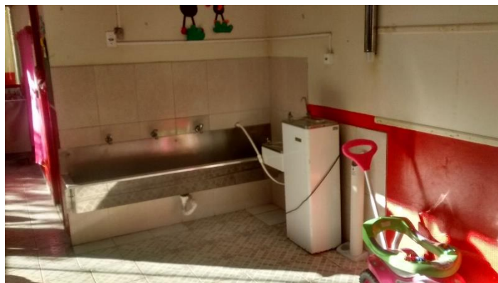
Figura 12: Bebedouros.