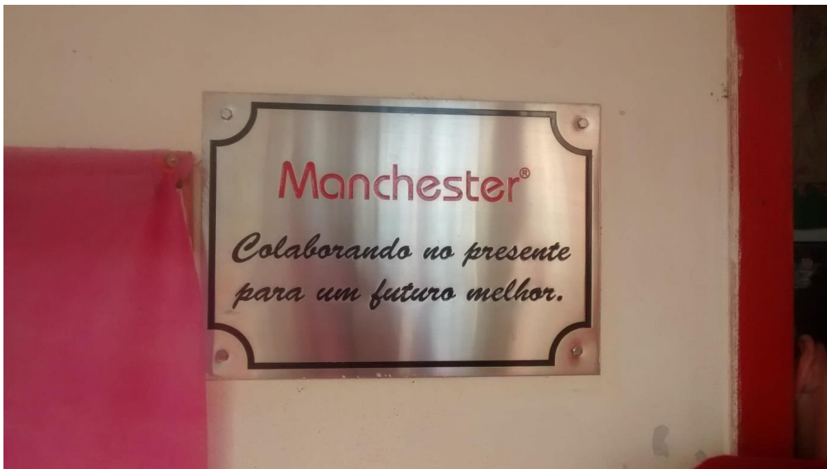
Figura 13: Sala ampliada por ação da iniciativa privada.

Também verificou-se que algumas obras (ampliação e reforma) executadas no prédio e aquisição de equipamentos tiveram a ação da iniciativa privada, por meio da ação de empresas localizadas próximas ao CEIM Demboski.