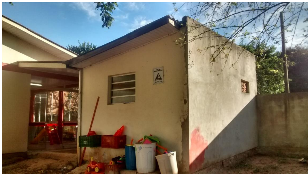
Figura 06: Local a ser demolido com o início das obras.