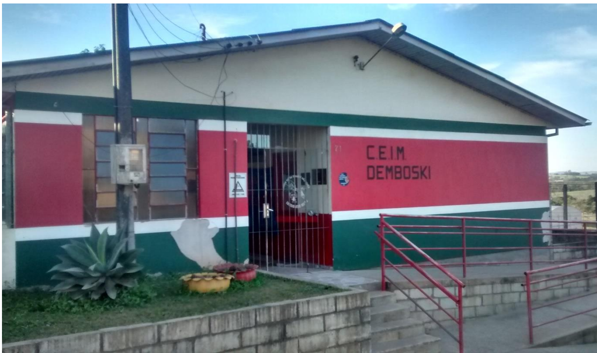
Figura 04: Vista frontal do CEIM Demboski.

Conforme divulgado no Diário Oficial Eletrônico (DOE) do dia 27 de junho de 2016, o contrato foi assinado no dia 08 de junho de 2016, o prazo de execução é de 360 dias e o valor final da obra é de R$ 550.000,00, sendo no final o prédio contemplado com 683,24 m 2 de obras, entre ampliações e adaptações de ambientes.