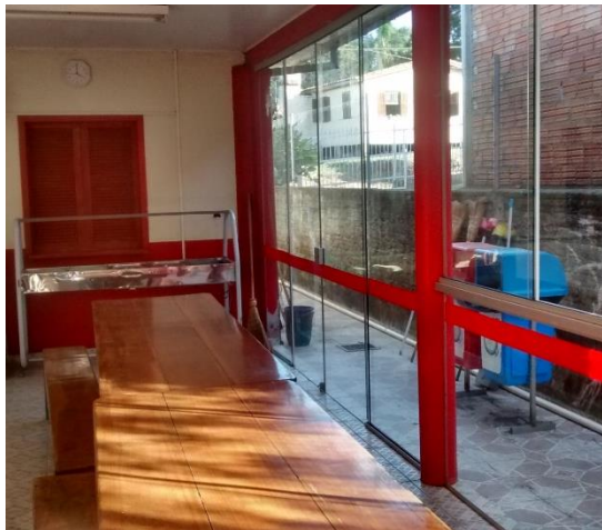
Figura 11: Estrutura atual do refeitório.

A ampliação do local é necessária pois conforme o que foi informado e evidenciado o local apresenta algumas deficiências, por exemplo a estrutura física atualmente é pequena e não comporta o grande número de alunos, também não existe um local adequado para o armazenamento dos alimentos e outros materiais, além do mais a ampliação é necessária haja vista que existe uma grande demanda por vagas no local.