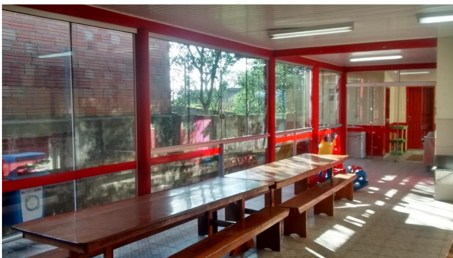
Figura 08: Instalações do atual refeitório.