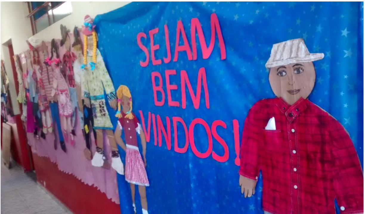
Figura 10: Acesso aos ambientes do CEIM Demboski.