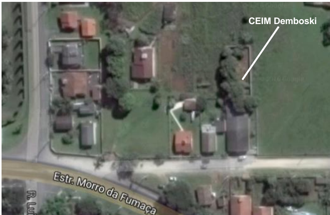
Figura 01: Localização do CEIM Demboski.

A obra acompanhada será executada no CEIM Demboski, localizado na Rua São Cristóvão, Bairro Demboski em Criciúma – SC.