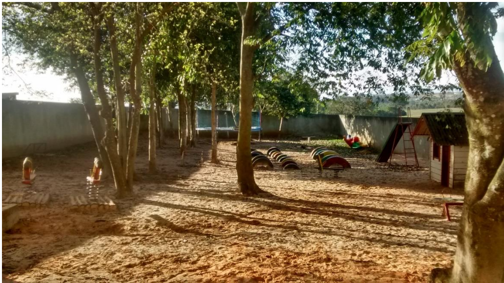
Figura 05: Local aonde será executada a ampliação do prédio.

A visita durou cerca de 1 (uma) hora e durante a ocorrência desta foram feitas algumas constatações importantes, conforme descrito nos relatos a seguir. Ao chegar no local a equipe pode constatar que a obra não havia iniciado, mesmo com o processo licitatório concluído e a empresa responsável pela execução da obra contratada.