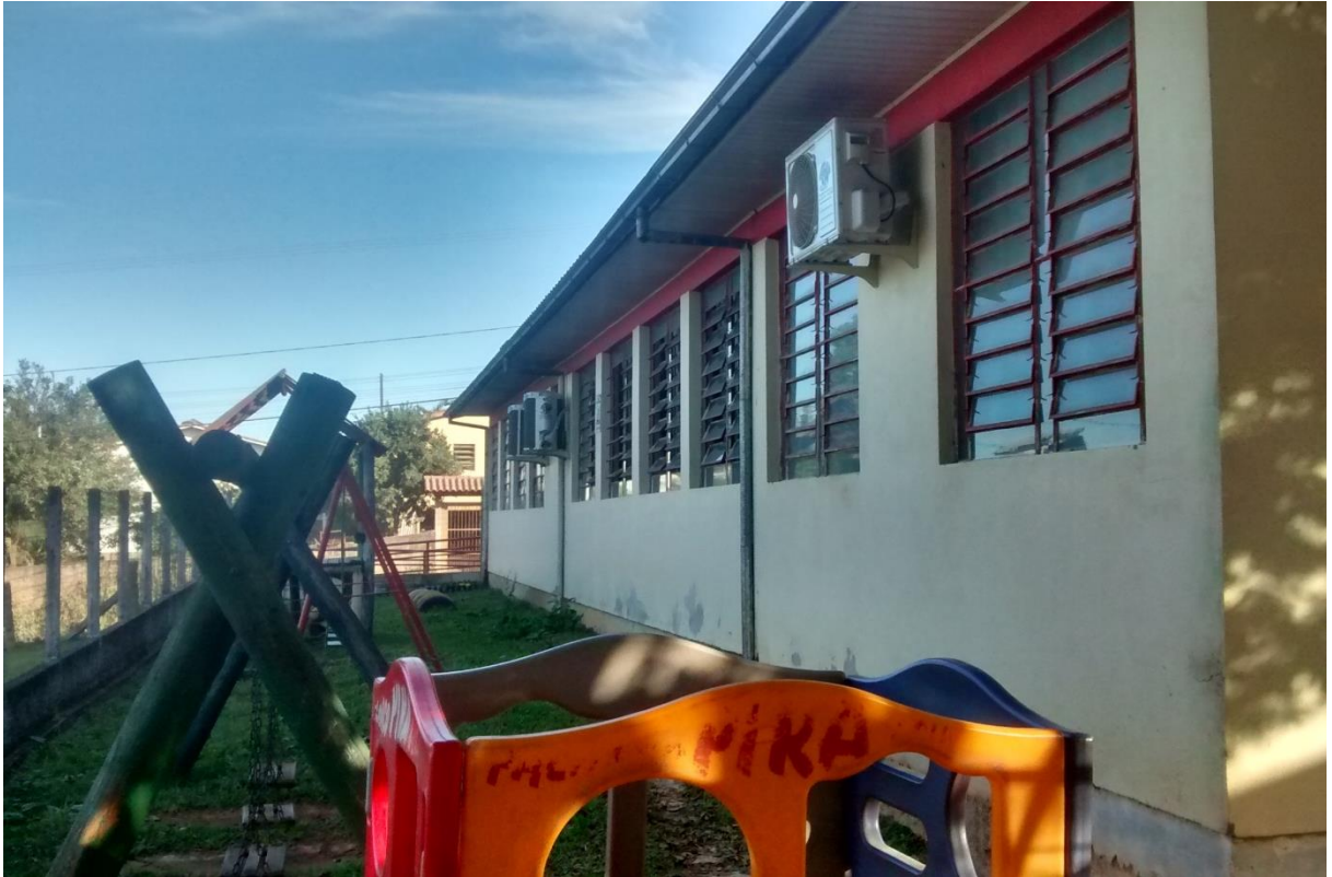
Figura 09: Vista da lateral do prédio.