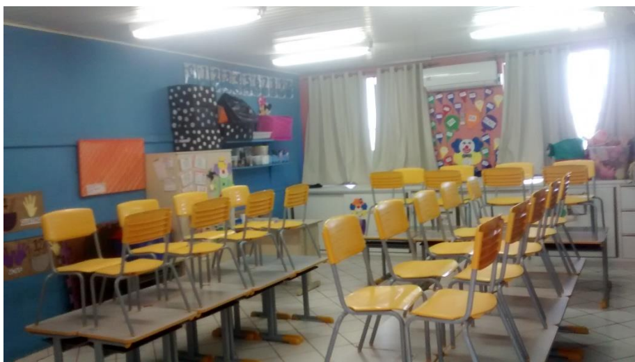
Figura 07: Sala de aula atualmente.

Conforme conversas com o pessoal do CEIM Demboski a obra não teve início pois a verba destinada a execução dos trabalhos teve que ser utilizada para que o município saldasse as dívidas com o Hospital São José, ainda segundo os mesmos isto ocorreu por ordem judicial, entretanto a equipe do Observatório Social de Criciúma ressalta que esta informação não é oficial do município, portanto deve-se avaliar juntamente com a Secretaria Municipal do Sistema de Infraestrutura, Planejamento e Mobilidade Urbana a real situação pela a qual a obra não teve início.