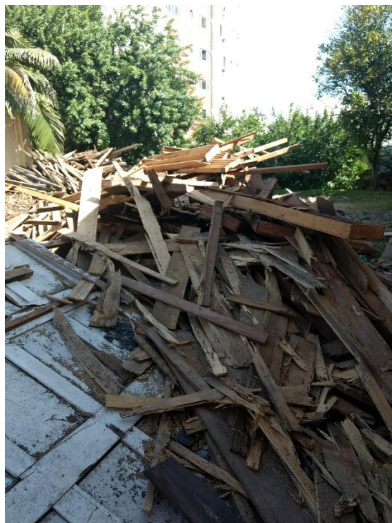
Figura 14: Resíduos Originados Pela Obra.