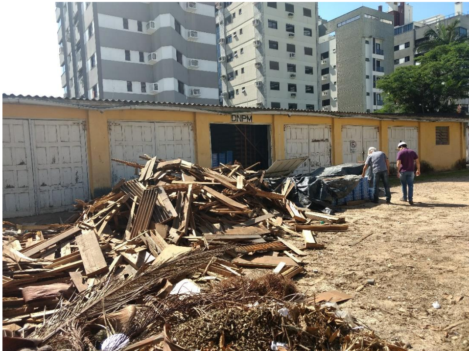
Figura 13: Resíduos Originados Pela Obra.