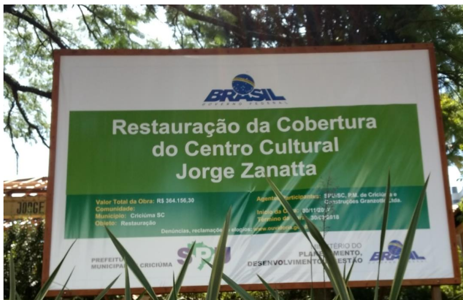
Figura 4: Placa com informações do lote 1.