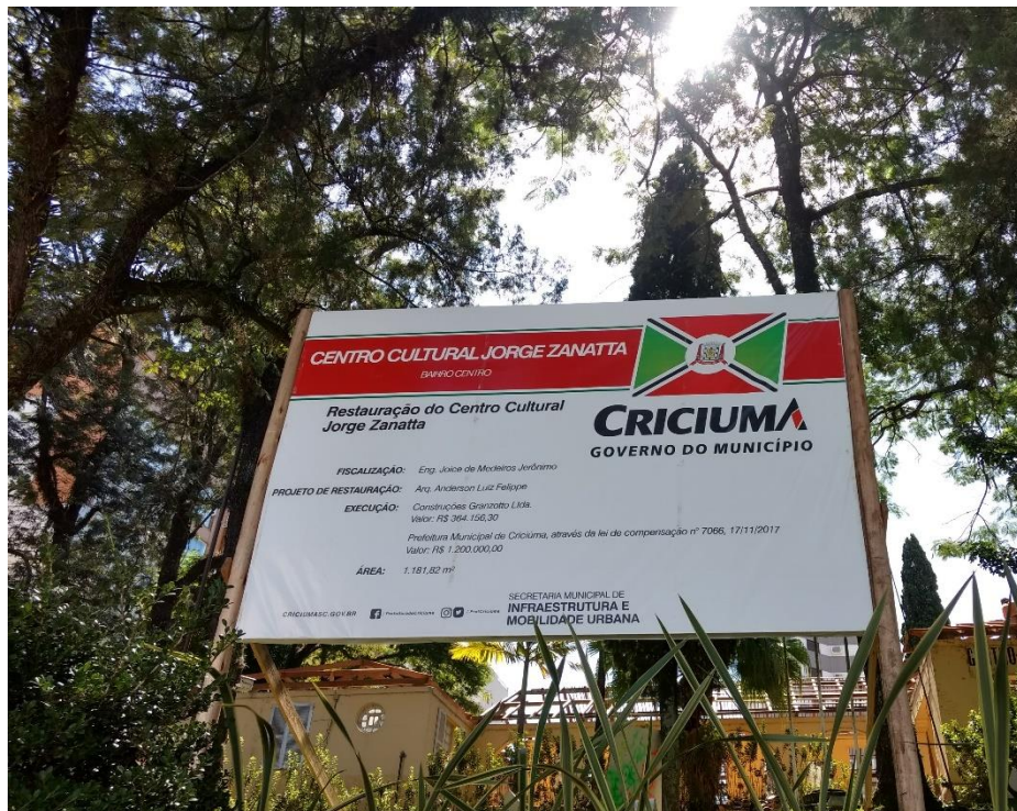
Figura 3: Placa contendo informações da obra.

A obra está com toda sinalização correta, contendo bem em frente a placa da obra, com informações da empresa e valor contratado para a obra.