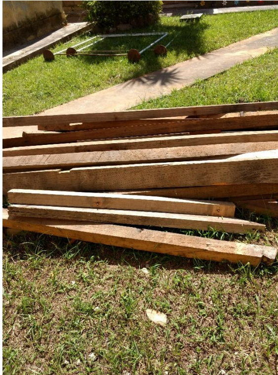
Figura 9: Madeiras da antiga estrutura. (Fonte: Dos Autores 2018)

Outro ponto analisado pela equipe foi em relação a umidade na parede, a mesma apresentava em estágio avançado, vale lembrar que não havia projeto de impermeabilização, mas pede-se que nesta obra de reforma e restauração haja um cuidado especial.