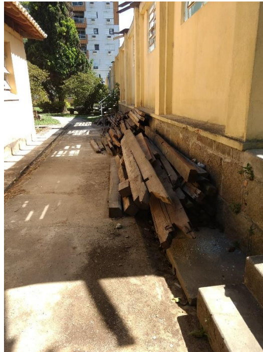
Figura 8: Madeiras de lei da antiga cobertura.

Uma questão levantada pela equipe durante a visita foi em relação as antigas madeiras da armadura, onde algumas foram reutilizadas, mas muitas foram jogadas fora, vale ressaltar que as madeiras que compunham a antiga armadura eram de lei, madeiras de ótima qualidade, que apenas haviam sofrido desgaste e perda de resistência devido ao tempo, mas essas mesmas madeiras podem ser reutilizadas para se fazer ripas.