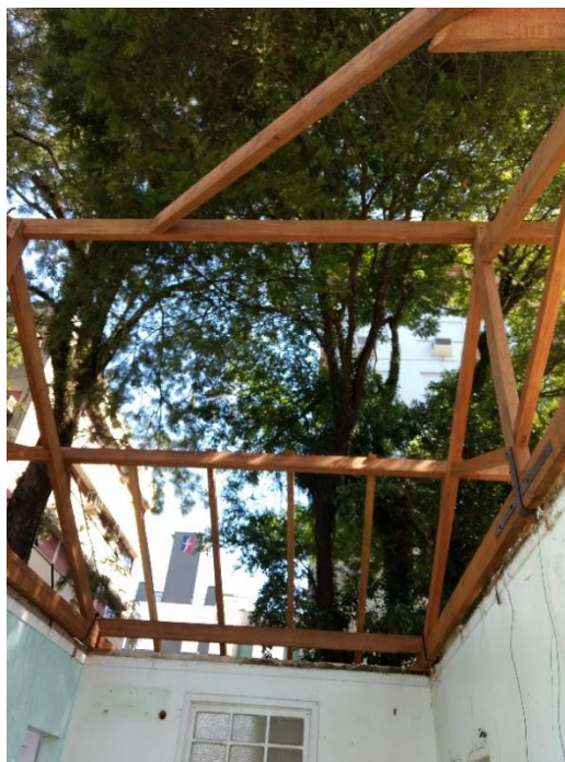
Figura 7: Galhos de árvore secos.

Foi observado pela equipe um descuido quanto a poda das árvores, as quais deveriam ser podadas antes de ser executado o serviço de cobertura. As mesmas apresentam muitos galhos secos, que ao cair podem danificar a estrutura da cobertura e o telhado.