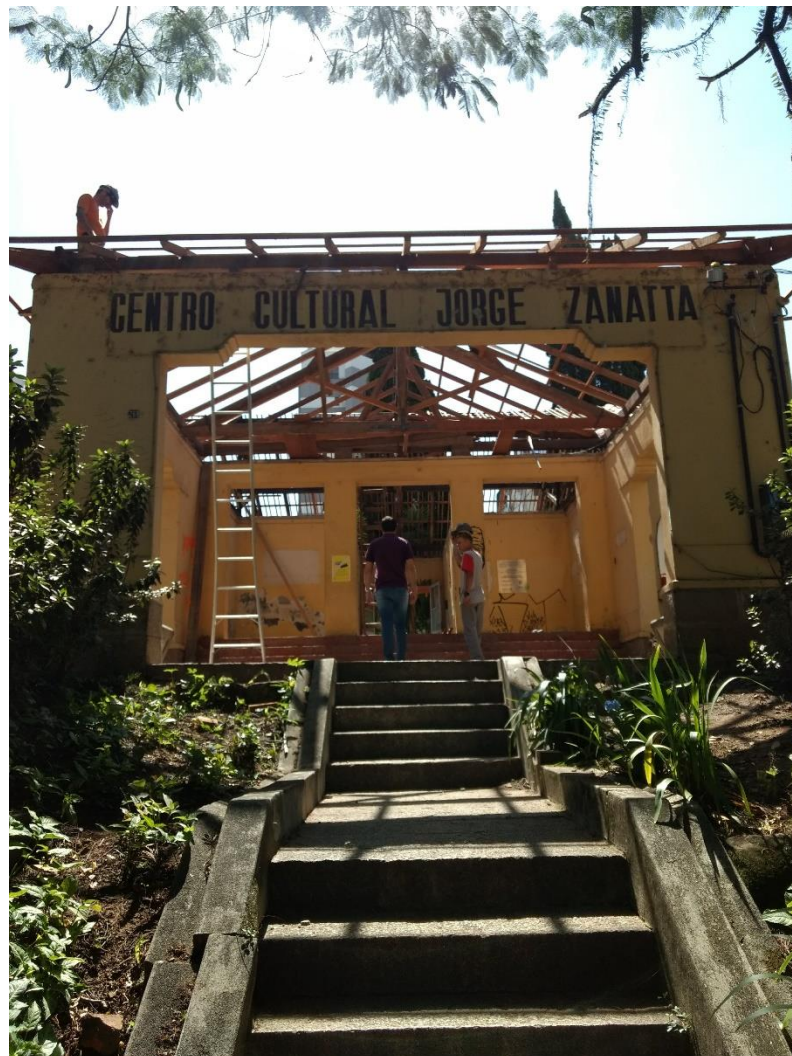
Figura 2: Vista frontal do Centro Cultural.

A empresa Construtora Granzotto Ltda, vencedora do processo licitatório da SPU/SC, será responsável pela reforma da cobertura do prédio, já as demais melhorias, estarão sob a responsabilidade da Empresa Expresso Coletivo Forquilha Ltda.