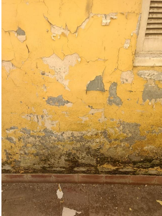
Figura 10: Umidade nas paredes do Centro Cultural.