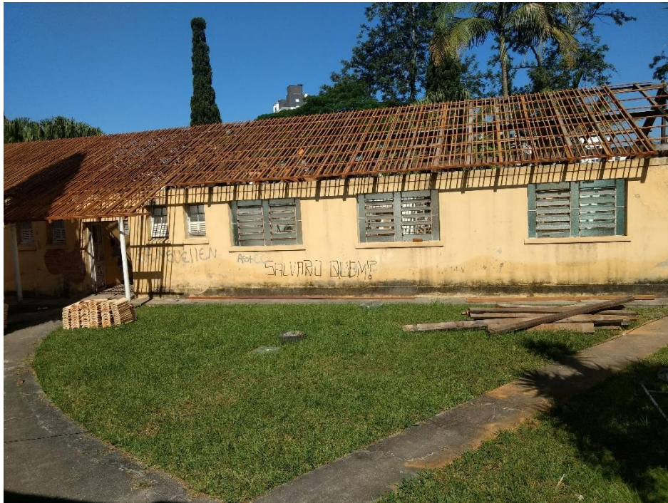
Figura 5: Armação de madeira instalada.

No dia visitado a obra havia iniciado há 4 meses, foram retiradas todas as telhas e armações da cobertura, prejudicadas pelo fogo e pela umidade. No momento da visita, foi possível analisar a execução das armaduras. A madeira utilizada era de angelim, uma madeira ideal para este tipo de serviço. Ao verificar as armaduras do telhado pode-se notar que algumas madeiras e ferragens de emenda foram reutilizadas.