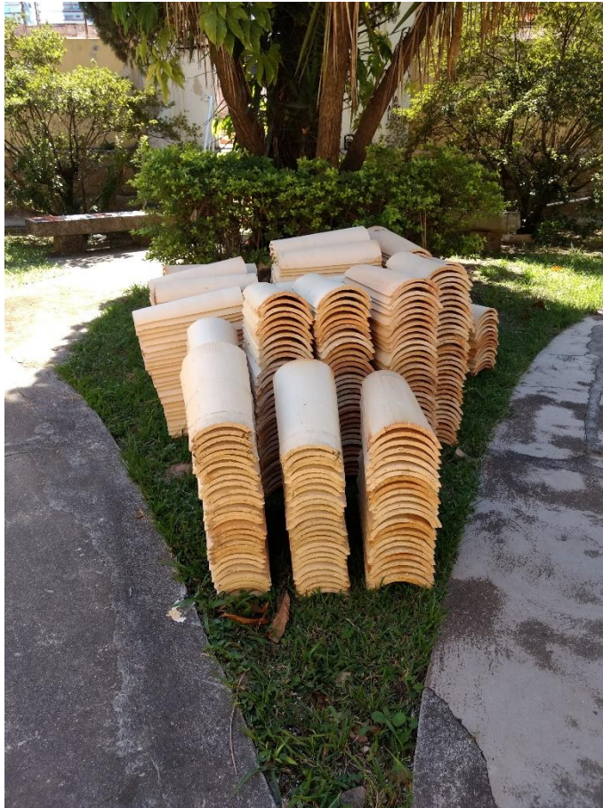
Figura 12: Telhas da nova cobertura.

Chamamos a atenção quanto ao armazenamento de telhas o qual, deve se fazer sem contato direto com o solo, em posição vertical e utilizar um material do tipo lona para estender sob elas.