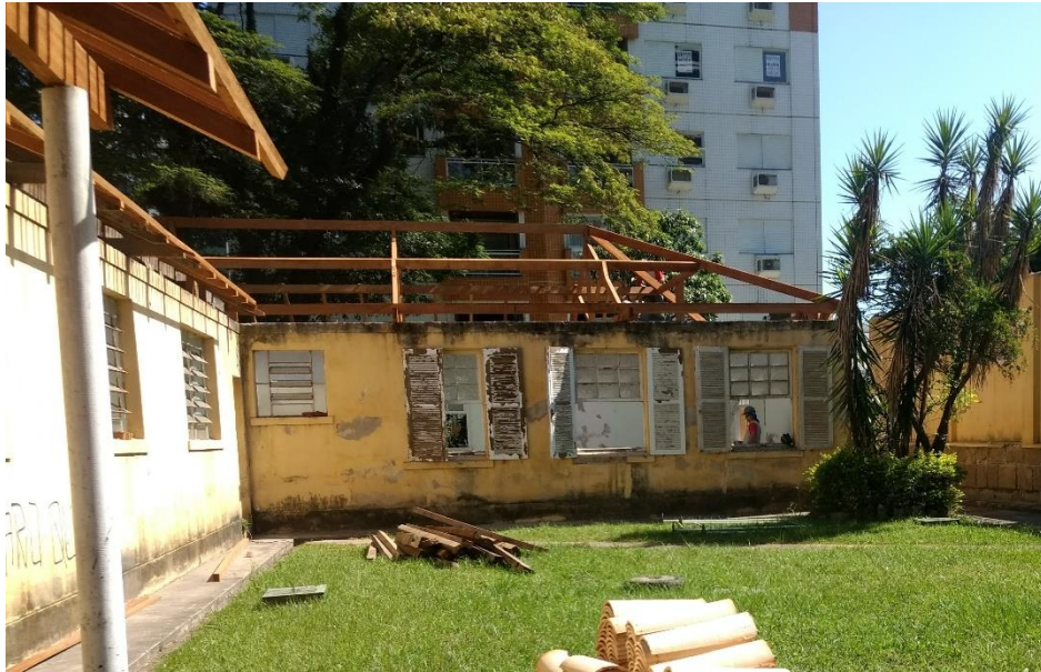
Figura 6: Armação de madeira no início da instalação.

Foi observado pela equipe um descuido quanto a poda das árvores, as quais deveriam ser podadas antes de ser executado o serviço de cobertura. As mesmas apresentam muitos galhos secos, que ao cair podem danificar a estrutura da cobertura e o telhado.