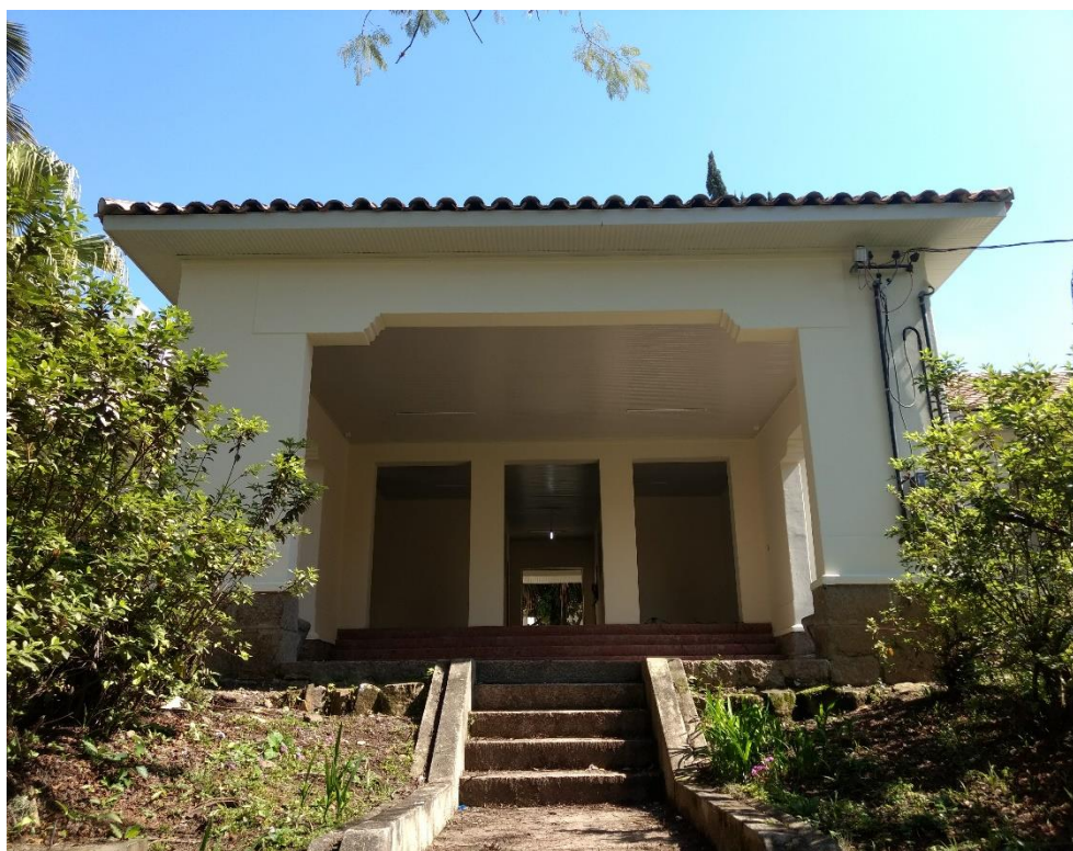
Figura 5: Vista frontal do prédio.

A visita durou cerca de trinta minutos, durante a visita a equipe pode observar que a obra apresentou evolução em relação à última realizada. Houve um grande avanço em relação a todos os serviços, foram concluídos o telhado, forro, pode-se observar que todo prédio estava em fase de acabamento.