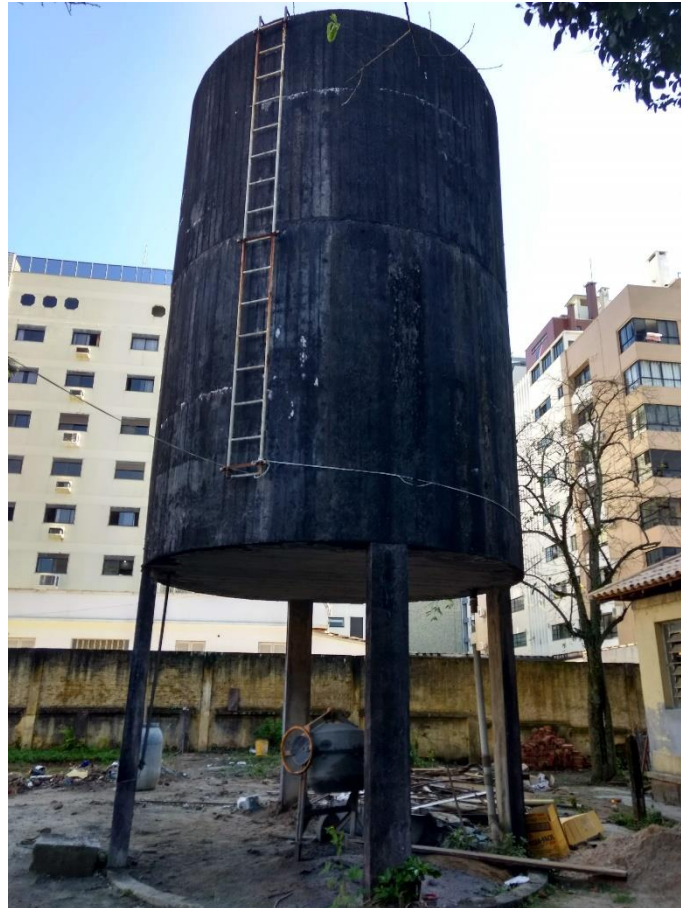
Figura 10: Caixa d'água.

Foi informado a equipe que na licitação está previsto a recuperação da caixa d'água e que está não será mais utilizada, também haverá uma reforma em um poço que fica na parte lateral do Centro Cultural, ambos são patrimônios que serão conservados.