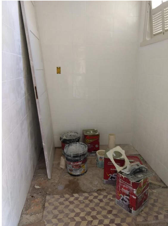
Figura 8: Banheiro em etapa de acabamento.

Foi iniciado a reforma da construção que fica aos fundos da casa da cultura, onde nessa já foi feito toda a recuperação do telhado e também foi reparado alguns pontos da parede externa com massa corrida.