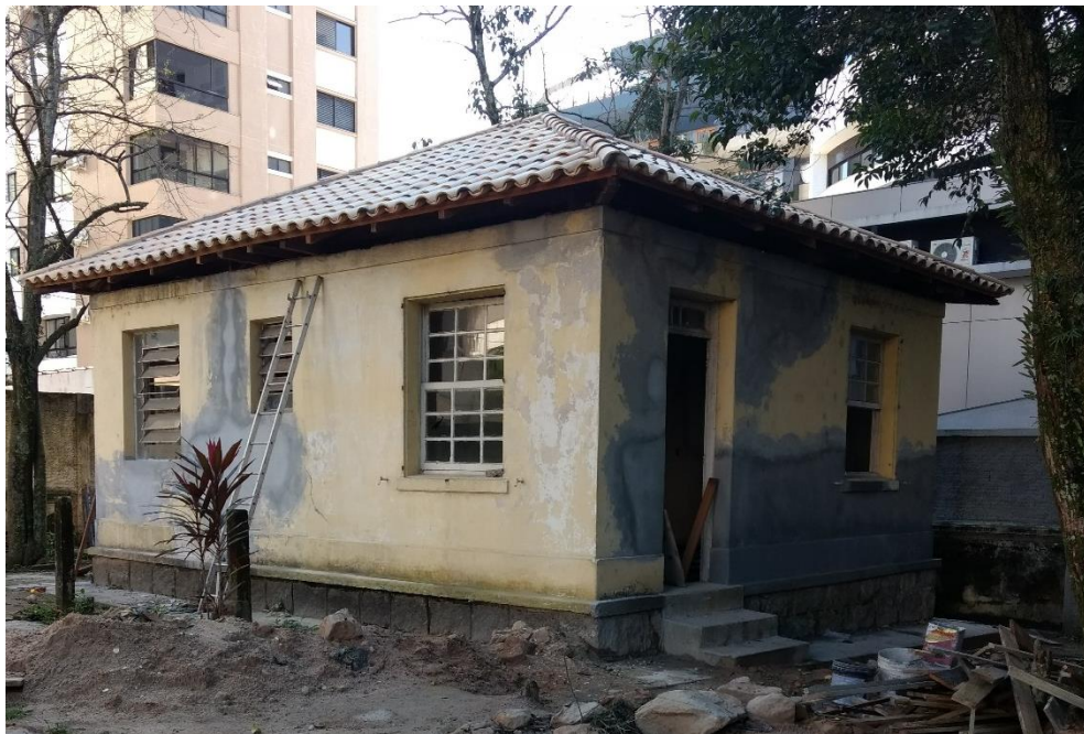
Figura 9: Construção anexa ao Centro Cultural.

Foi iniciado a reforma da construção que fica aos fundos da casa da cultura, onde nessa já foi feito toda a recuperação do telhado e também foi reparado alguns pontos da parede externa com massa corrida.