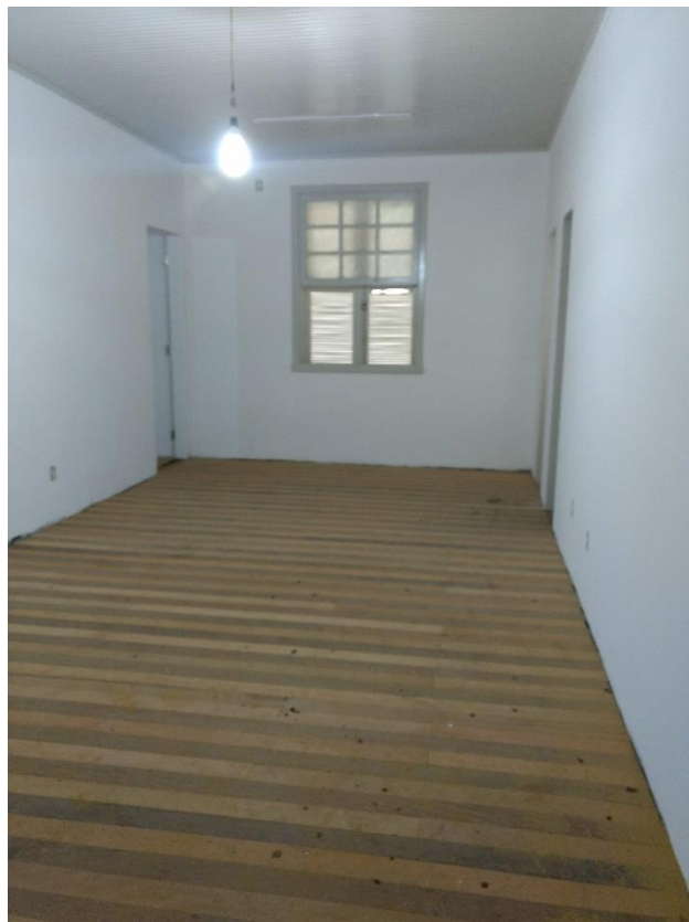
Figura 7: Sala em etapa de acabamento. (Fonte: Dos Autores 2018)