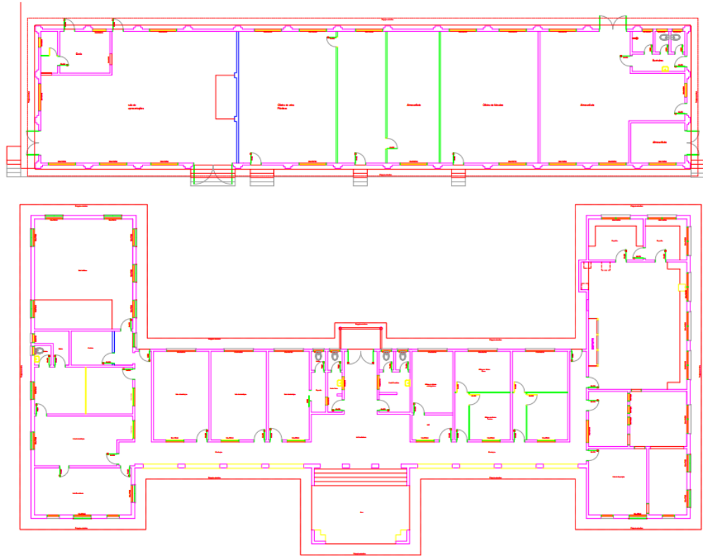
Figura 2: Planta baixa.