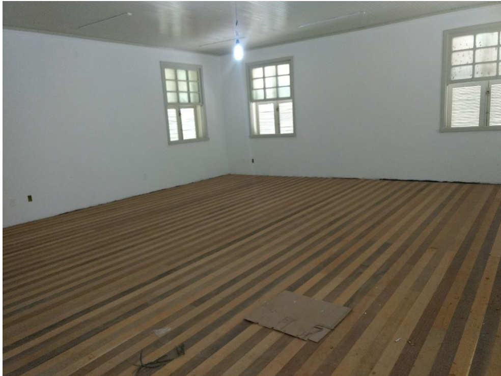
Figura 6: Assoalho de madeira em etapa de finalização.