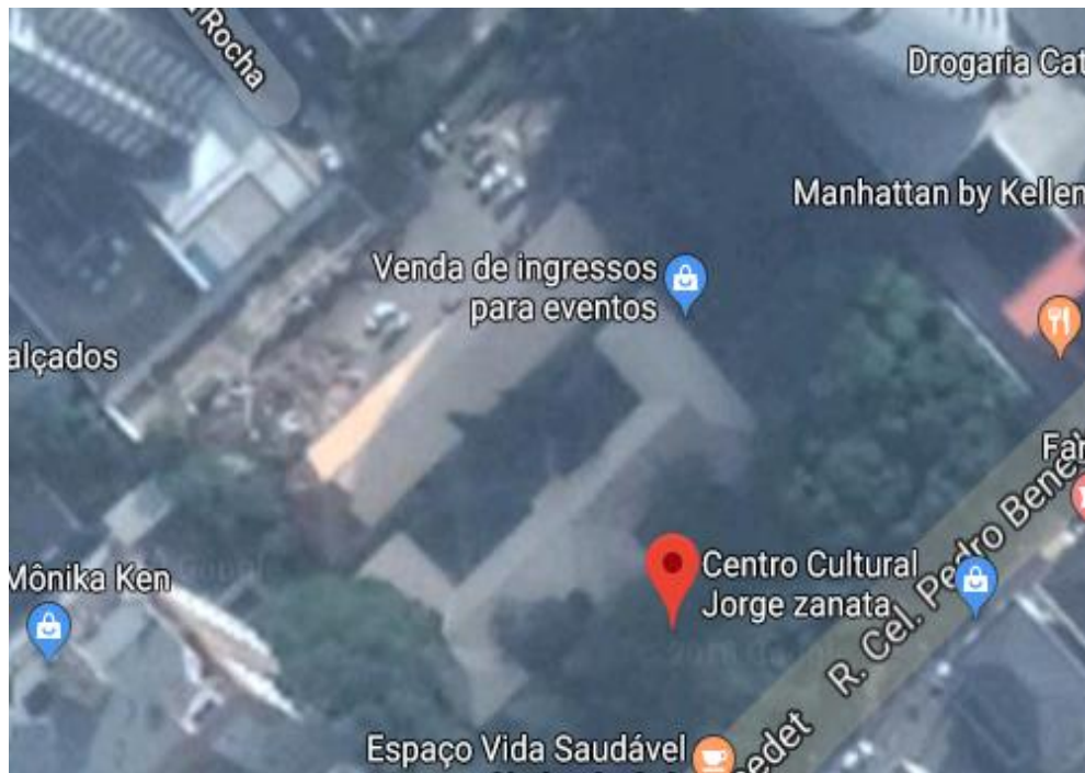
Figura 1: Localização do Centro Cultural Jorge Zanatta.

A obra acompanhada está sendo executada no Centro Cultural Jorge Zanatta, localizado na Rua Coronel Pedro Benedet, no Bairro Centro do Município de Criciúma-SC.