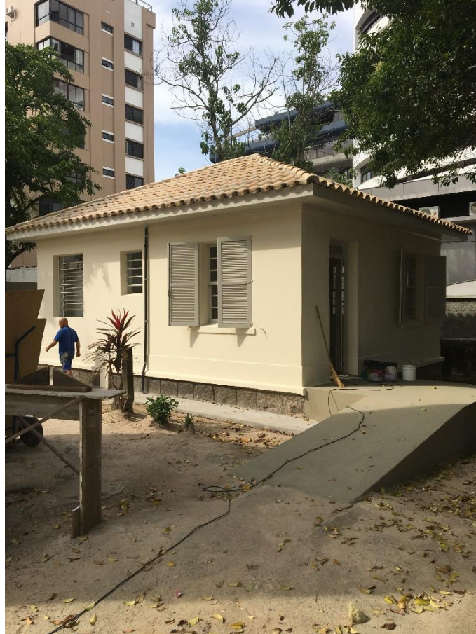
Figura 12: Reforma em estágio final.

Foi iniciado a reforma da construção que fica aos fundos da casa da cultura, onde está no dia visitado apresentava-se em estágio avançado.