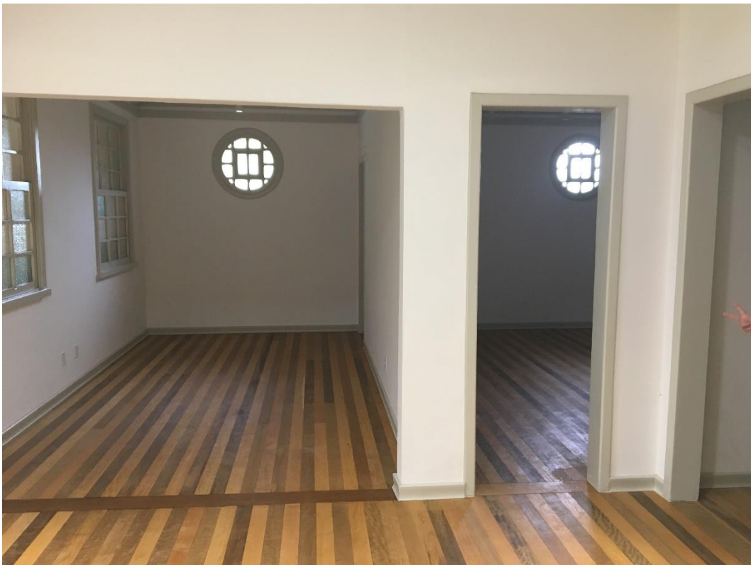
Figura 7: Vista interna do Centro Cultural.