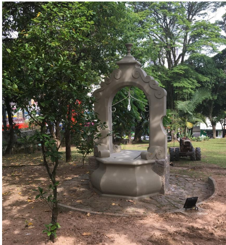
Figura 9: Poço.