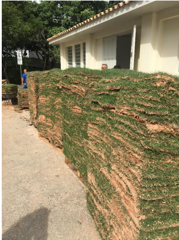
Figura 10: Materiais para o paisagismo.