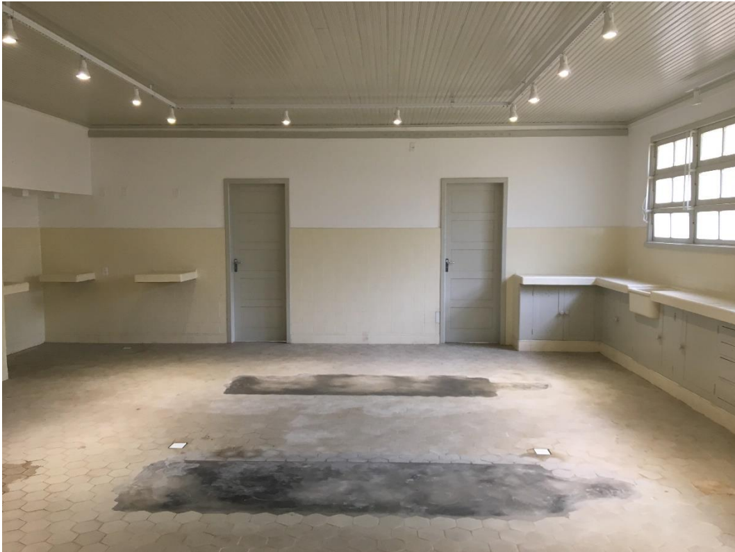
Figura 6: Vista interna do Centro Cultural.