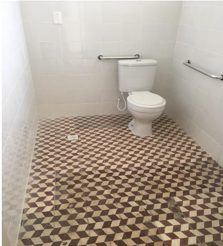
Figura 8: Banheiro.