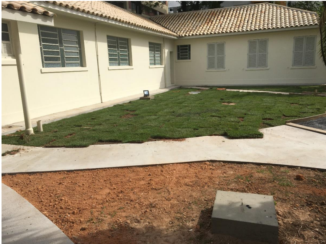
Figura 11: Execução do paisagismo.