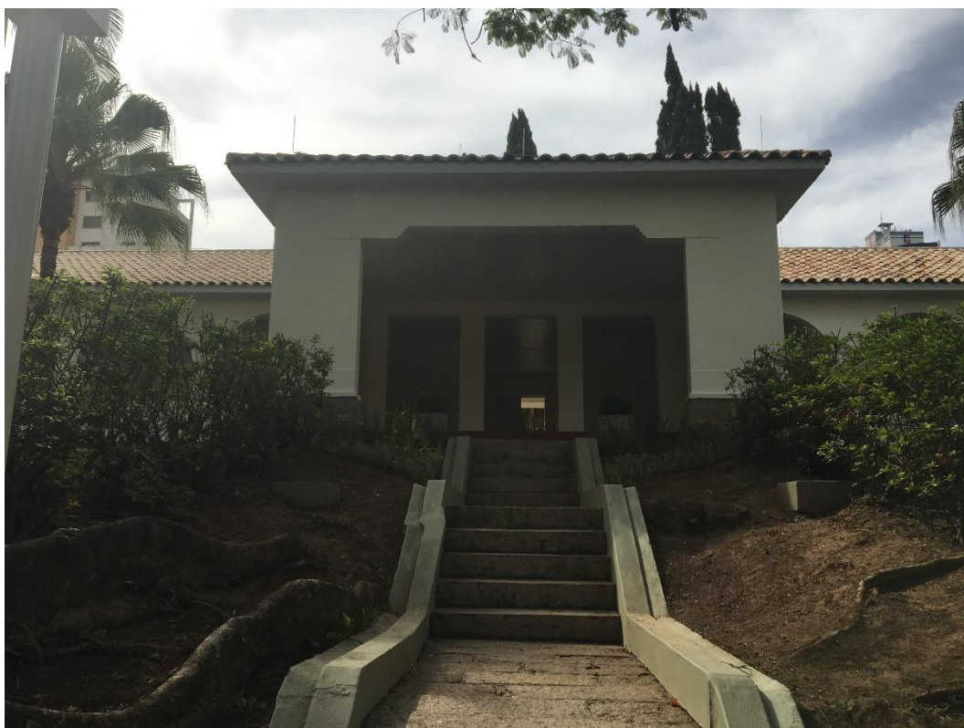
Figura 5: Vista frontal do prédio. (Fonte: Dos Autores 2018)

A visita durou cerca de uma hora, durante a visita a equipe pode observar que a obra está em fase de acabamento, faltando poucos itens para sua conclusão.