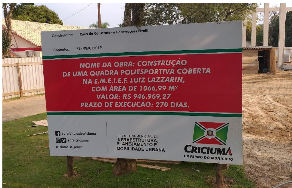
Figura 4: Placa de localização da obra.

No dia 10 de setembro do ano de 2019, foi realizada a 1ª visita a obra da Quadra Poliesportiva Coberta na escola E.M.E.I.E.F. Luiz Lazzarin, a fim de verificar as reais condições referente a sua construção. A visita durou cerca de 30 (trinta) minutos.