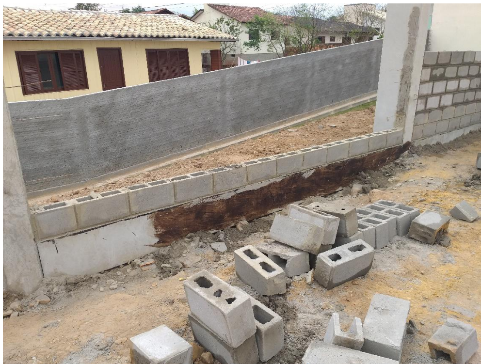
Figura 14: Parede em construção. (Fonte: Dos Autores 2019)