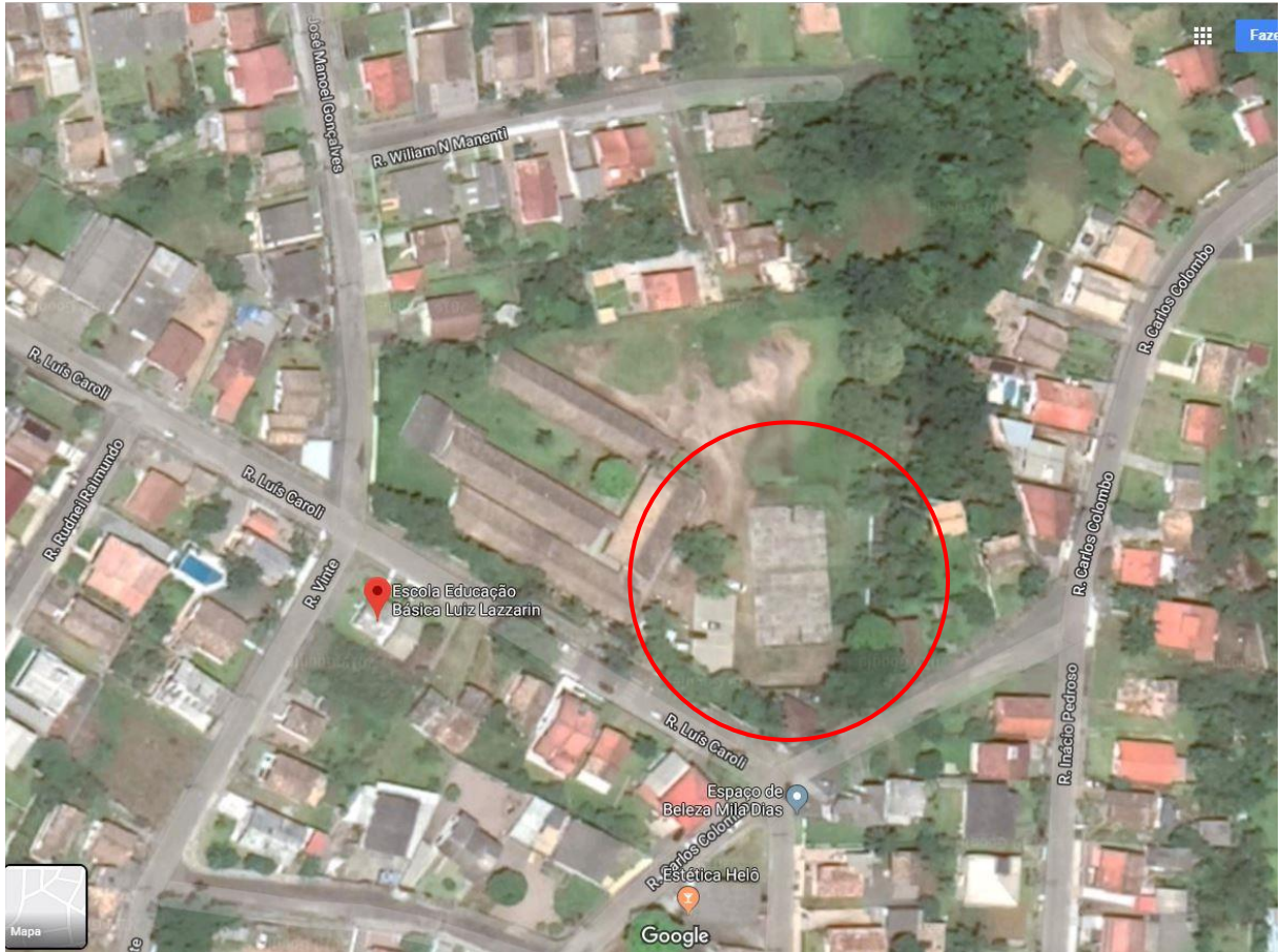
Figura 1: Localização da Quadra Poliesportiva.

A obra acompanhada é a Quadra Poliesportiva Coberta na E.M.E.I.E.F. Luiz Lazzarin, localizada na Rua Luís Caroli, Bairro Vila Isabel – Distrito de Rio Maina - em Criciúma – SC.