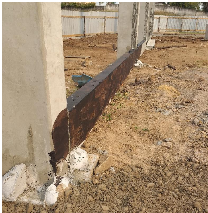
Figura 11: Impermeabilização na viga.