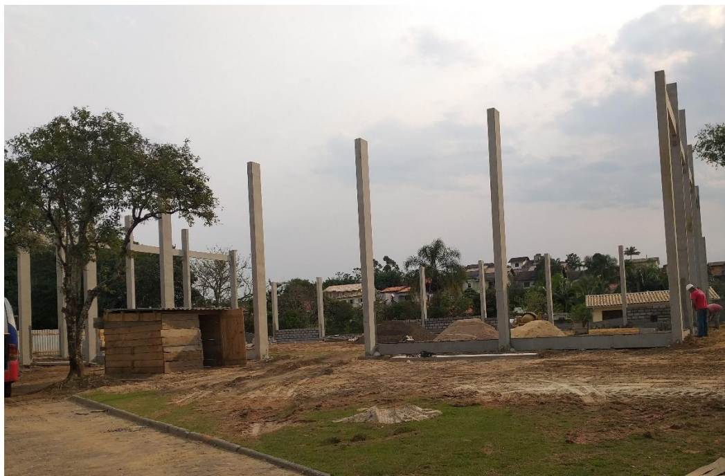
Figura 6: Fachada lateral.

Observou-se que os materiais na obra estavam devidamente armazenados. As argamassas encontravam-se em uma instalação de depósito temporária e em cima de paletes assim como os blocos de concreto.