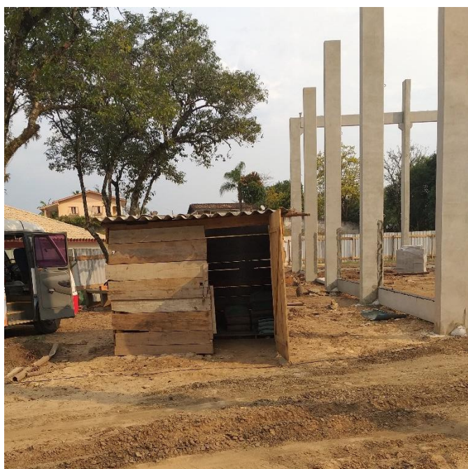
Figura 7: Depósito provisório.

Observou-se que os materiais na obra estavam devidamente armazenados. As argamassas encontravam-se em uma instalação de depósito temporária e em cima de paletes assim como os blocos de concreto.