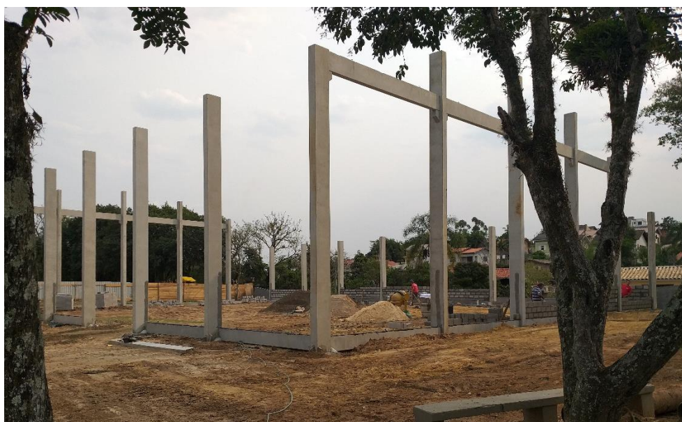
Figura 5: Fachada frontal da obra.