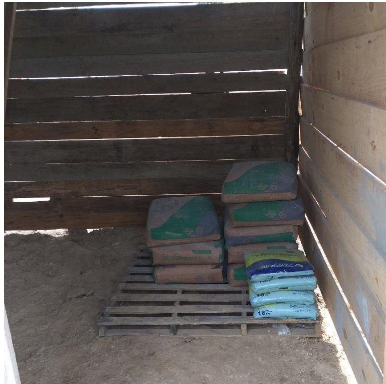
Figura 8: Argamassa armazenada corretamente.