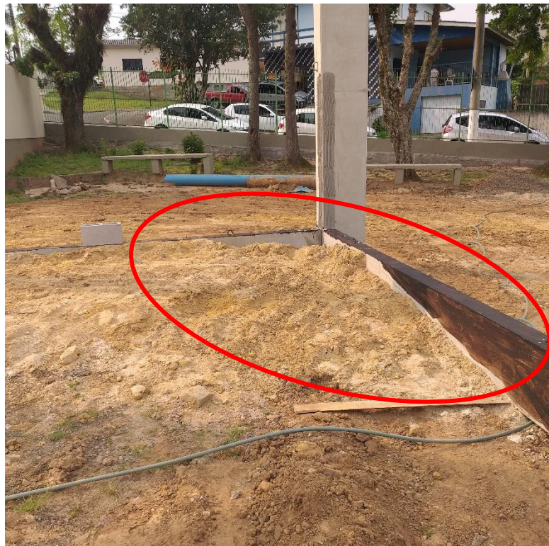
Figura 13: Impermeabilização incompleta.