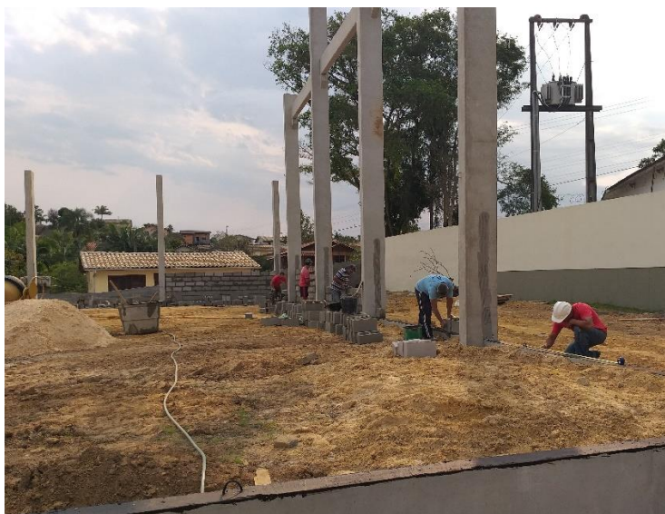
Figura 10: Trabalhadores.

No momento da visita haviam diversos trabalhadores no local executando as paredes do ginásio e foi possível notar que a estrutura pré-moldada estava concluída. Além disso, estavam realizando a impermeabilização da construção com pintura asfáltica, como consta no memorial descritivo, porém, em alguns trechos notou-se que a impermeabilização não havia sido realizada devido a presença de areia sobrepondo as vigas.