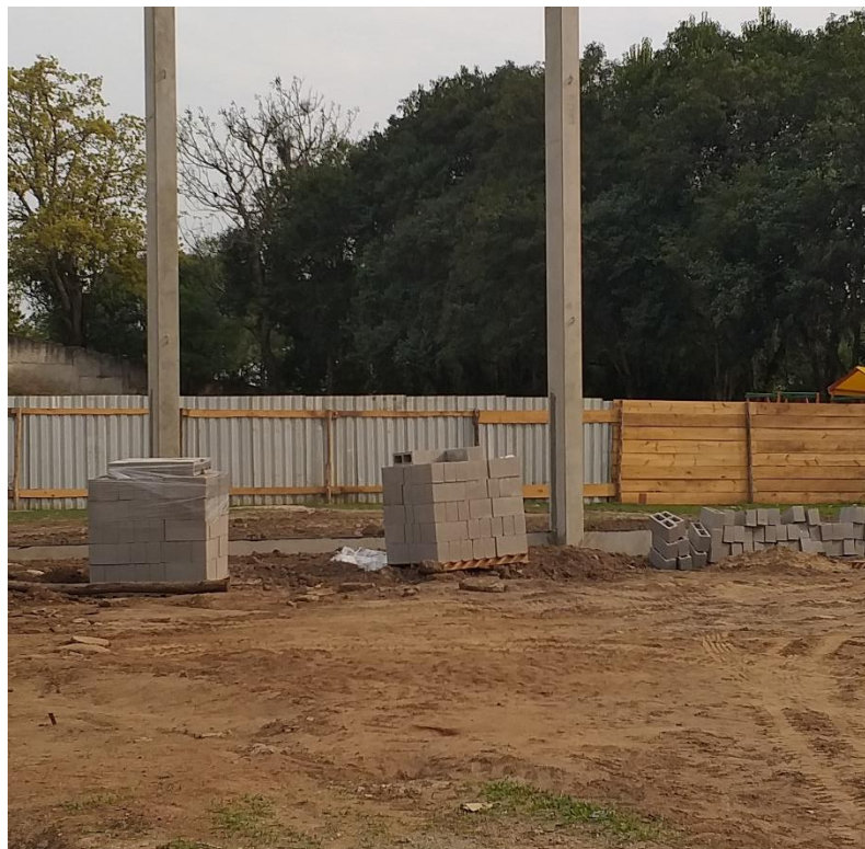
Figura 9: Blocos de concreto armazenados corretamente.