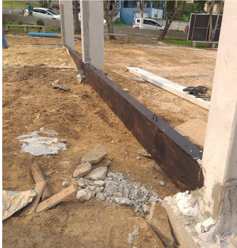
Figura 12: Impermeabilização na viga.