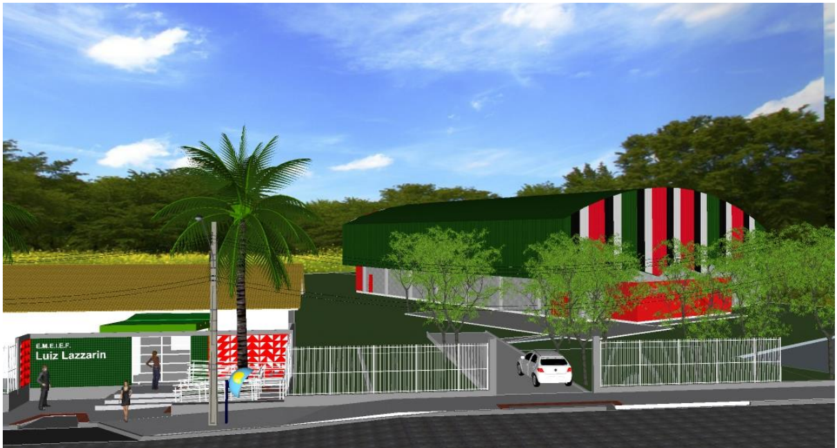
Figura 2: Fachada da Quadra Poliesportiva.