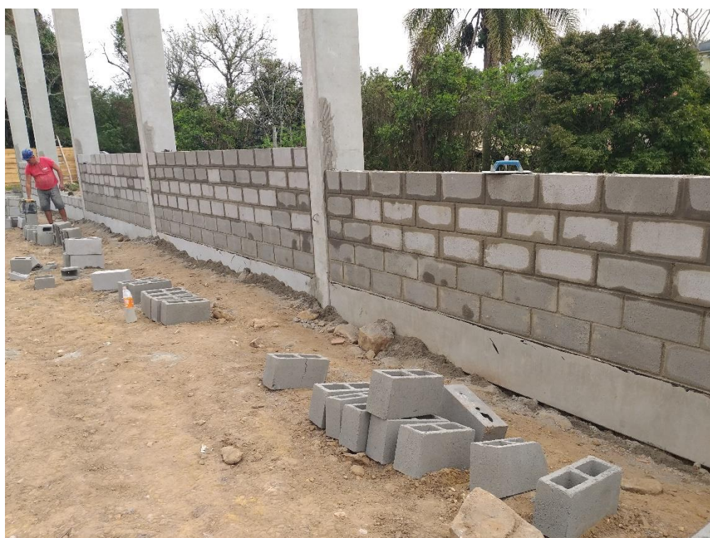
Figura 15: Parede em construção.