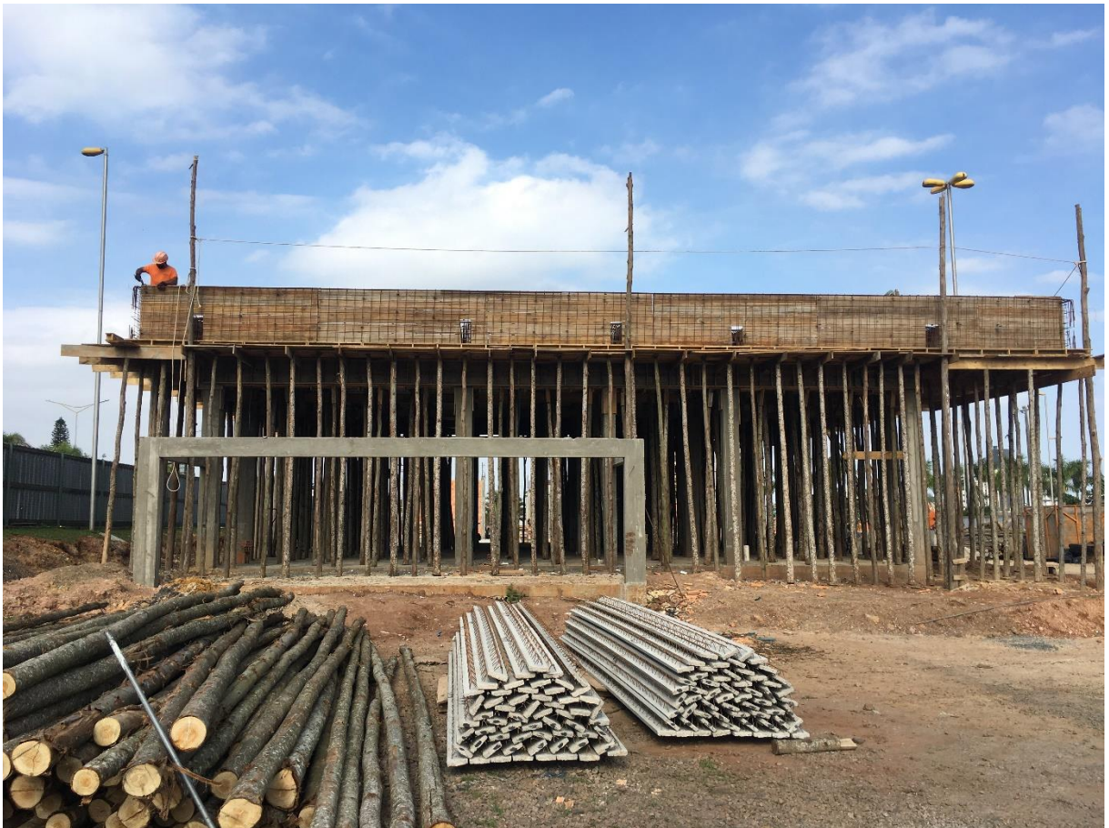
Figura 6: Fachada Leste em construção.