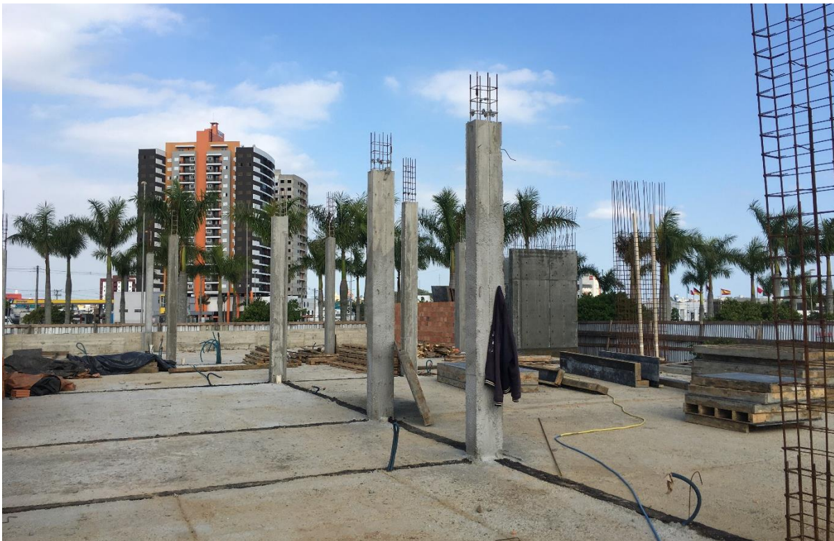
Figura 11: Pilares do salão de festas. (Fonte: Dos Autores 2020).