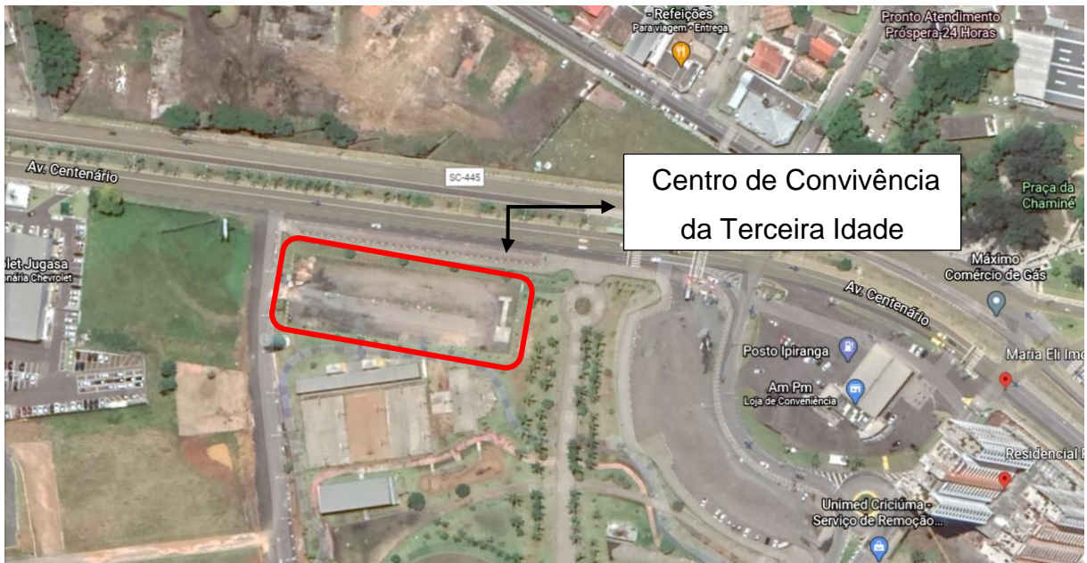
Figura 1: Localização do Centro do Idoso. (Fonte: Google Maps 2020).

A obra acompanhada a construção da edificação do prédio do Centro de Convivência da Terceira Idade (Centro do Idoso), localizado no Parque das Nações, Avenida Centenário, Próspera, Criciúma/SC, com 1.546,21m 2 de área.