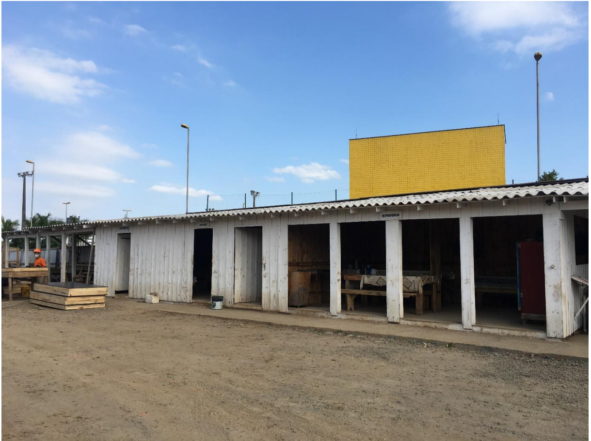
Figura 15: Depósito do canteiro de obra.