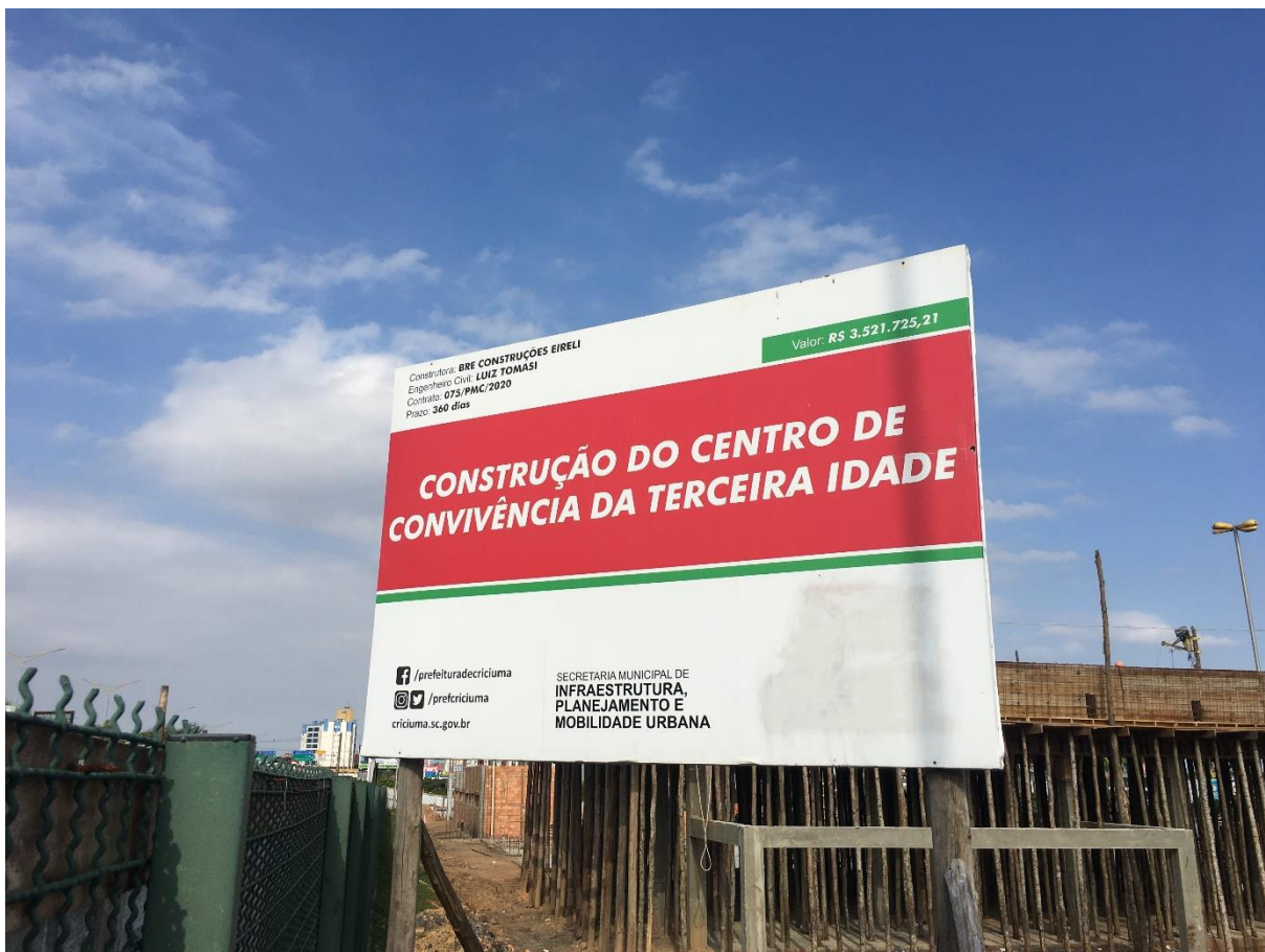
Figura 4: Placa de Identificação da obra.

No dia 22 de setembro de 2020, foi realizada a 1ª visita a obra de construção do Centro de Convivência da Terceira Idade, a fim de verificar as reais condições referente a sua construção. A visita durou cerca de 1 (uma) hora.