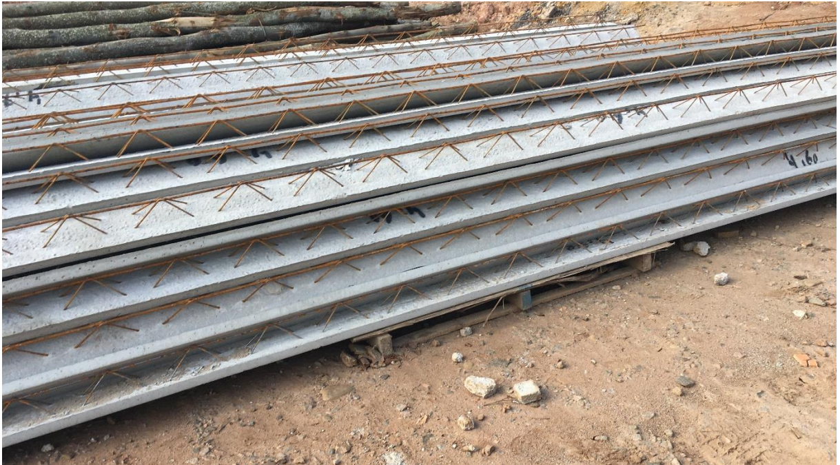
Figura 8: Material armazenado sobre palet.