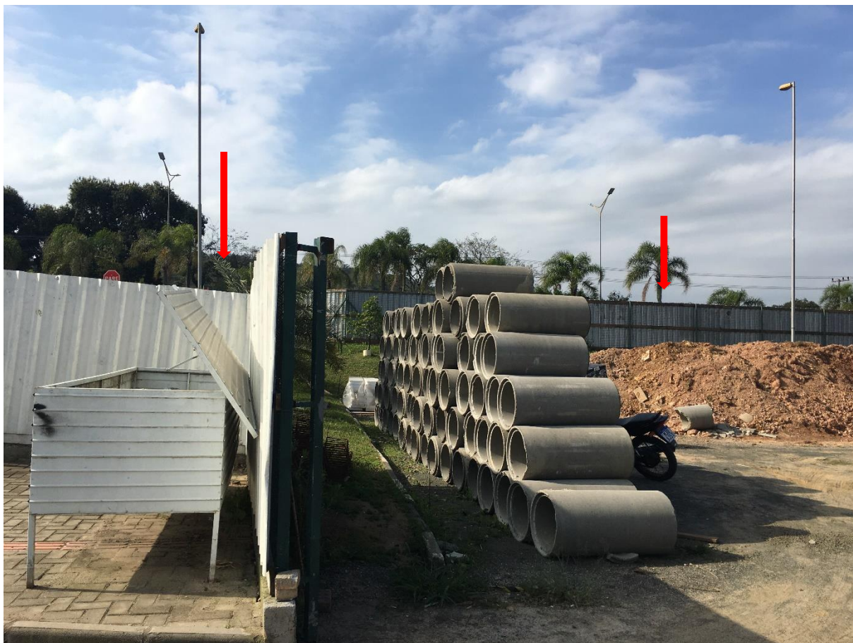
Figura 14: Tapume em telha metálica. (Fonte: Dos Autores 2020).

1.3 – Execução de depósito em canteiro de obra em chapa de madeira compensada, não incluso mobiliário.