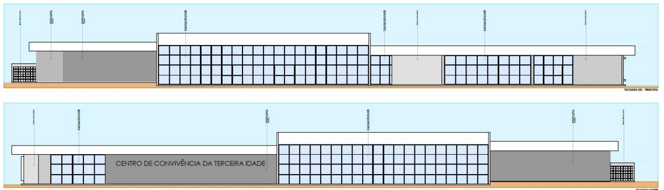
Figura 3: Fachadas do Centro do Idoso. (Fonte: Dos Autores 2020).