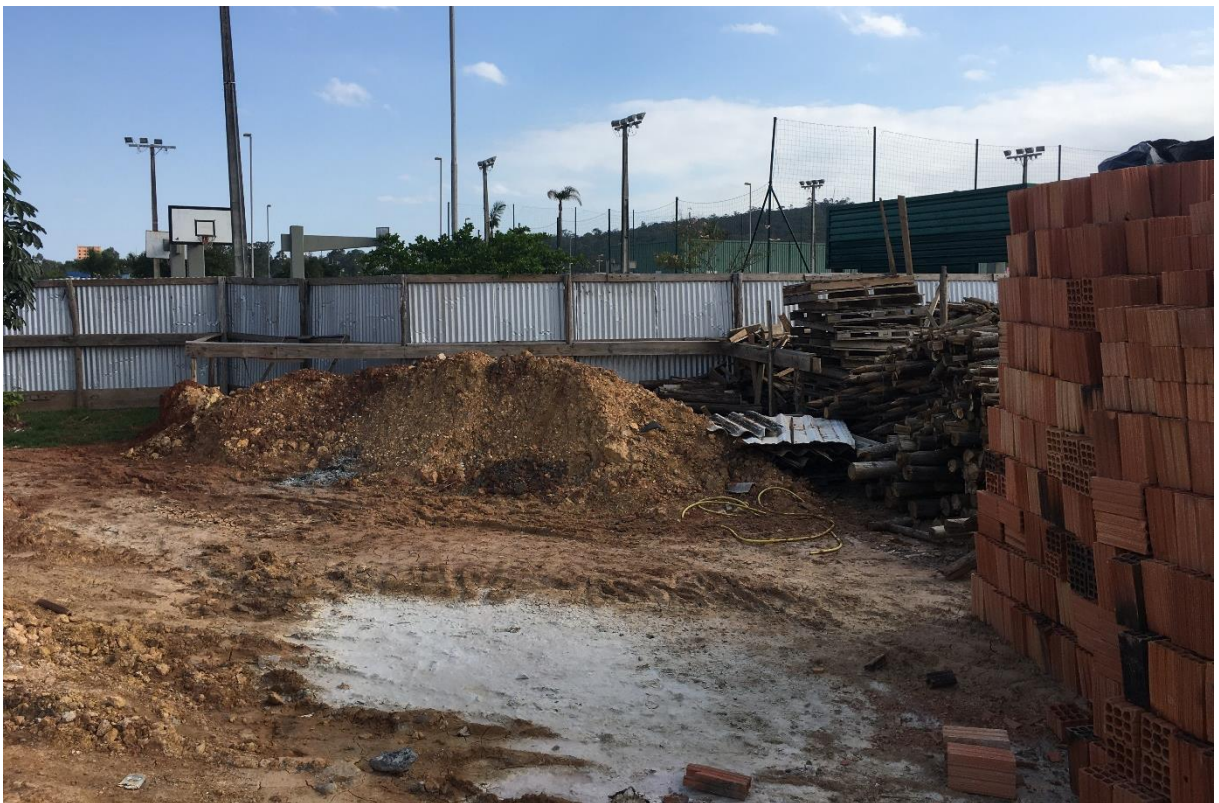
Figura 9: Materiais em contato com umidade do solo.