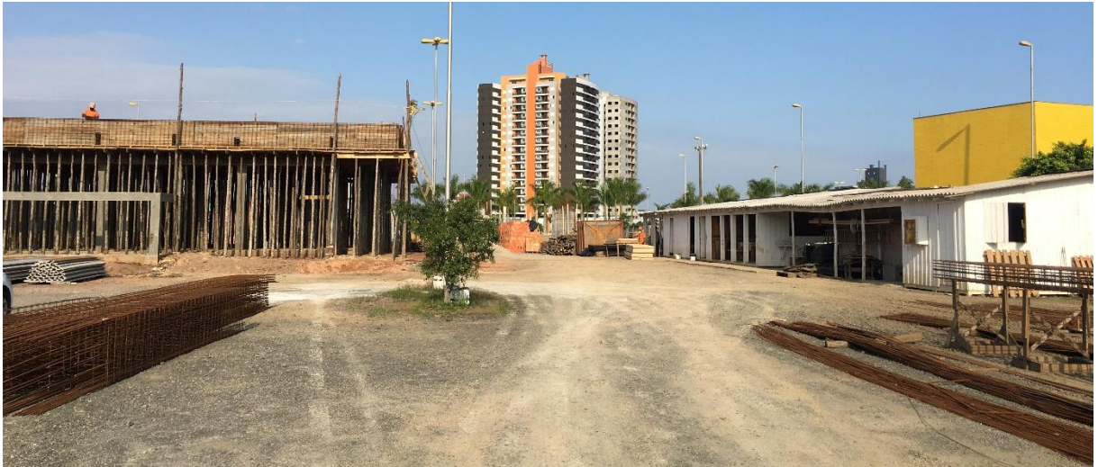
Figura 5: Canteiro de obras. (Fonte: Dos Autores 2020).