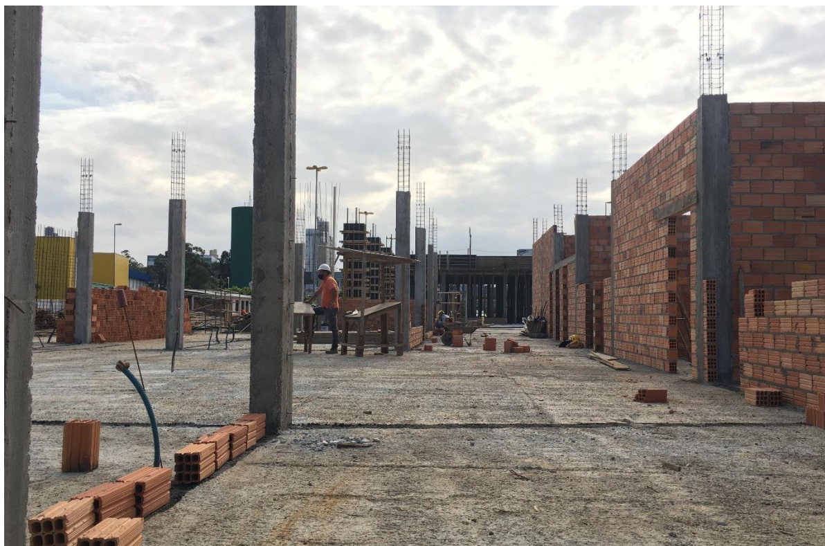
Figura 12: Paredes de tijolos cerâmicos em construção.