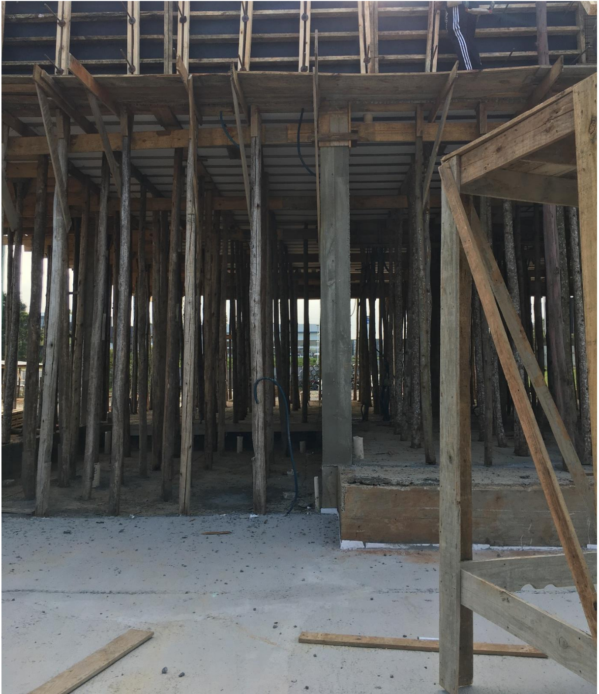
Figura 10: Escoramento da laje. (Fonte: Dos Autores 2020).

No dia da visita, a laje da fachada leste estava em fase de construção, ainda com escoramentos. A área do salão de festas já possuía os pilares estruturados. Em outros ambientes as paredes externas e internas de alvenaria já estavam sendo levantadas.