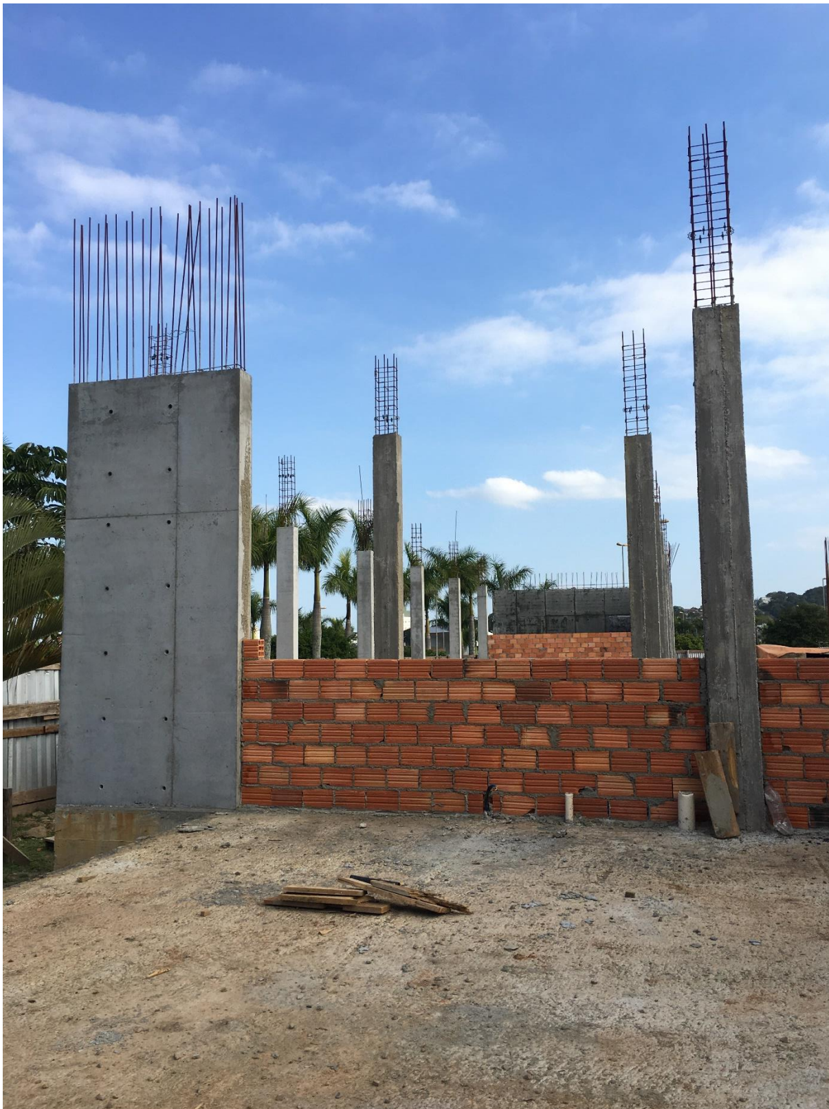
Figura 13: Paredes de tijolos cerâmicos em construção.