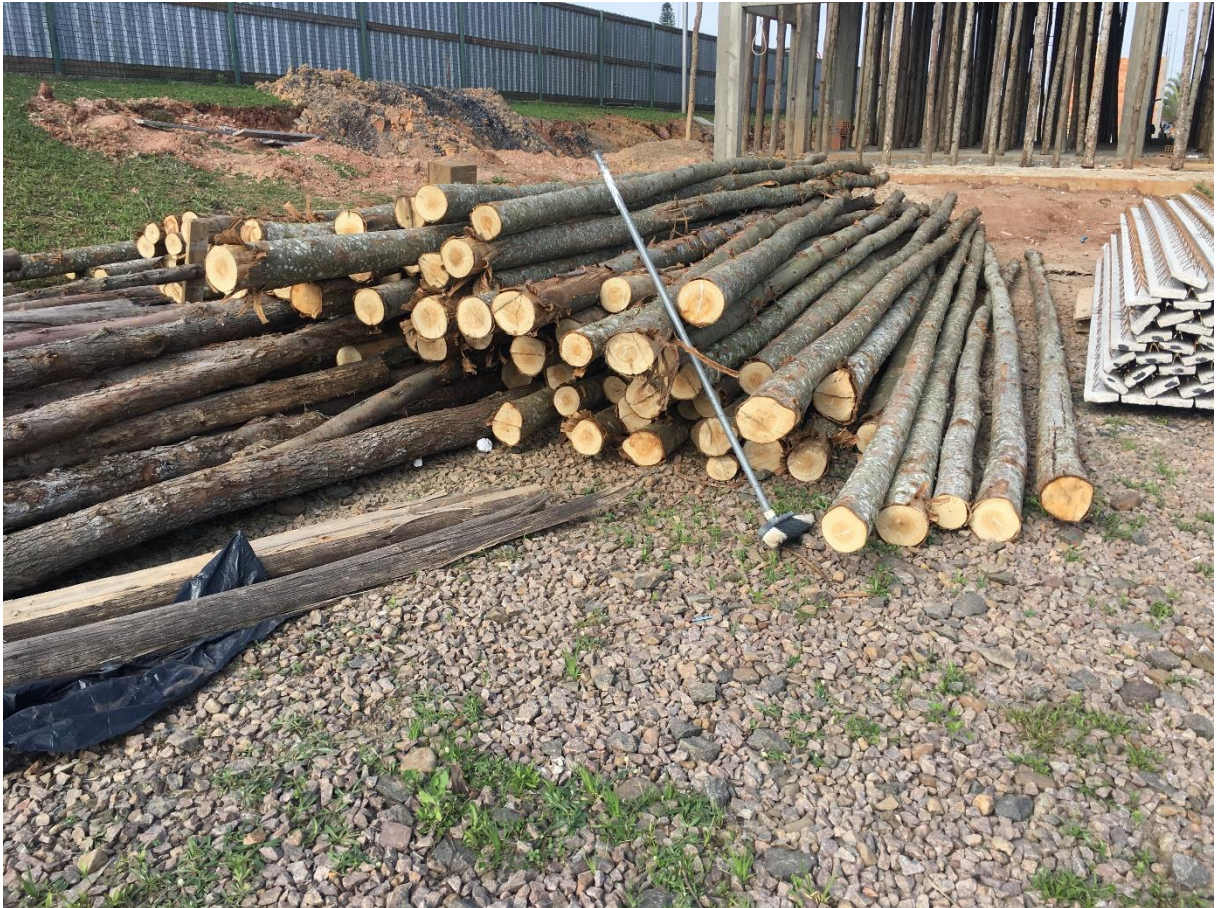
Figura 7: Madeira em contato com o solo.

Aos redores da obra em execução a equipe notou alguns fatores importantes, dentre eles, o armazenamento dos materiais e a limpeza do canteiro de obra. Alguns materiais não tinham proteção e estavam em contato direto com o solo. Já outros, estavam corretamente armazenados em cima de palets.