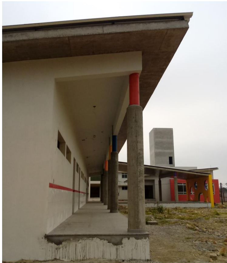
Figura 10: Corredor do último bloco.