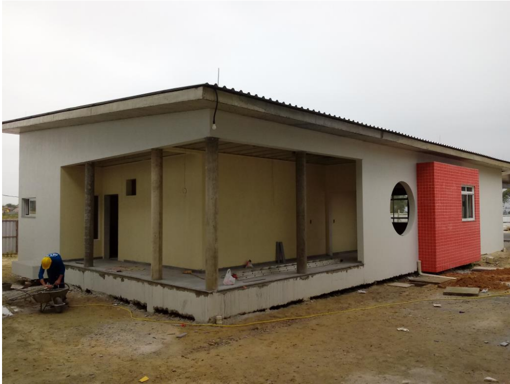
Figura 20: Vista frontal e lateral.

Na parte externa da obra grande parte dos serviços já foi concluído, visto que faltam a colocação dos vidros, pisos da rampa de acesso e alguns detalhes de acabamento e pintura. Já na parte interna: colocação de portas, iluminação e finalização dos sanitários.