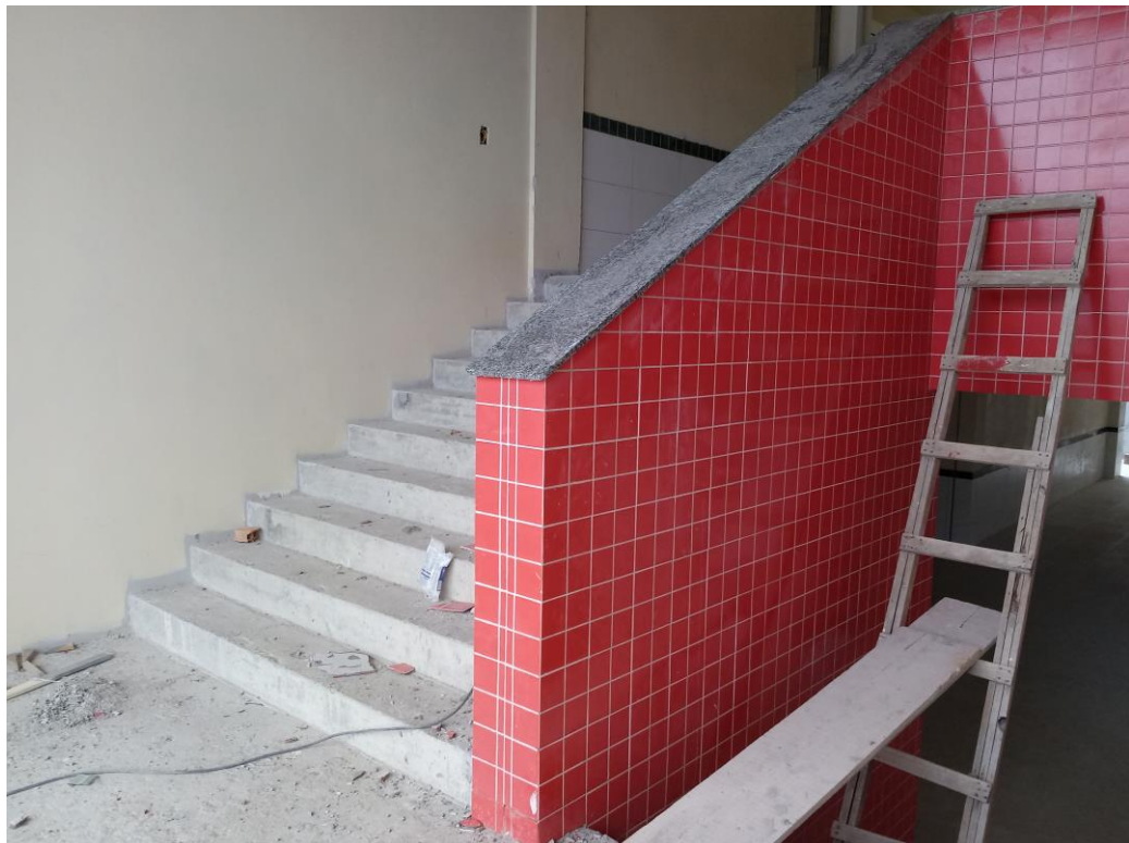
Figura 19: Revestimento cerâmico aplicado.