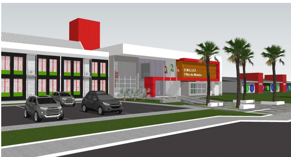
Figura 3: Perspectiva Frontal E.M.E.I.E.F. Filho do Mineiro. (Fonte: PMC).