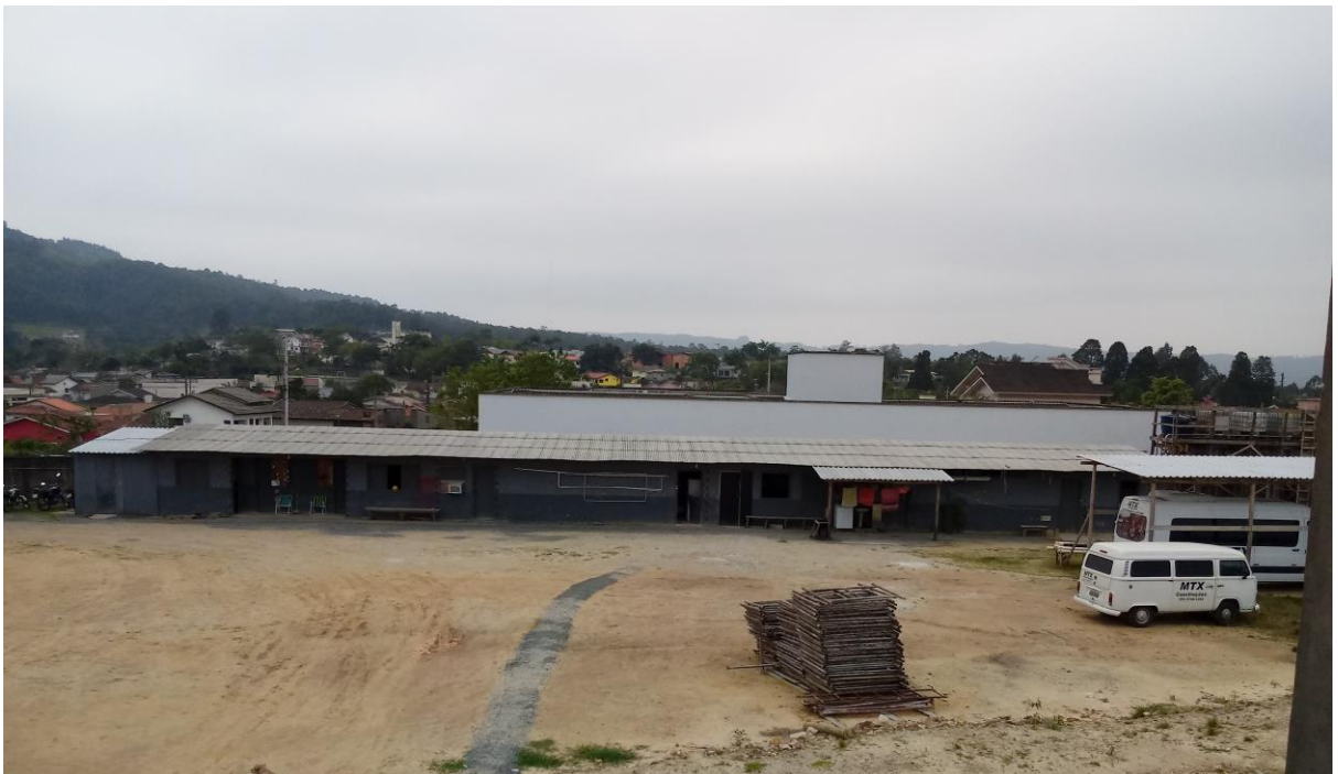
Figura 8: Acomodação.