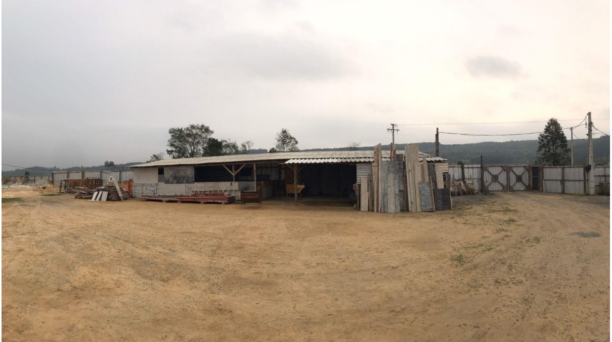
Figura 7: Barracão. (Fonte: Dos Autores 2021).

Logo na entrada, a Câmara de Infraestrutura do Observatório Social percebeu que as ferramentas e os materiais estavam bem organizados e armazenados dentro do barracão. A segunda imagem apresenta a acomodação dos colaboradores da obra.