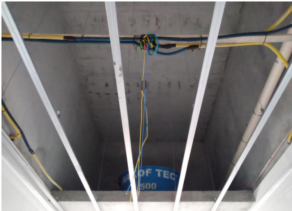
Figura 11: Caixa d'água e fios elétricos.