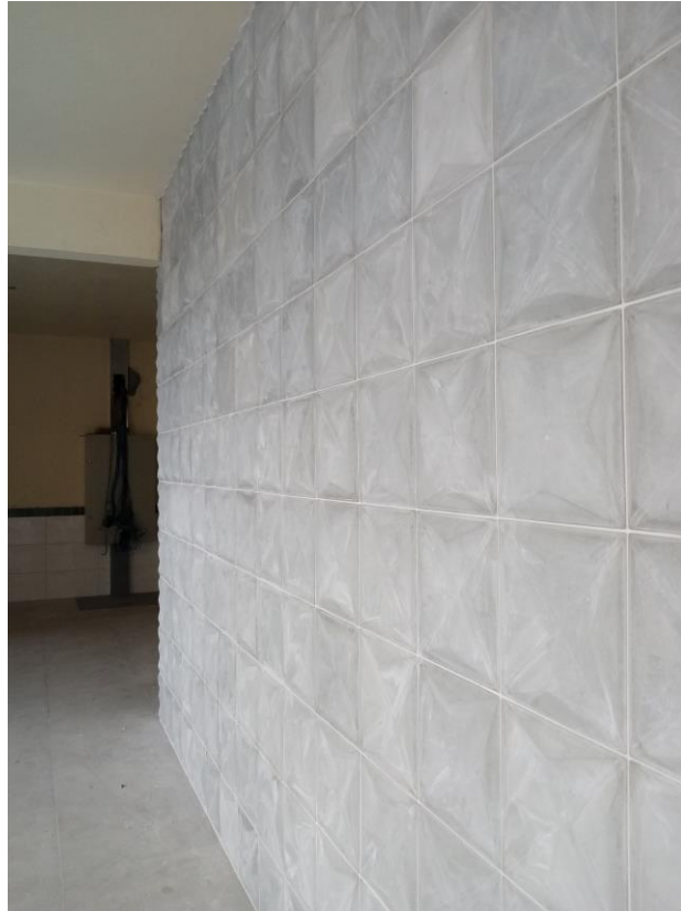
Figura 18: Revestimento cerâmico aplicado.