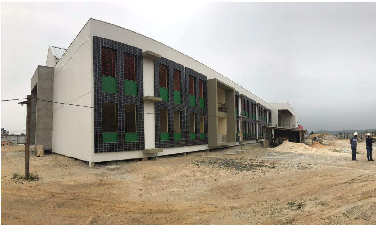
Figura 6: Fachada da E.M.E.I.E.F. Filho do Mineiro. (Fonte: Dos Autores 2021).