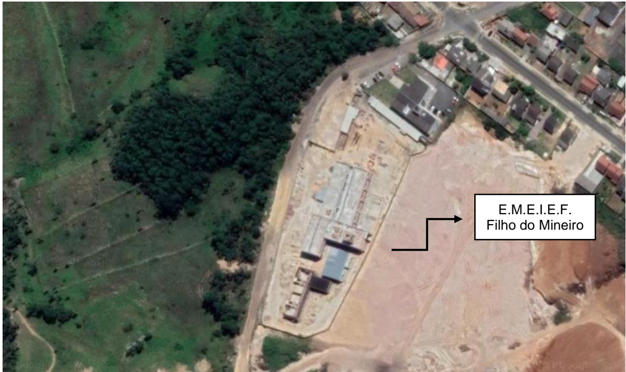
Figura 1: Localização da E.M.E.I.E.F. Filho do Mineiro. (Fonte: Google Maps 2021).

A obra acompanhada é a obra de construção da E.M.E.I.E.F. Filho Do Mineiro, que está localizada na rua João Manoel Sebastião – Bairro Metropol no município de Criciúma/SC.