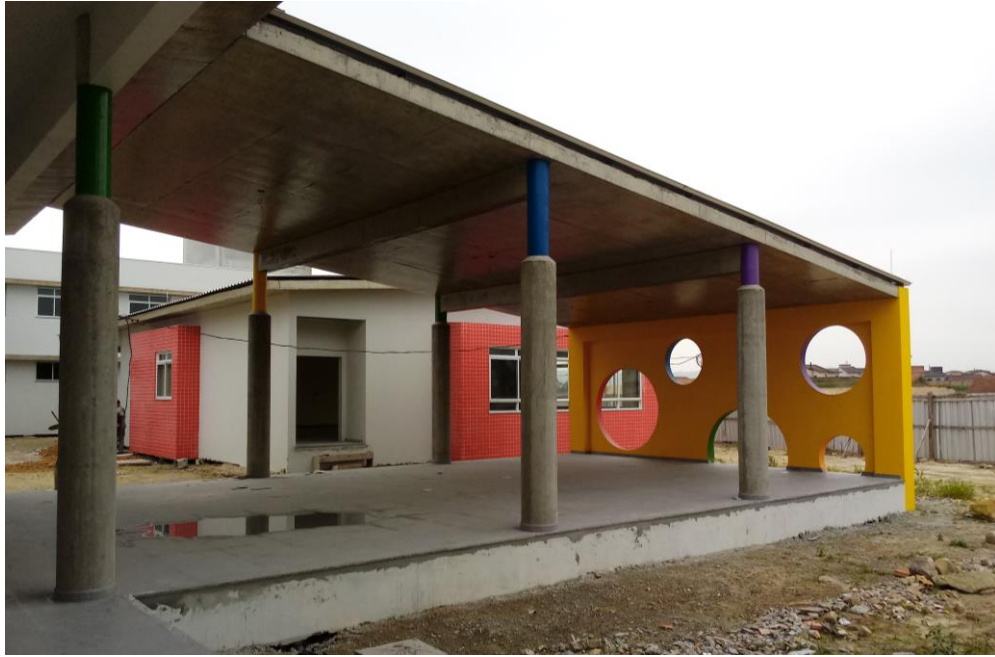
Figura 12: Parte recreativa.