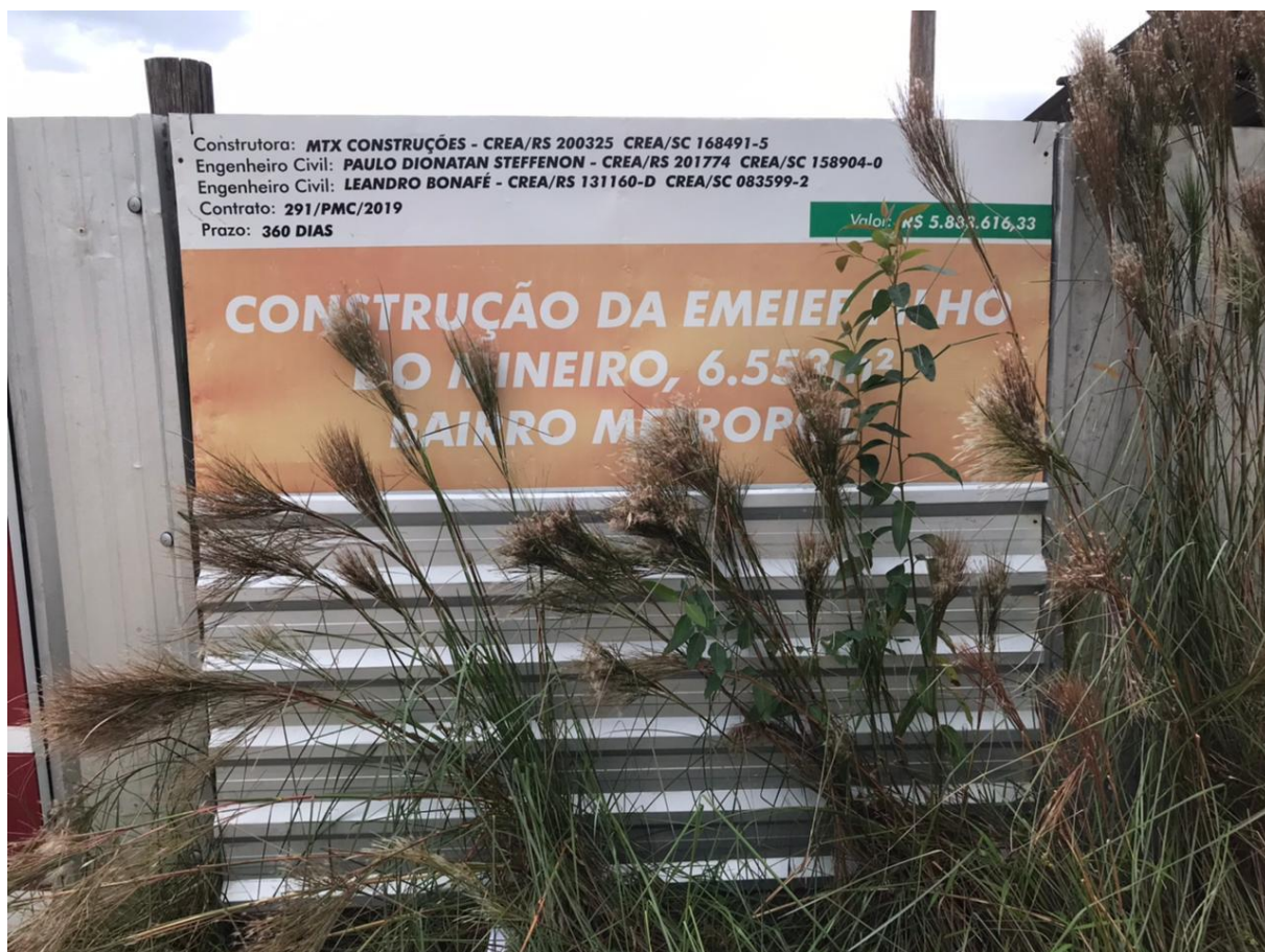
Figura 4: Placa da obra de construção da escola. (Fonte: Dos Autores 2021).

No dia 24 de agosto de 2021, a Câmara de Infraestrutura do Observatório Social de Criciúma realizou a 2ª visita a obra de construção da E.M.E.I.E.F. Filho do Mineiro, a fim de verificar as reais condições referente a sua construção. A visita durou cerca de uma hora.