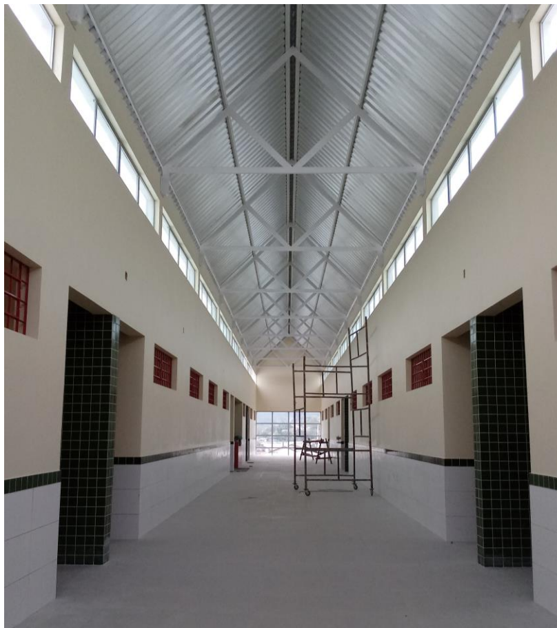
Figura 16: Corredor principal com telhas de aço.