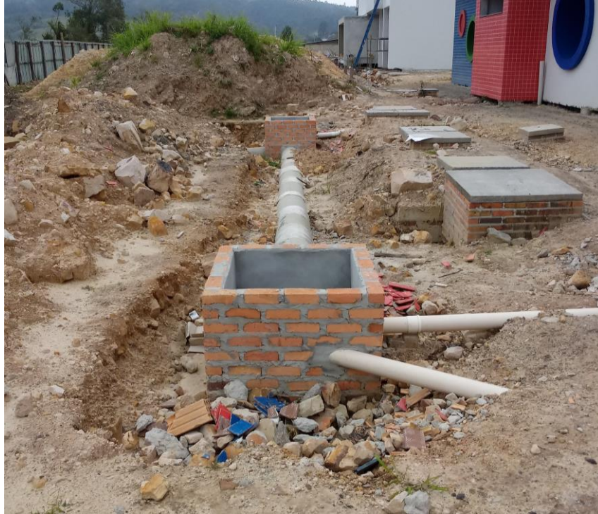
Figura 10: Instalação de poços e fossas.

Observou-se que a obra estava sendo finalizada, haviam sido concluídas algumas pinturas, instalação de azulejos e projeto elétrico; o projeto hidráulico estava também em fase de finalização.