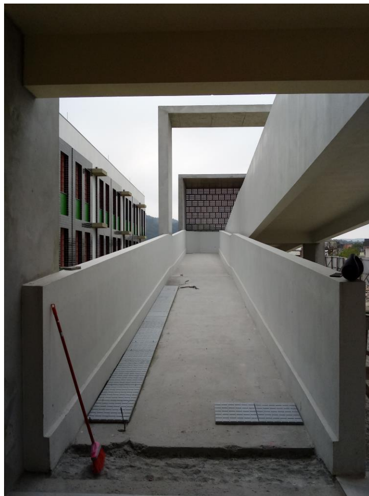
Figura 13: Rampa de acesso as salas de aula. (Fonte: Dos Autores 2021)