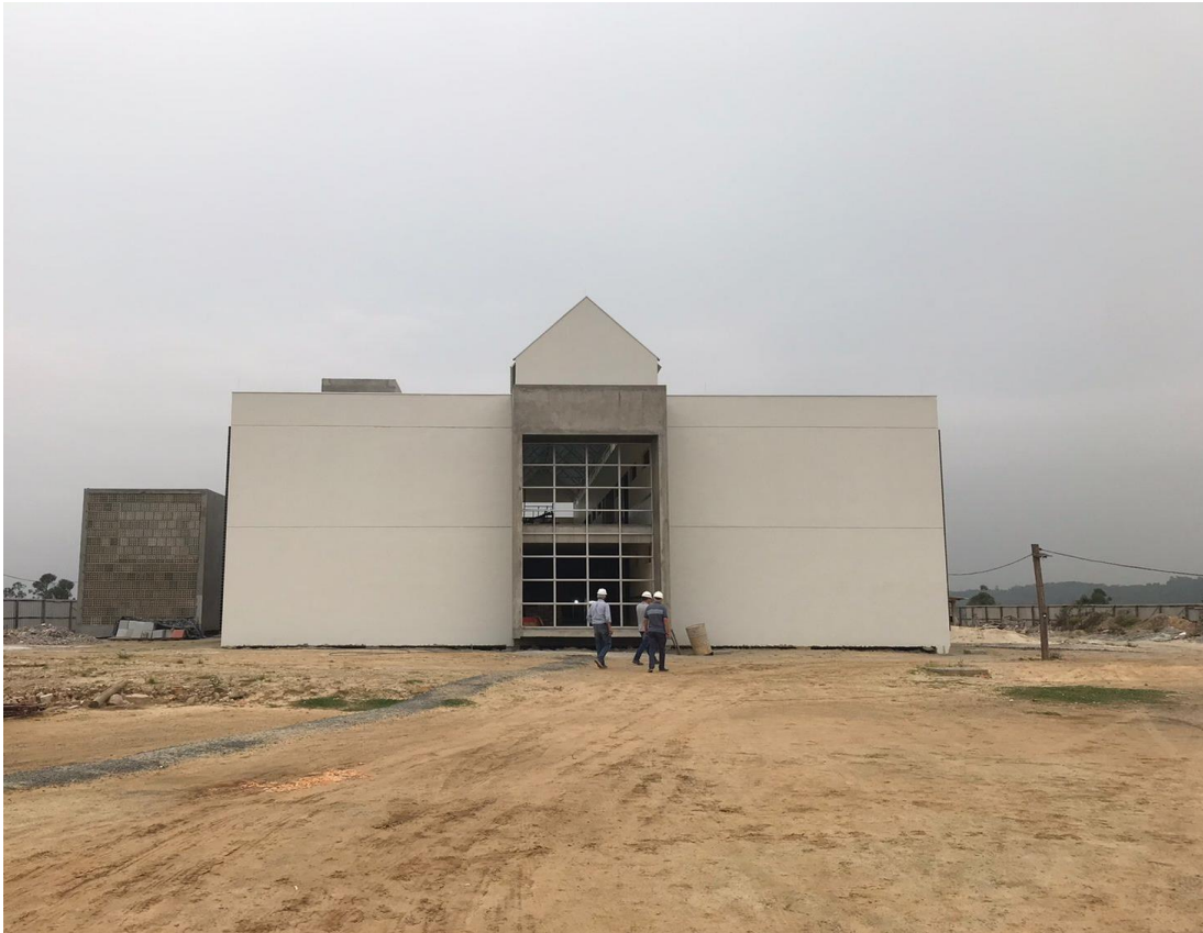
Figura 5: Entrada do canteiro de obras. (Fonte: Dos Autores 2021).