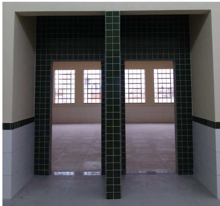
Figura 15: Entrada das salas de aula.