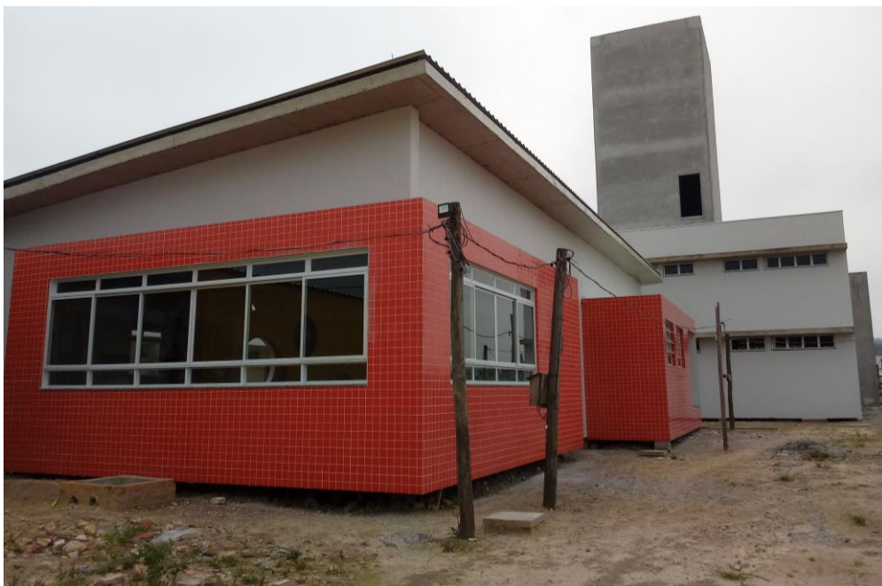
Figura 21: Refeitório. (Fonte: Dos Autores 2021).