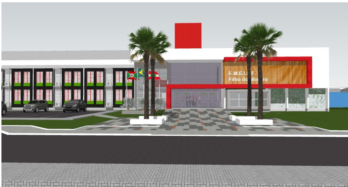
Figura 2: Fachada Leste E.M.E.I.E.F. Filho do Mineiro.