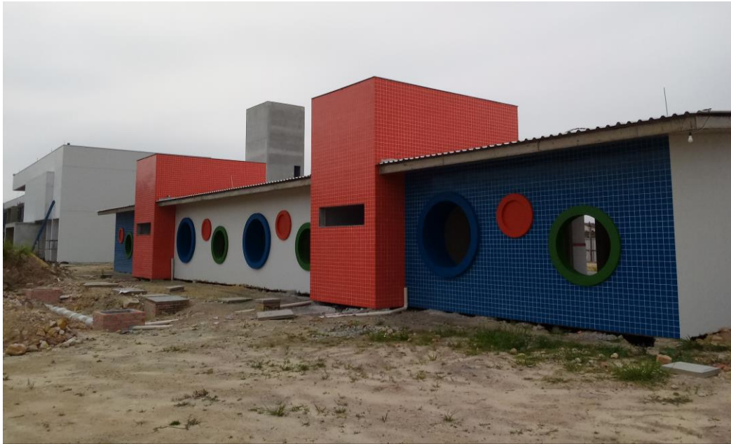
Figura 9: Fachada da Instituição de ensino.