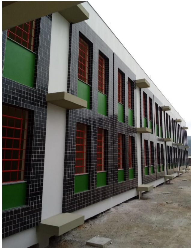
Figura 14: Salas de aula revestidas externamente.

Foram instaladas também as esquadrias das janelas e colocadas portas em alguns espaços.